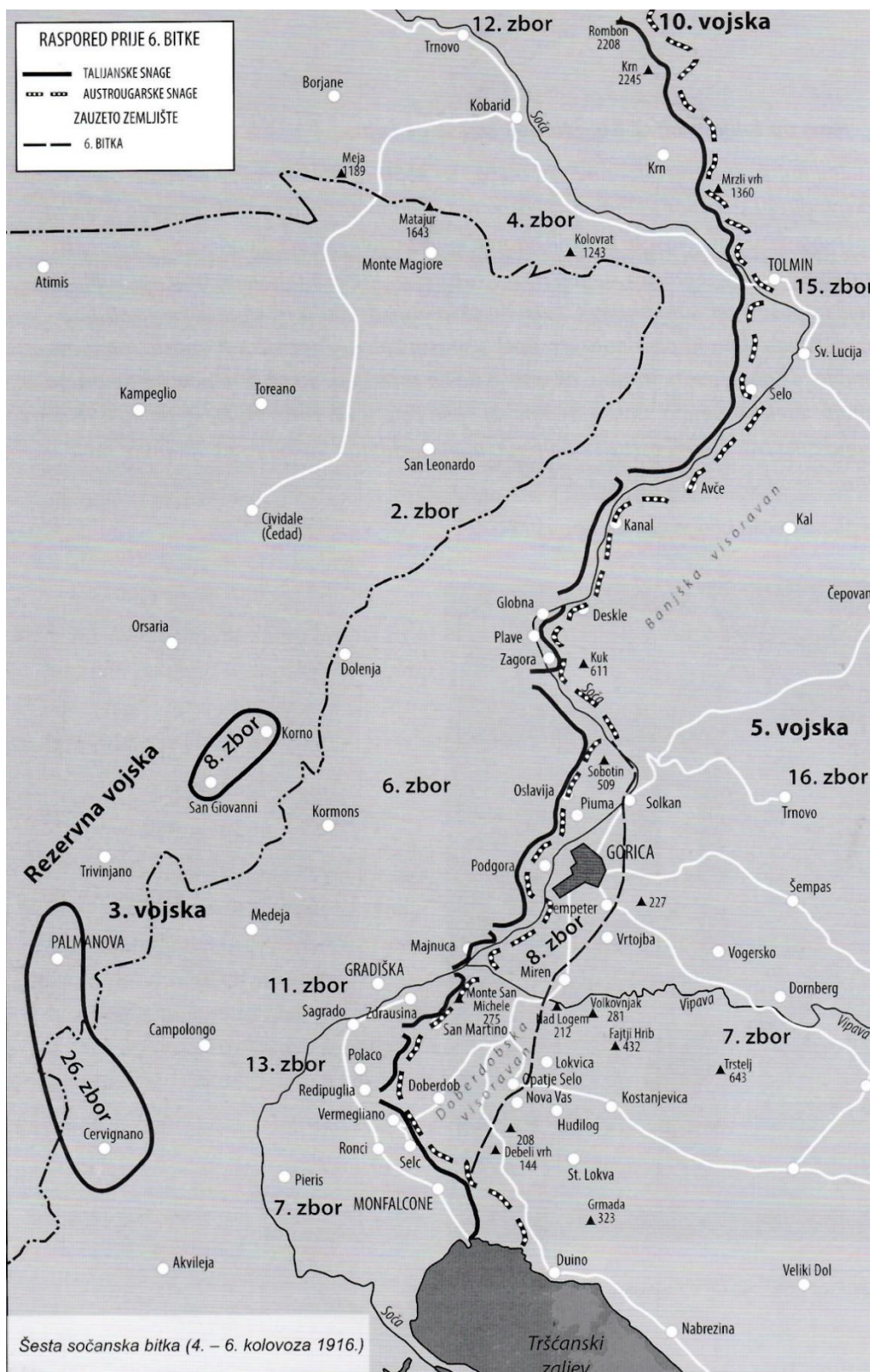
Slika 2.: Raspored snaga u Šestoj sočanskoj bitci s vidljivim talijanskim napredovanjem