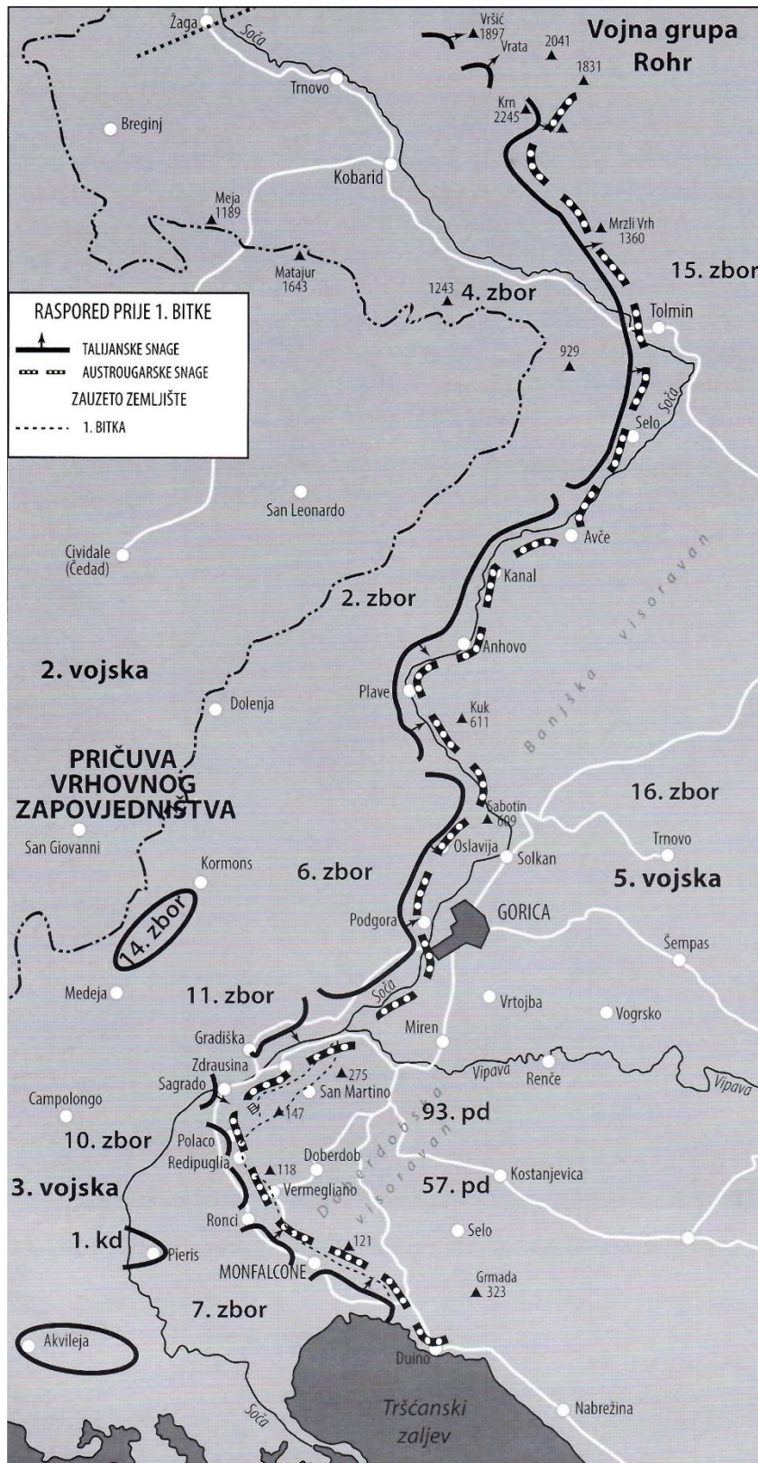
Slika 1: Raspored snaga u Prvoj sočanskoj bitci