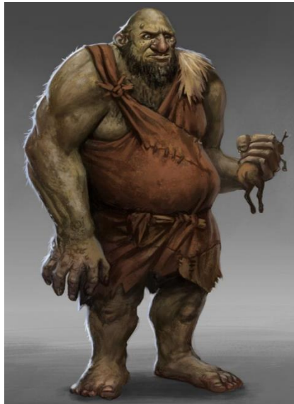
Fotografija broj 3. Div. 48

Osim toga u djelu se spominje i poludiv Hagrida koji je predstavljao Harryjevu očinsku figuru. Hagridova majka je bila div, a otac mu je bio čarobnjak. Hagrid nije bio visok kao punokrvni divovi, ali bio je viši od običnih čarobnjaka. Hagrid je za razliku od većine divova imao dobro srce te je bez razmišljanja bio na strani dobra. Divovi su podijeljeni i kada se uzmu u obzir njihova osobnost što je vidljivo u njihovom doprinosu ili manjku istoga u ratu.