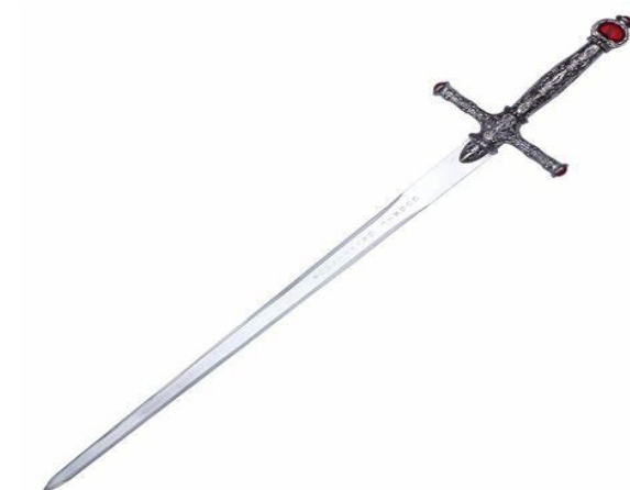
Fotografija broj 6. Mač Godrica Gryffindora . 65