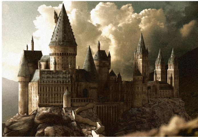
Fotografija broj 2. Škola Čarobnjaštva i vještičarenja Hogwarts. 34