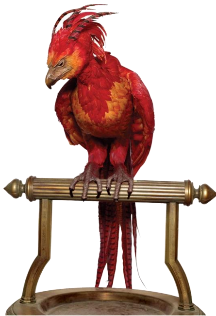
Fotografija broj 4. Feniks 50

Pored navedenoga, feniksovo perje igra bitnu ulogu kada je u pitanju povezanost između Harryja Pottera i Lorda Voldemorta te njihovih štapića. Vanjski dio štapića izrađen je od raznih vrsta drveća, a jezgra štapića izrađena je od dijelova fantastičnih bića uključujući feniksovo perje, dlaku jednoroga i zmajevo srce što ih čini međusobno povezanima.