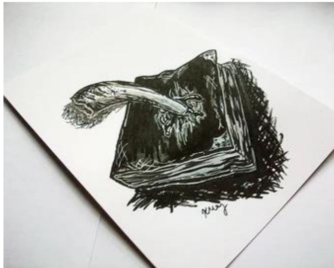
Fotografija broj 8. Dnevnik Toma Riddlea 77

„Dio Lorda Voldemorta živi unutar Harryja. To je ono što mu daje moć govora sa zmijama i povezanost s umom Lorda Voldemorta koju nikada nije razumio. I dok je taj fragment duše, neotkriven od Voldemorta, ostaje vezan i zaštićen od Harryja, Lord Voldemort ne može umrijeti.” 76