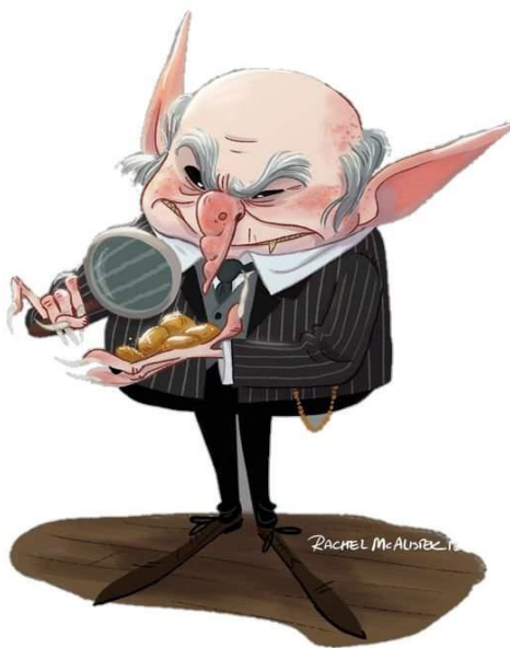
Fotografija broj 5. Goblin 54

Goblini su prilagođeni društvu čarobnjaka i vještica, ali samo prividno. Sudjeluju u razvoju magičnoga svijeta iz koristoljublja: „Dužnosti koje loše odgovaraju dostojanstvu moje rase”, 52 odgovorio je goblin, njegov je glas grublji i manje ljudski kao što je rekao. „Ja nisam kućni vilenjak.” 53