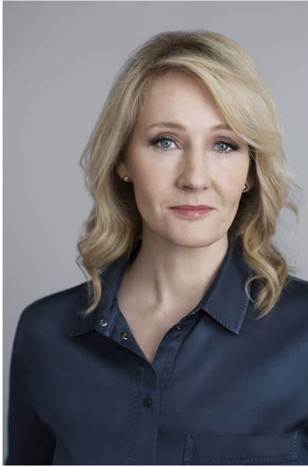
Fotografija broj 1. J. K. Rowling . 4