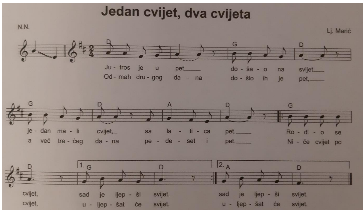
Slika 11. Pjesma „Jedan cvijet, dva cvijeta“