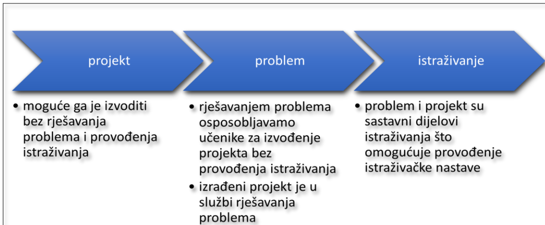
Slika 1. Povezanost projektne, problemske i istraživačke nastave (Modificirano prema Matijević, 2008:196).