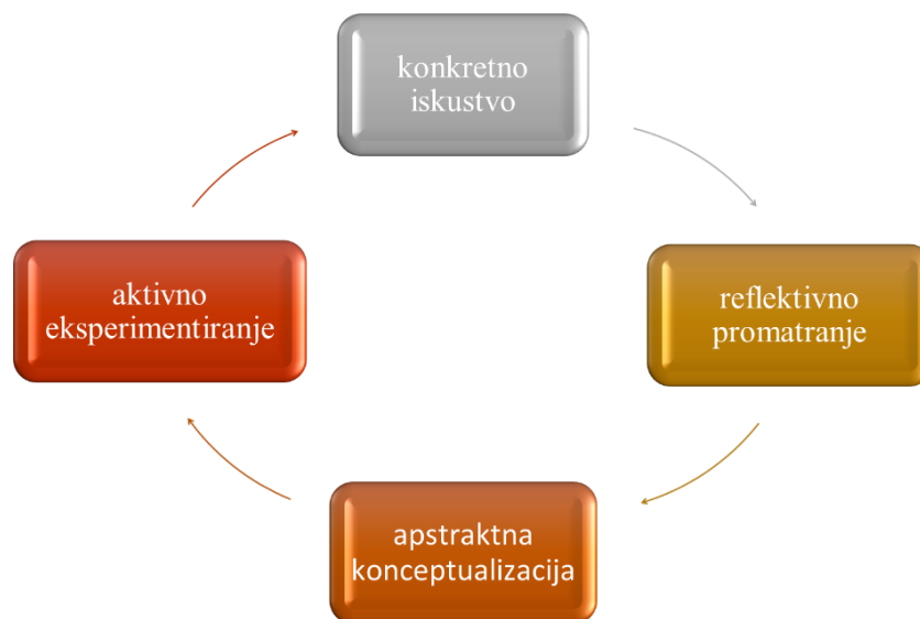
Slika 2. Kolbov model učenja otkrivanjem (Kolb, 1984 prema Roguljić, 2016)

Istraživački pristup danas je jedan od polazišta konstruktivističke nastave, a u obrazovanju je zaživio od sredine 20. stoljeća zbog promjena u modernom društvu. Tadašnji pristupi učenju i poučavanju bili su nedovoljno dobri za osobni i profesionalni razvoj pojedinca, stoga se javlja potreba za novim pristupom učenju koji će pojedincu, u kontekstu odgoja i obrazovanja, omogućiti da kroz samostalno djelovanje stječe kompetencije za život i rad (Krijan, 2016). Danas se istraživački pristup u nastavi realizira kroz učenje otkrivanjem i učenje istraživanjem (Velički, Topolovčan, 2018). Učenici otkrivaju na temelju vlastitih osjetila te provode istraživanja kako bi stekli spoznaje o određenom području. Dakle, temelj istraživačke nastave je upravo individualno iskustvo učenika i njihovo djelovanje. Prema Hurstu (1972), u istraživačkoj nastavi se obrađuju postojeći koncepti znanja te potiče stvaranje novih. Kako Wale i Bishaw (2020) navode, istraživačkim učenjem učenici otkrivaju niz različitih perspektiva i koncepata u njihovom okruženju. Kagen (1965, prema Hurstu, 1972) navodi da je istraživačko učenje samostalno, samoorganizirano i proaktivno učenje koje rezultira stvaranjem dugoročnog i primjenjivog znanja. Na osnovu brojnih tumačenja prirode učenja izrađen je model prema kojemu učenici stječu znanje kroz četiri faze (Kolb, 1984).