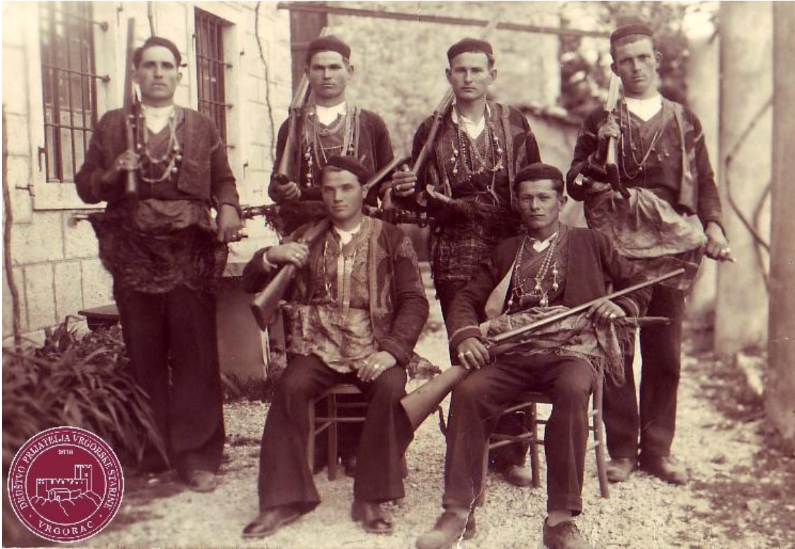
Slika 2: Rondari Župe Navještenja Blažene Djevice Marije (Vrgorac)