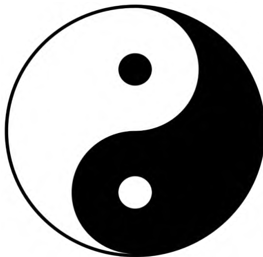
Slika 2. Yin i Yang 41