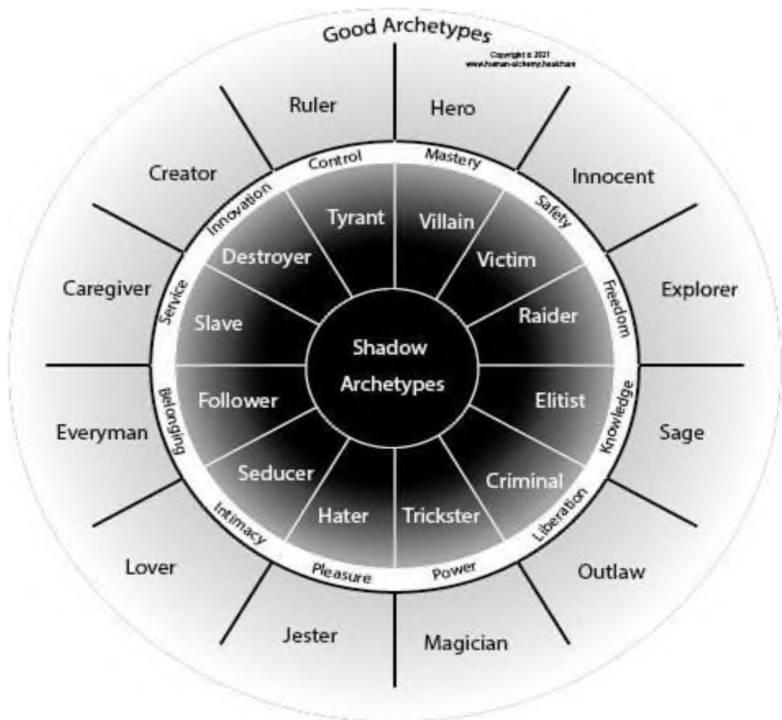
Slika 1 Dvovidnost arhetipa. 10

nesvjesnog (ibid.). Osim toga, način na koji se može proniknuti u sferu kolektivnog nesvjesnog jest putem arhetipa, odnosno znakova, simbola ili obrazaca ponašanja i razmišljanja koji su naslijeđeni od predaka. Te mitološke slike i kulturalni simboli nisu fiksirani već se isprepliću i kombiniraju. Neki od arhetipa po Jungu su: rođenje, smrt, moć, ponovno rođenje, anima, dijete, heroj i majka (ibid.). Arhetipi se ne pokazuju samo u doslovnom smislu, već i u metaforama, primjerice arhetip majke ispunjavaju: vrt, plodno polje, izvor vode, država, crkva, zemlja, Bogorodica, more, šuma, itd. Taj arhetip je dvovidan, odnosno dolazi u svom pozitivnom i negativnom obliku što se može vidjeti na slici 1.1.