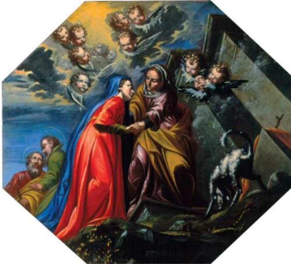
Slika 23. Susret Marije i Elizabete

Poklonstvom pastira (Rođenjem Kristovim) ispunjena su predskazanja proroka i sibila o rođenju Spasitelja. Tema Kristovog rođenja od vremena Tridentinskog koncila se izražava Poklonjenjem pastira, a ne kao u romanici predstavljanjem Kristova rođenja. To je trenutak kada je Bogorodica bezbolno rodila Krista, poklonila se Djetetu i odala hvalu Gospodinu. Prvi koji su imali čast pokloniti se Nebeskom kralju bili su rođeni u siromaštvu pastiri. Nasuprot Poklonjenju pastira prikazano je Poklonjenje kraljeva. 94