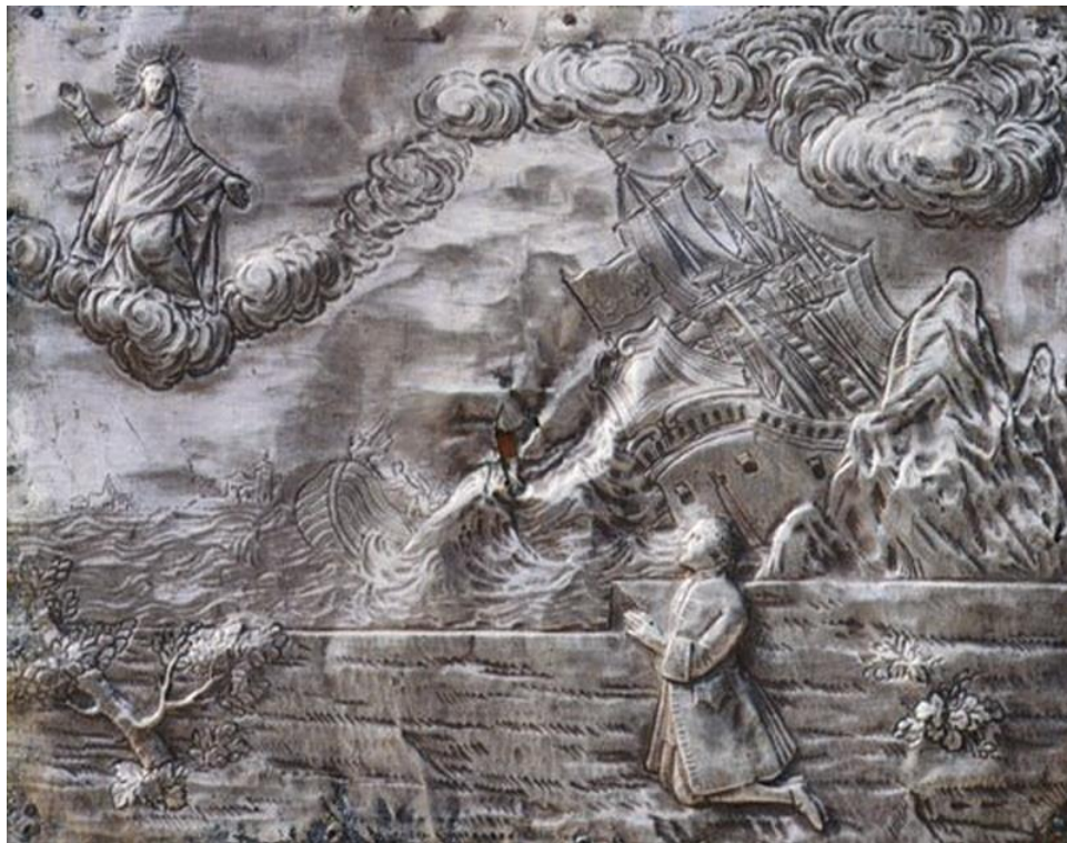
Slika 29. Srebrna votivna pločica

Srebrne pločice različitih veličina i težina učvršćene su u 15 okvira na zidovima svetišta. Stavljene su na dovoljnu visinu kako bi se očuvale od svetogrđnih ruku. Smještaj zavjetnih pločica promijenjen je u moderno vrijeme što se da zaključiti i po redu kojim su postavljene. Daleko su od ikakvog kronološkog rasporeda vjerojatno kako bi se izbjegle moguće krađe te da ih se izloži pogledu javnosti. Težina i debljina srebrnih pločica otkrivala je financijsko stanje naručitelja. Srebro je u to vrijeme bilo skupo te se naručitelj morao žrtvovati u svakodnevnom životu čak i za mali zagovor. Najveći broj zavjetnih pločica dolazio je od strane puka. 104