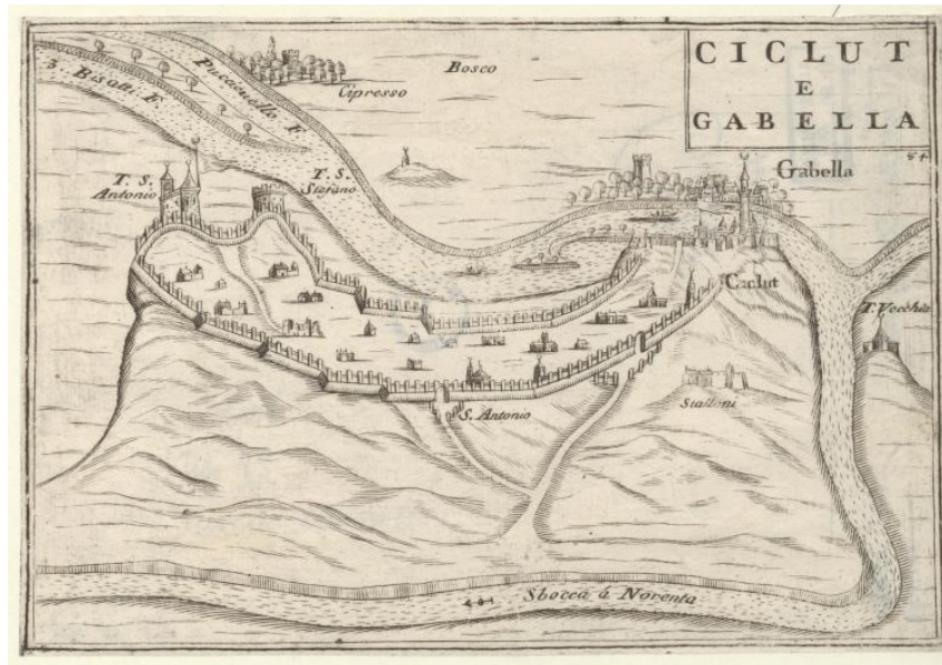
Slika 4 Zemljovid Gabele oko 1700. godine