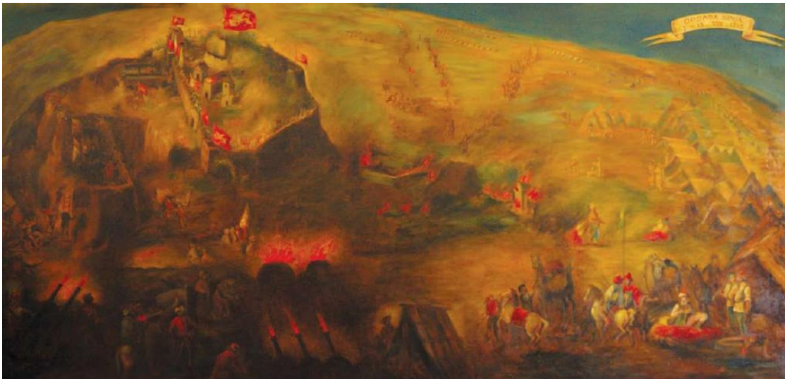
Slika 2 Bitka pod Sinjem, nepoznati autor

Fra Ivan Marković donosi nekoliko izvora koji bi objasnili razlog osmanskog povlačenja. Prvi izvor ostao je najviše zapamćen u Sinju i njegovoj krajini a riječ je o tome kako se u noći sa 14. na 15. kolovoza na zidinama grada ukazala Gospa, odnosno Zaštitnica grada koju su vojnici pod žestokim jurišom osmanske vojske molili u pomoć. Drugi pak izvor donosi podatke o tome kako su dio osmanske vojske činili Arnauti 31 koji su se pobunili zbog toga što su sami poslani u juriš dok s druge strane janjičari nisu. Prema trećem se izvoru smatra kako je razlog za bijeg bio taj što je general Angelo Emo napravio ratnu varku. On je sakupio oko 250 konjanika i ponešto pješaka krajišnika pod zapovjedništvom pukovnika Detricoa te uplašio osmanske trupe tako što je s brda od strane Dicma poslano nekoliko hitaca koji su obasjali nebo kao znak da velika vojska dolazi u pomoć. Također je poznat i izvor kako je osim pobune Arnauta tursku vojsku morila i srdobolja koja je jedan od mogućih razloga za prekid juriša na Sinj. 32