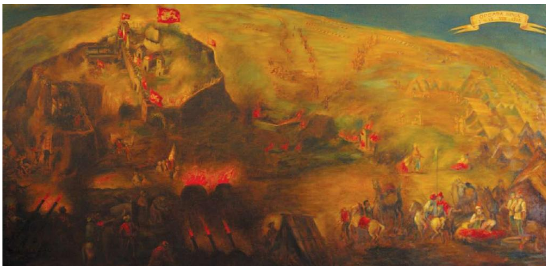
Slika 2 Bitka pod Sinjem, nepoznati autor

Fra Ivan Marković donosi nekoliko izvora koji bi objasnili razlog osmanskog povlačenja. Prvi izvor ostao je najviše zapamćen u Sinju i njegovoj krajini a riječ je o tome kako se u noći sa 14. na 15. kolovoza na zidinama grada ukazala Gospa, odnosno Zaštitnica grada koju su vojnici pod žestokim jurišom osmanske vojske molili u pomoć. Drugi pak izvor donosi podatke o tome kako su dio osmanske vojske činili Arnauti 31 koji su se pobunili zbog toga što su sami poslani u juriš dok s druge strane janjičari nisu. Prema trećem se izvoru smatra kako je razlog za bijeg bio taj što je general Angelo Emo napravio ratnu varku. On je sakupio oko 250 konjanika i ponešto pješaka krajišnika pod zapovjedništvom pukovnika Detricoa te uplašio osmanske trupe tako što je s brda od strane Dicma poslano nekoliko hitaca koji su obasjali nebo kao znak da velika vojska dolazi u pomoć. Također je poznat i izvor kako je osim pobune Arnauta tursku vojsku morila i srdobolja koja je jedan od mogućih razloga za prekid juriša na Sinj. 32