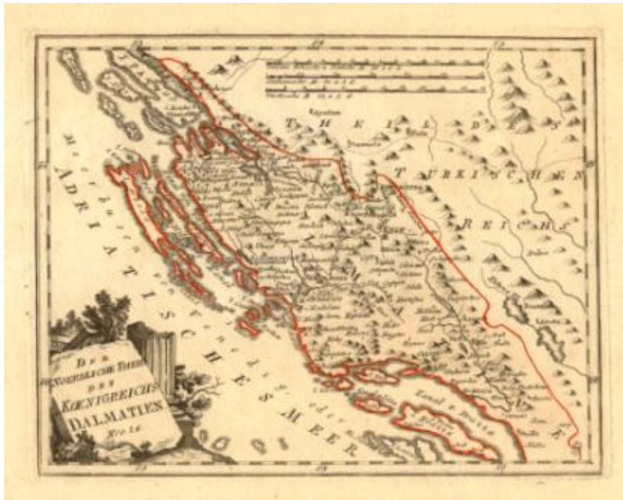
Slika 5 Dalmacija nakon Požarevačkog mira, Linea Mocenigo oko 1730. godine

Venecija je s novoosvojenim područjem postupila jednako kao i s onim kojeg je dobila Karlovačkim mirom. Provela je vlastito uređenje dok je zemlju podijelila onima koji su se istaknuli za vrijeme Drugog morejskog rata čime je svojevrsno uspostavljena nova teritorijalna obrana. 64