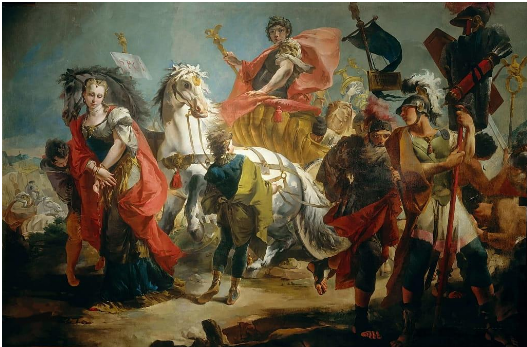
Slika 17. Trijumf Aurelijana, slika Giambattista Tiepola

Aurelijan je dobio herojski doček u Rimu. Senat ga je prozvao „Obnoviteljem Svijeta“ („Restitutor Orbis“) kao čovjeka koji je izbavio Carstvo od teritorijalnog raspada. Trijumf koji je organiziran u njegovu čast je bio spektakl kakav grad nije vidio mnogo godina te je trajao danima. Organizirane su utrke kočija u Circusu Maximusu, teatarske izvedbe, gladijatorske borbe, lov na divlje životinje u areni i velika rekreacija pomorske bitke u Koloseumu. Vrhunac događaja je bio trijumfalna procesija. Bogato ukrašene kočije predvodile su kolonu od kojih su neke pripadale Zenobiji, a jedna je bila dar od perzijskog kralja. Aurelijan je jahao u kočiji gotičkog kralja uzetog u borbi do hrama Jupitera Maximusa na Kapitolijском brdu. Njega su pratile egzotične životinje iz svakog kuta carstva uz predstavnike raznih naroda van granica carstva poput Aksumita, Perzijanaca, Indijaca, Baktrijanaca i sličnih egzotičnih naroda. Njih su pratili zarobljenici iz raznih barbarskih naroda koje su rimske vojske porazile, a iza njih su slijedili pobunjenici iz Egipta, zarobljeno plemstvo Palmire, Tetrik sa svojim sinom i na kraju Zenobija u zlatnim lancima i draguljima. Za kraj, Aurelijan je svečano posvetio hram Nepobjedivog Sunca, najveličanstvenije nove građevine od vremena gradnje Karakalnih kupki. 37