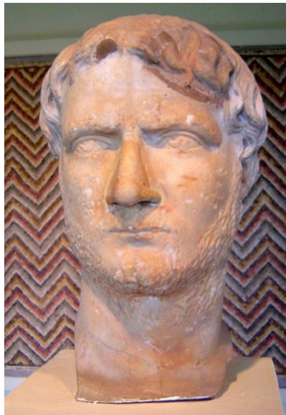
Slika 5. Car Galijen

Valerijanov poraz ostavlja čitav istok neobranjen od perzijske invazije. Antiohija, Tarsus, Cezareja u Kapadokiji padaju pod perzijsku kontrolu. Makrijan, glavni intendant za istok uz pomoć Valerijanovog zapovjednika Kaliste uspijeva okupiti ostatke rimske vojske i poraziti Perzijance na Cilicijskoj obali kod Corycusa. Nakon ovog uspjeha Makrijan proglašava svoja dva sina Makrijana Mlađeg i Kvijeta carevima. U pohodu na zapada oba Makrijana pogibaju u borbi protiv Galijenovog zapovjenika Aureola. Galijen uspijeva pridobiti pomoć Odenata, moćnog nasljednog vladara grada Palmire koji u razdoblju od 262-267. godine uspijeva izgurati Perzijance i ponovno osvojiti veliki dio Mezopotamije. Galijen ga nagrađuje titulom Imperator zbog očuvanja rimskog istoka. Iako je ostao vjeran Rimu Odenat je bio funkcionalno vladar rimskog istoka. Za to vrijeme Galijen odgovara na ogromnu prijetnju invazije Gota koji pljačkaju Grčku i Malu Aziju. Galijen uspijeva ostvariti veliku pobjedu kod Najsa (današnjeg Niša) 268. godine i nanosi Gotima ogromne gubitke. Galijen neće moći nastaviti svoj pritisak na Gote jer mora odgovoriti na pobunu u Italiji od svog generala Aureola koji zauzima Mediolan. Tijekom te kampanje stradava u atentatu. Vjeruje se da su dio ove urote činili budući carevi Klaudije i Aurelijan. 12