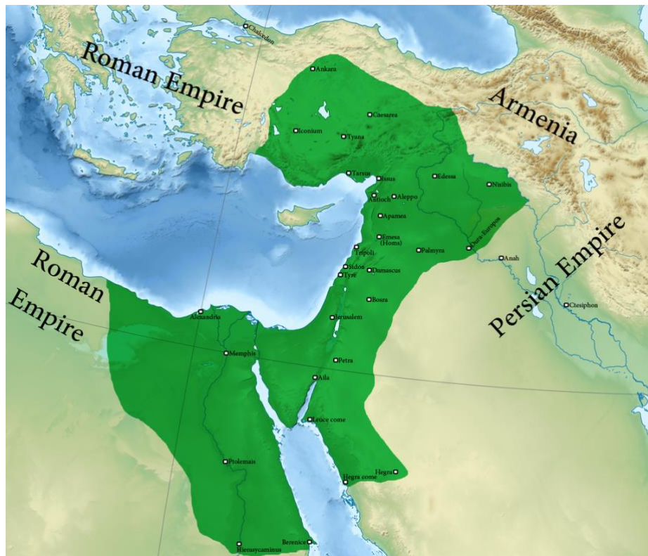
Slika 8. Palmirsko carstvo 271. godine