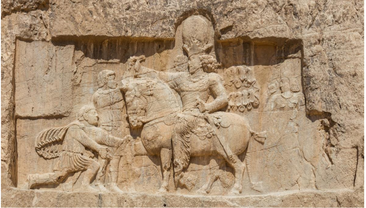
Slika 4. Zarobljavanje cara Valerijana