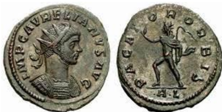
Slika 18. Avers i reverse kovanice s likom cara Aurelijana

Aurelijan je pokrenuo veliku reformu carskog novca u proljeće 274. godine. Po smanjenoj težini i čistoći kovanica uvedeni su denariji, dupli sestercij i sestercij. Najveći doprinos je uvođenje dvostrukog denarija, veće kovanice sa višim udjelom srebra. Novčana sredstva stečena pohodom na istok su uvelike olakšali u izdavanju novih kovanica bolje kvalitete i s većim udjelima plemenitih metala. 40 Sustav kovnica novca je isto tako reorganiziran. Kovnica u Rimu je zatvorena, dok je ona u Milanu proširena. Nove kovnice su uspostavljene u Serdici i Lugdunu. Aurelijan je nastavio praksu prošlih careva u približavanju kovnica novca granici u svrhu bržeg i lakšeg plaćanja vojske. Pred kraj njegove vladavine osam velikih kovnica je bilo u uporabi unutar carstva a proizvodnja je narasla za šezdeset posto. 41