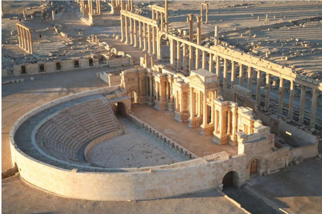
Slika 15. Teatar grada Palmire

Zenobijine vlasti poput Zabdasa i Loginija su pogubljeni. Zbog povratka istoka pod rimsku vlast Aurelijan si dodjeljuje titule „Parthicus Maximus“ i „Palmyrenicus Maximus“. 33