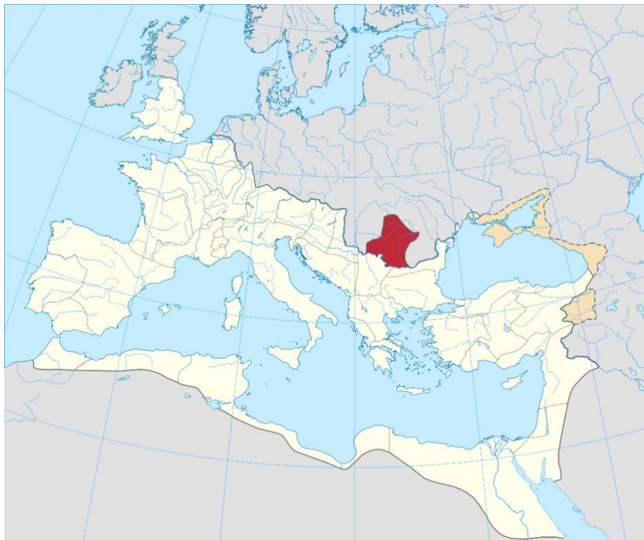
Slika 13. Rimska provincija Dacija

Aurelijan kreće u novi pohod sa velikom vojskom u jesen 271. prema Maloj Aziji i Trakiji. U seriji pobjeda Goti su potisnuti preko Dunava u svoje zemlje gdje ih prati carska vojska. U borbama pogiba gotski vođa Kanabaud. Aurelijan nije htio dozvoliti Gotima da ponovno u miru reorganiziraju svoje snage i napadaju granice carstva. Aurelijan će svoj uspjeh u borbama protiv Gota okruniti dugotrajnim mirom i prestankom konstantnih invazija. Za ovu pobjedu Senat mu dodjeljuje naslov „Gothicus Maximus“. Nakon pobjede nad Gotima otvorili se pitanje važnosti Dacije. Velike količine sredstava i ljudstva je žrtvovano za održavanje provincija preko Dunava, ali ta područja su konstanto bila na udaru barbarskih napada i pustošenja. Aurelijan donosi konačnu odluku o napuštanju Dacije i premještanju rimskog stanovništva i vojske preko Dunava gdje je bilo lakše braniti granicu. Ovo je bila teška odluka za Aurelijana jer je značila priznanje da Rim ne može braniti sve svoje granice. Novo sjedište Dacije s rimske strane Dunava je bio grad Serdica (današnja Sofija) i tamo je otvorena nova kovnica novca. 26