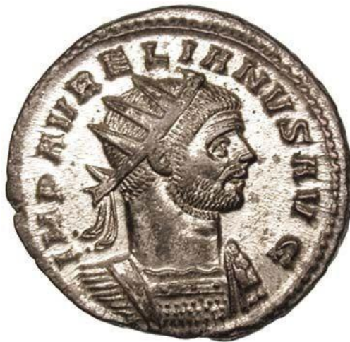
Slika 11. Novac s likom cara Aurelijana

Odmah na početku pozicija novog cara je bila daleko od stabilne. Zapadne provincije su i dalje pod kontrolom Galskog carstva, dok na istoku jača moć Palmire koja ugrožava interese Rima. U isto vrijeme napadi germanskih plemena su konstanta uz duž granice na Dunavu. Aurelijan ulazi u Akvileju početkom studenog te preuzima kontrolu nad talijanskim kovnicama novca u Rimu i Milanu koje počinju kovati novac s likom novog cara te preminulog deificiranog cara Klaudija. Ovaj potez je donesen s ciljem dodatne legitimizacije Aurelijana kao nasljednika popularnog Klaudija te zbližavanju sa Senatom kojeg je Klaudije dobro tretirao. Aurelijanov boravak u Italiji je ostavio Panoniju ranjivom što koriste Vandali te okupljaju vojsku za invaziju. Car žurno organizira svoje snage i vraća se u Panoniju te uspostavlja svoju bazu kod Siscije (današnjeg Siska). U skladu s tradicijom novi car preuzima svoj konzulat na prvi dan nove godine 271. iako po običaju car preuzima funkciju prvog konzula ulaskom u Rim. Ovo odstupanje od tradicije označava daljnje slabljenje važnosti samog grada Rima u kontekstu opadajuće moći države. Vandali uspijevaju probiti limes i pljačkaju nezaštićene rimske zemlje ali ubrzo gube svoj prvotni nalet te su poraženi od strane Aurelijana. Prisiljeni su na primirje s Rimom te uz to dužni predati taoce i ustupiti 2.000 konjanika u službu carske vojske. 19 Od njih je 500 otkazalo poslušnost te su smaknuti. 20