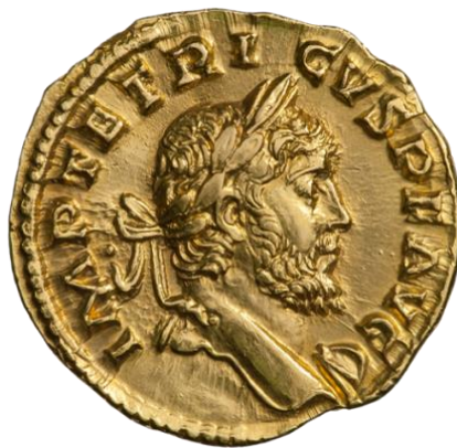
Slika 16. Novac s likom galskog cara Tetrika