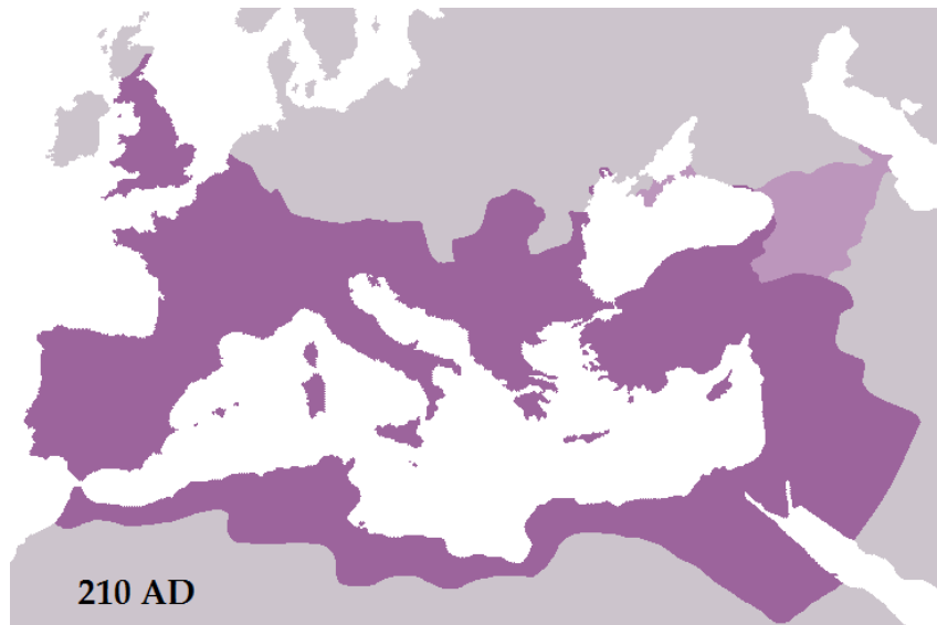
Slika 1. Rimsko Carstvo početkom 3. stoljeća

vojnika koji prelazi na stranu pretendenta Emilijana, a on sam umire ni tri mjeseca poslije od bolesti. 2