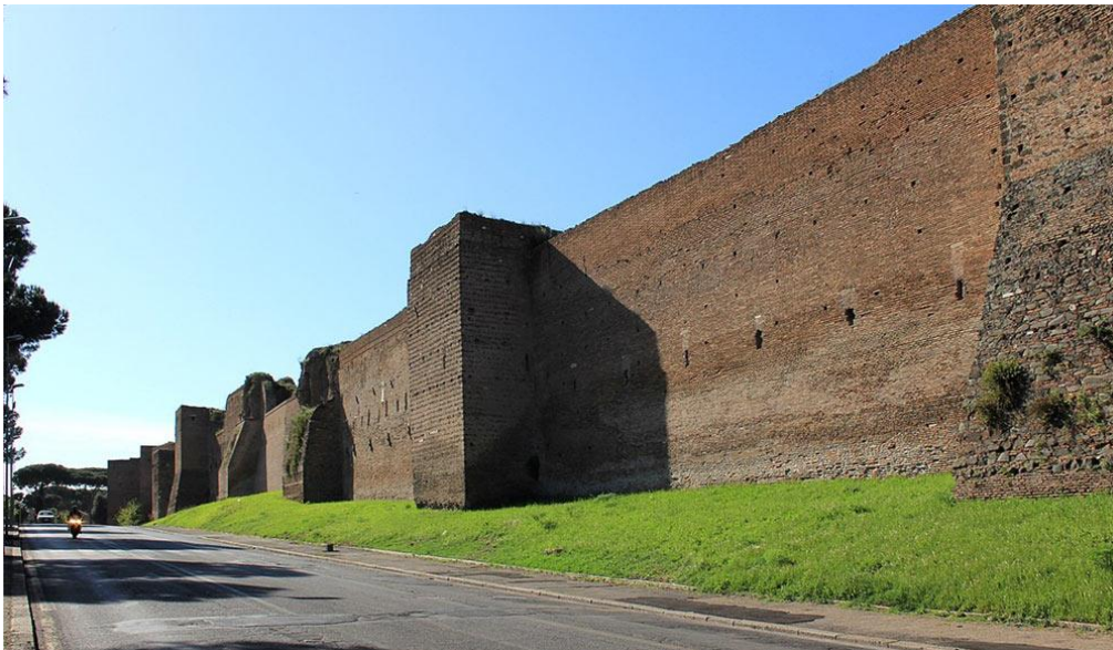
Slika 12. Aurelijanske zidine

Pri povratku u Rim Aurelijana je dočekala pobuna radnika u kovnici novca. Njihov upravitelj Felicim podiže ustanak zbog otpuštanja korumpiranih radnika kovnice. 23 Navodno je život izgubilo preko 7000 pobunjenika, a potraga je odmah krenula za prave organizatore ustanka. Nekolicina senatora je pogubljena dok su drugi bili primorani predati svoju imovinu. Aurelijan je bio nemilosrdan u obračunu s izdajnicima, ali kao konzervativan čovjek duboko je poštovao rimsku tradiciju i s tim instituciju Senata. Oni koju su mu bili odani su bili nagrađivani i odavao je poštovanje koje je vrlo često bili uskraćeno Senatu tako pridobivši ovu moćnu instituciju na svoju stranu. 24 Bilo je nužno poduzeti hitne mjere kako bi se izbjegli budući nemiri uslijed barbarskih prodiranja u Italiju. Grad Rim je odavno prerastao granice svojih starih zidina i glavnom gradu carstva je bila nužna nova zaštita. Aurelijan naređuje izgradnju novih velebnih zidina oko grada koje i dan danas nose njegovo ime. Car se isto tako uhvatio u koštac s monetarnom krizom i preraspodjelom hrane u gradu. Dokle god je moć Palmire postojana na istoku opskrba žitom iz Egipta je pod prijetnjom. Prije nego što se mogao fokusirati na ponovno osvajanje istoka bilo je potrebno stabilizirati situaciju sa gotskima napadima. Sa uspostavom reda u Rimu i početkom izgradnje novih zidova car je ponovno krenuo prema Trakiji. 25