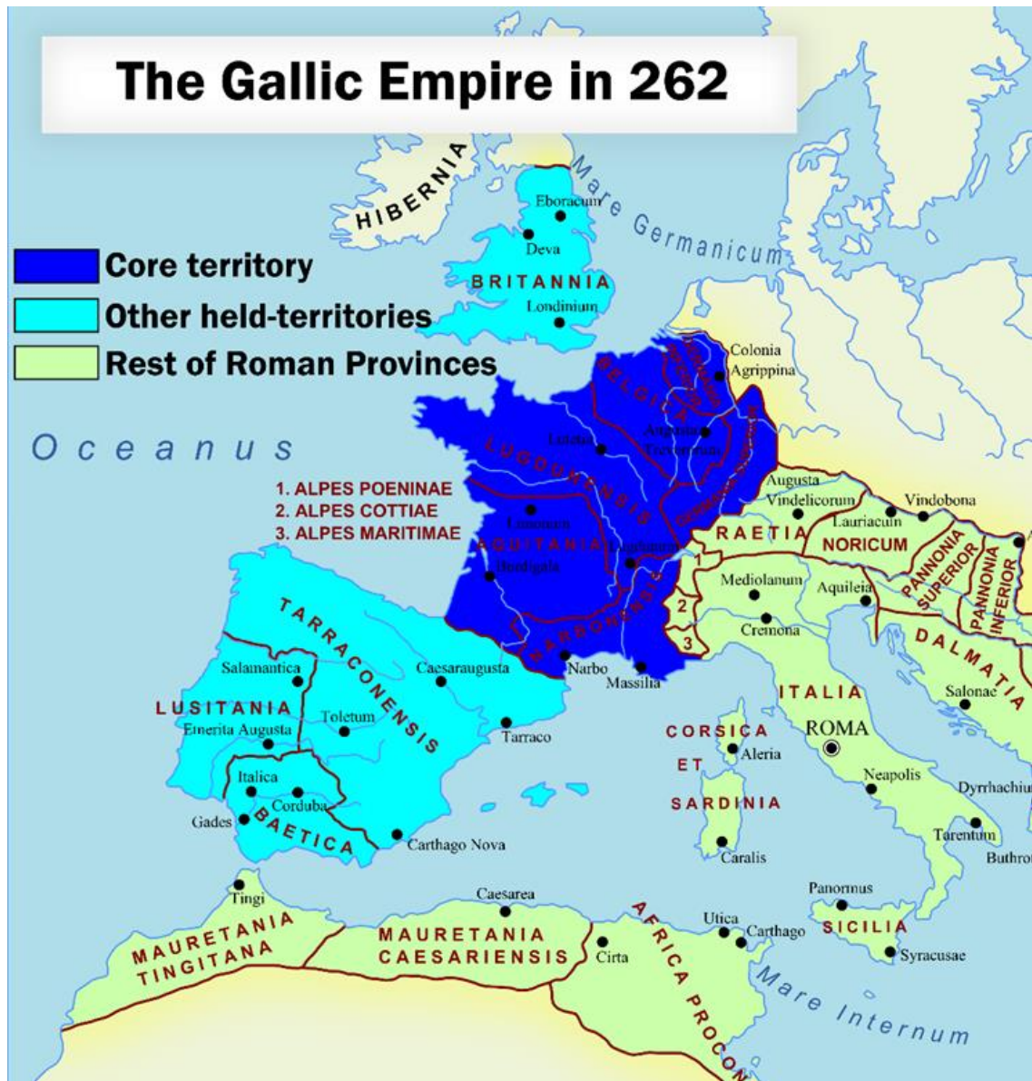
Slika 6. Galsko carstvo 260. godine