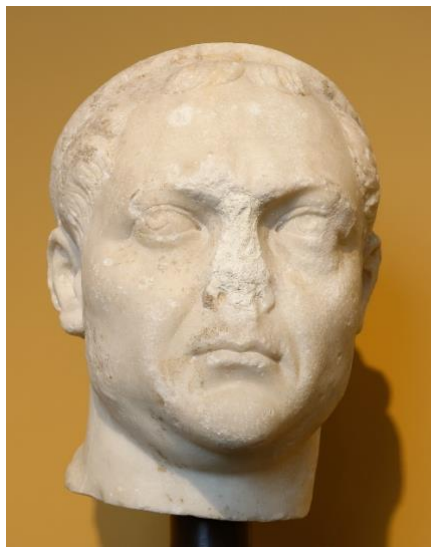
Slika 3. Car Valerijan

Valerijan stupa na prijestolje 253. godine nakon smrti Emilijana. Bolest i nemiri su iznutra uništavali državu, germanski upadi i pljačke su bili konstanti kao i prijetnja s istoka od strane Perzije. Valerijan imenuje sina Galijena svojim suvladarom i povjerava mu obranu sjevera dok on drži obranu istoka od navale perzijskog kralja Šapura. 3 Perzijanci zauzimaju veliki dio istoka te grad Antiohiju koja je služila kao centar upravljanja za taj dio carstva. Temeljitom pljačkom i porobljavanjem stanovništva kontinuirano slabe rimski položaj. Loše vijesti pristižu sa svih strana o mnogobrojnim barbarskim upadima koje Galijen nastoji ali ne može zaustaviti u cijelosti. 4 Valerijan vraća Antiohiju pod rimsku vlast i kreće na perzijsku vojsku koja se nalazi kod Edesse. Na putu je njegovu vojsku poharala kuga i bio je primoran na pregovaranje sa Šaputom koji inzistira na osobnom sastanku dvaju vladara. Valerijan prilazi mjestu dogovora sa malom stražom i biva zarobljen na prevaru od strane Perzijanaca. U zarobljeništvu car je izložen konstantom poniženju koja ne prestaju ni njegovom smrću gdje je njegova oguljena koža bila izložena na vidik svim budućim rimskim diplomatima perzijskom dvoru kao znak jedne od najvećih pobjeda Perzije nad jednim rimskim vladarom. 5