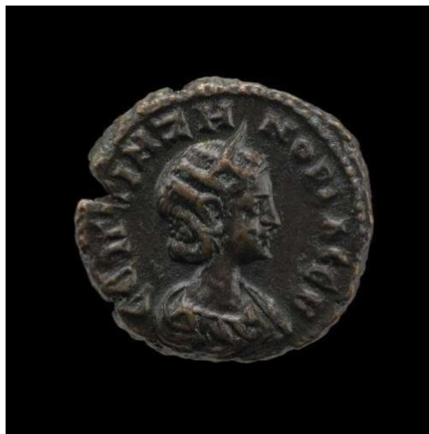
Slika 9. Zenobia na tetradrahmi, 271-272. godina