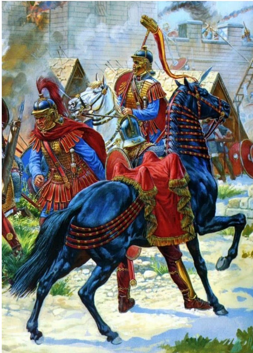
Slika 19. Rimski konjici trećeg stoljeća