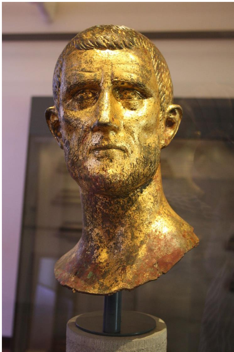
Slika 10. Car Aurelijana, 268-269. godina