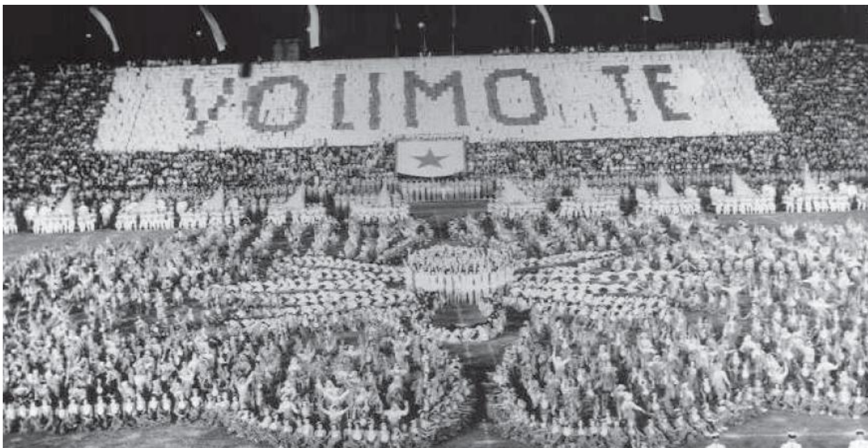
Slika 10. Proslava Dana mladosti 1972. godine

U Hrvatskoj je 1953. godine uspostavljena Pionirska štafeta koja se održavala kao najmasovnija manifestacija hrvatskih pionira sve do 1982. godine kad je zamjenjuje Spomenica rada i drugarstva. U ostalim republikama pionirske su štafete bile direktno povezane s Danom mladosti i Štafetom mladosti, dok su u Hrvatskoj, s ciljem oporavka pionirskih organizacija 50-ih godina, pioniri sudjelovali i u Pionirskoj štafeti. 155 Rezultati Pionirske štafete vidljivi su na svečanostima i manifestacijama koje su se odvijale između ožujka i svibnja, a štafetne palice s pionirskim nositeljima povezivale su svaku pionirsku organizaciju te su nošene hrvatskim općinama s konačnim ciljem koji se nalazio u gradu Zagrebu. Pionirska štafeta tad je kulminirala u masovnom završnom zboru koji se u početku održavao na Trgu Republike, danas Trg bana Jelačića, a kasnije u Pionirskom gradu – današnjem Gradu mladih. Zadnja dionica puta vodila je štafetu u Beograd gdje je izaslanstvo sačinjeno od nekoliko desetaka pionira iz svih dijelova Hrvatske uručilo štafetne palice Josipu Brozu Titu. Pionirska štafeta pak ne predstavlja štafetu u doslovnom smislu riječi „nego je nazivnik za raznovrsne aktivnosti pionira, koje se povezuju prenošenjem štafetnih simbola. To je zbir spretno povezanih sportskih, kulturno-umjetničkih, svečanih i radnih elemenata.“ 156