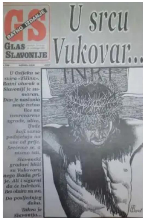
Slika 1. Isus (Hrvatska) na križu (Glas Slavonije 20. studenoga 1991.)

prikovane na križ, čime se država koja je prolazila kroz patnju uz veliku žrtvu još jednom poistovjetila s Isusom.