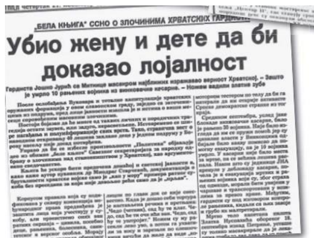
Slika 5. Naslovnica Politike "Ubio ženu i dete da bi dokazao lojalnost" (21. studeni 1991.)

Nakon „oslobođenja“ Vukovara Politika donosi brojne tekstove o zločinima koje su provodile hrvatske ( ustaške ) snage, i nastoji pokazati koliko daleko su hrvatski vojnici bili spremni ići. Na taj je način 21. studenoga 1991. godine objavljen članak pod naslovom Ubio ženu i dete da bi dokazao lojalnost. (slika 7) 107 U člancima takvoga tipa iznosi se svjedočenje kako su hrvatski vojnici, kako bi dokazali da su vjerni Hrvatskoj, bez premca ubili svoju vlastitu obitelj, svoje žene i djecu. Na temelju toga u ovom članku podnaslova Gardista Joško Jurić sa Mitnice masarkom najbližih dokazao lojalnost , dalje piše: Gardista Joško Jurić da bi dokazao vernost Hrvatskoj, zaklao je svoju suprugu, inače Srpkinju, nožem joj rasporio stomak i iz utrobe izvukao sedmomesečni plod deteta. Jurić je oboje ekserom zakovao na stablo kruške u naselju Mitnica. 108