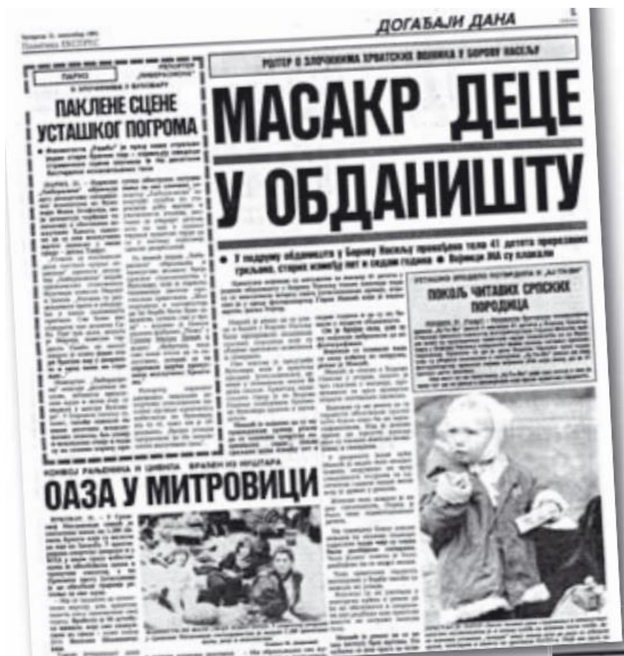
Slika 11. naslovnica "Masakr dece u obdaništu"