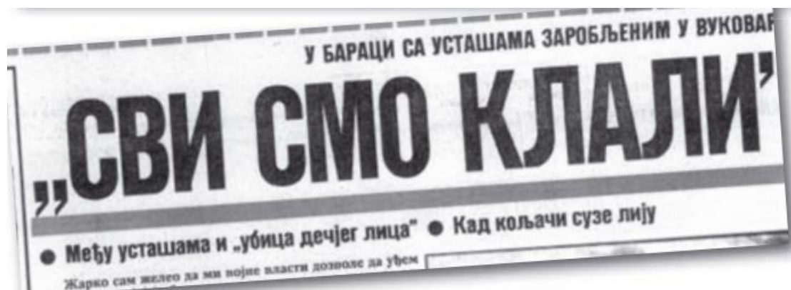
Slika 10. (u baraci sa ustašama zarobljenim u Vukovaru) "Svi smo klali", Politika Ekspres 24. studenoga 1991.

uhapšeni su, a među njima je i Davor Markobašić, zlikovac koji je pravio ogrlicu od dečijih prstića. Ogorčeni građani traže da im sudi narod i zato nisu dozvolili da zlikovci budu pod vojnom kontrolom. (...) 134