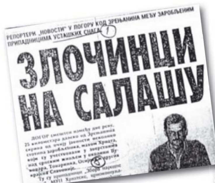
Slika 9. Reporter "novosti" u logoru kod Zrenjanina među zarobljenim pripadnicima ustaških snaga - "Zločinci na salašu", Večernje novosti 13. studenoga 1991.

U ovim se novinama također objavljuju informacije o srpskim logorima u kojima su bili zarobljeni hrvatski vojnici, mahom pripadnici Zbora narodne Garde, ali u logorima su bili zarobljeni i obični seljaci, kao i žene. U članku autorice Tamare Bakić naslovljenom Zločinci na salašu , koji je objavljen dva dana zaredom, 13. i 14. studenoga stoji: Logor smešten između dve reke 25 kilometara daleko od Zrenjanina skriva od očiju javnosti nekoliko stotina zarobljenika, mahom Hrvata, koji su učestvovali u zverstvima nad srpskim življem u okolini Vukovara, Tovarnika, Osijeka i drugih krajeva Slavonije. To su pripadnici „Zbora narodne garde“, MUP Hrvatske, crnokošuljaši, ustaše, ali i seljaci, domaćice, mladići sa nepunih šesnaest godina. Uglavnom su zadojeni mržnjom prema svemu što je srpsko. Tu u logoru očekuju kaznu. Većina je svesna da su samo bili pioni u krvavom piru hrvatskog vrha. (slika 9) 128