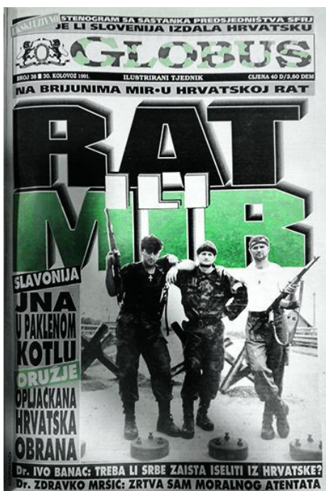
Slika 1.. Novi izgled naslovnice Globusa (30. kolovoz 1991.)

U odnosu na većinu drugih novina koje su se u ratno vrijeme bavile unutarnjom i vanjskom politikom Republike Hrvatske te odnosima s međunarodnom zajednicom, težište Globusa je usmjereno na ulogu hrvatskih branitelja i situacija na ratištu. Sa sjedištem u Zagrebu, novine u javnost počinju izlaziti krajem 1990. godine pod uredništvom Denisa Kuljiša. Već nakon rata na teritoriju Slovenije novine postaju ratni magazin. Njegova su najznačajnija obilježja bombastični naslovi i slike te mega format. 53 Na naslovnicama novina najčešće su se nalazili hrvatski vojnici-ratnici, a tekst oko fotografija obojan je maskirnim bojama (Slika 1). Jedna od prvih naslovnica takvoga izgleda bila je u broju objavljenom 19. srpnja 1991. godine, a prikazuje hrvatskog branitelja u vojnoj odori (prikazan je kao nekakav glumac ratnoga filma američke produkcije). Ubrzo je ta fotografija obišla svijet. (Slika 2.)