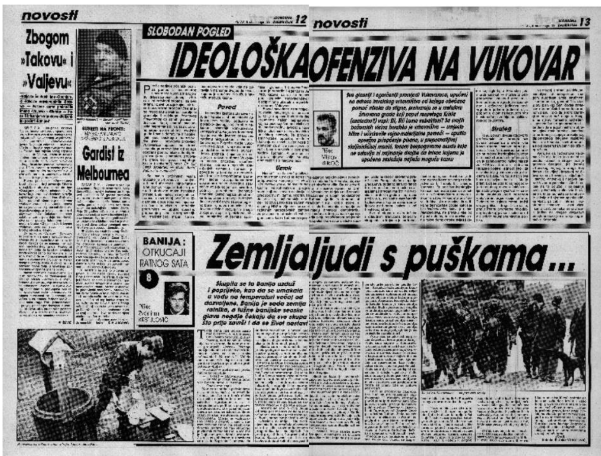
Slika 3. Ideološka ofenziva na Vukovar (Slobodna Dalmacija 8. studenoga 1991.)

I u ovim se novinama sudbina Vukovara izjednačava sa sudbinom Isusa Krista, posebice u danima kada je grad čekao obećanu pomoć, koja nažalost nije pristizala. U isto to vrijeme agresorski napadi bivaju sve intenzivniji i upućeni su sa svih strana grada. To je prikazano u članku čiji je autor Mislav Kukoč, objavljenom 8. studenoga 1991. godine pod naslovom Ideološka ofenziva na Vukovar (slika 4. i 5.), a podebljani sažetak ispod naslova glasi: Sve glasnjiji i ogorčeniji prosvjedi Vukovaraca, upućeni na adresu hrvatskog vrhovništva od kojega obećana pomoć nikako da stigne, pretvaraju se u metaforu žrtvovana grada koji poput raspetoga Krista (uzaludno?) vapi: Eli, Eli! Lama sabaktani? Sa svojih božanskih visina hrvatsko je vrhovništvo – umjesto hitne i učinkovite vojno-materijalne pomoći – uputilo opsežno priopćenje pisano, u prepoznatljivoj staljinističkoj maniri, tonom bespogovorne osude koja ne ostavlja ni najmanje dvojbe da krivac kojemu je upućena zaslužuje najveću kaznu. 73