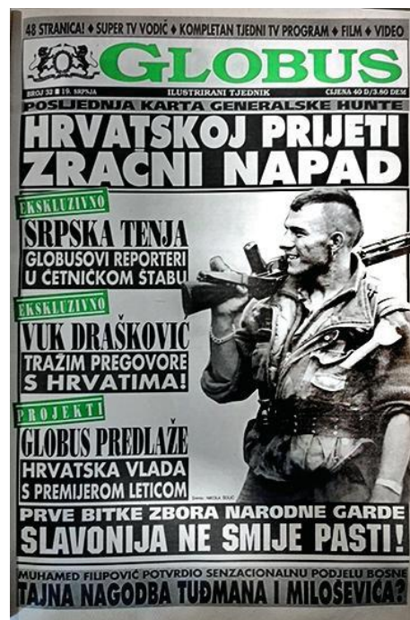
Slika 2.. Naslovnica Globusa (9. srpanj 1991.)

Sam urednik je naglasio kako je njegov cilj kroz članke oblikovati hrvatskog ratnika, što je imalo izrazit uspjeh kod čitatelja. Ono što je zanimljivo, identitet hrvatskog ratnika nastaje po uzoru na američke ratnike, što ističe i Darko Hudelist – Globus predstavlja nastavak opsesije