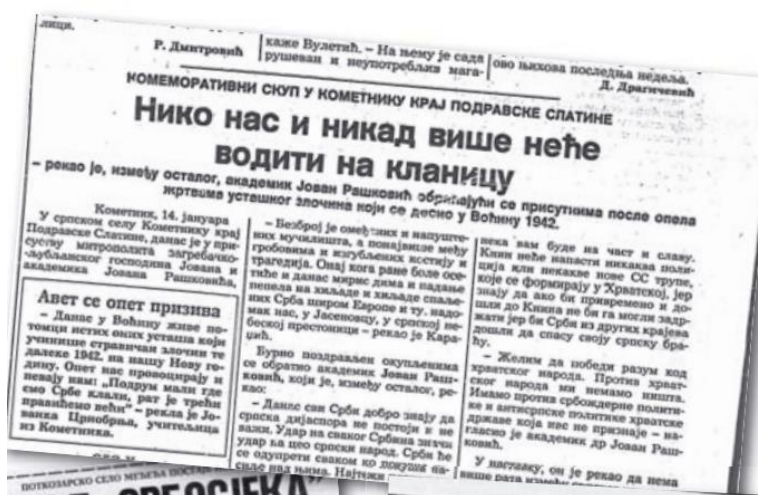
Slika 4. Naslov članka Politike 15. siječanj 1991. "Niko nas i nikad više neće voditi na klanicu"

Na samom početku godine, 15. siječnja u ovim je novinama objavljen tekst čiji naslov glasi: Niko nas i nikad više neće voditi na klanicu u kojem se govori o žrtvama ustaškog zločina u Voćinu. (slika 6) 104 Autor Jovan Rašković u tom članku kaže da udar na svakog Srbina znači udar na ceo srpski narod , a također se prenose riječi jedne učiteljice s toga prostora, koja tvrdi da djeca Hrvata ( ustaša ) u Voćinu toga dana pjevaju: Podrum mali gde smo Srbe klali, rat je treći pravićemo veći. 105