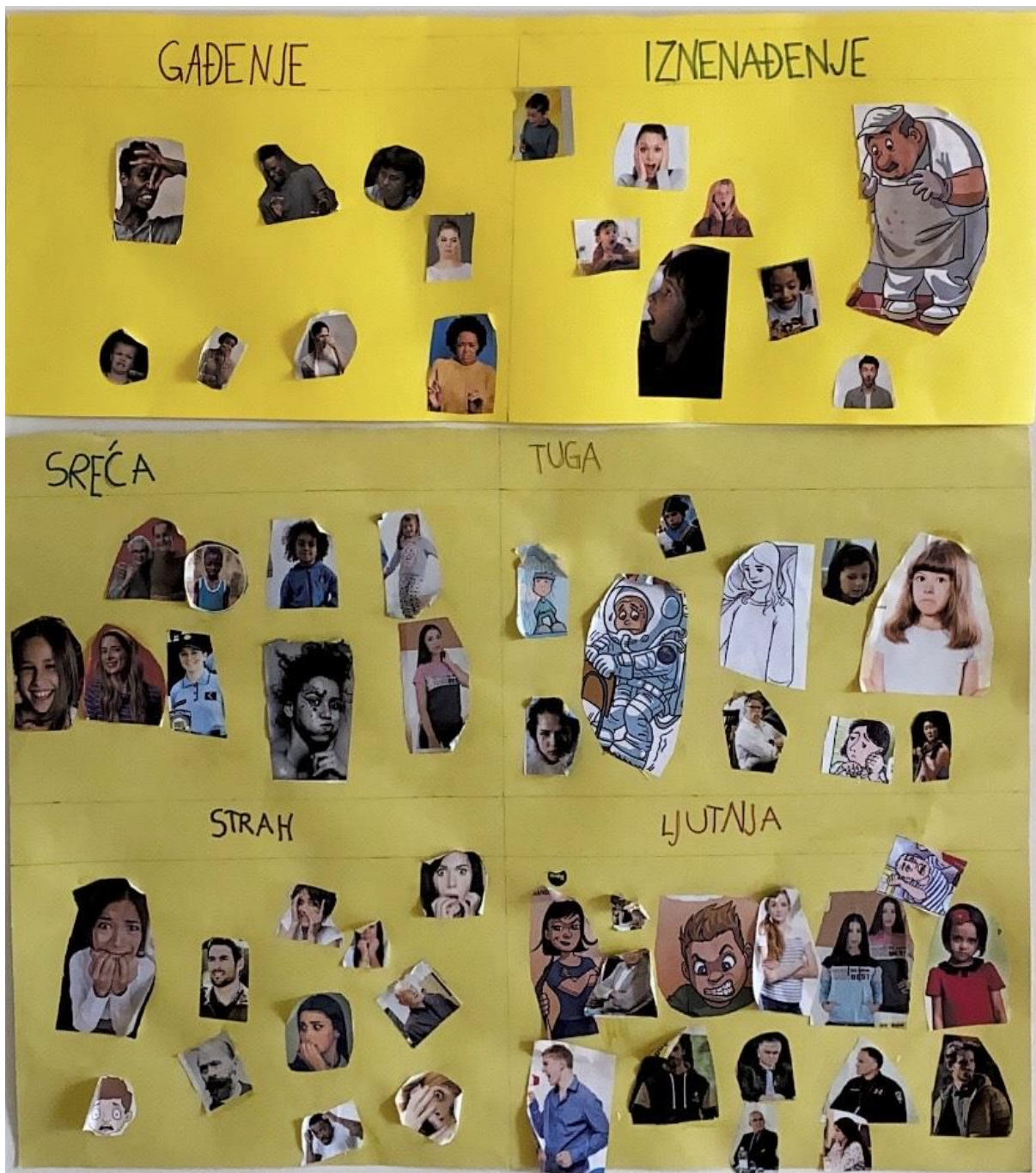
Slika 2 – plakat „emocije“