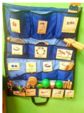
Slika 1. Džepići s udaraljkama