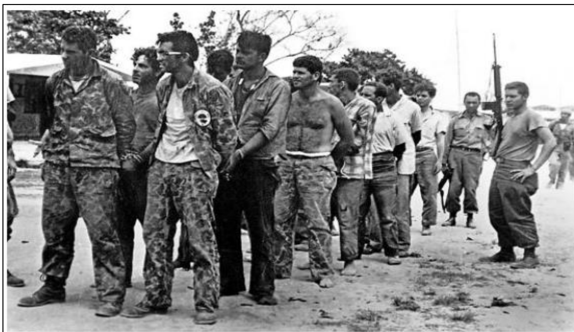
Slika 1. Zarobljeni kubanski pobunjenici nakon invazije u Zaljevu svinja

Tako je sredinom travnja 1961. godine 1400 pobunjenika napalo Kubu, ali je invazija bila potpuna katastrofa i u trenutku dolaska do Kube američki brodovi i zrakoplovi nisu mogli značajno nauditi Castru i njegovoj gerili. Borba se vodila upravo u Zaljevu svinja na južnoj obali Kube oko 150 kilometara od glavnog grada. 60 Iako su pretrpljeni strašni gubitci, Kennedy je oklijevao s izdavanjem zapovijedi za povlačenje. Kada je izdao zapovijed, pokušaj izvlačenja pobunjenika s Kube također je neslavno završio – 140 pobunjenika je poginulo, a čak njih 1189 ih je bilo zarobljeno. 61 Zarobljeni CIA-ini plaćenici prikazani su na slici 1.