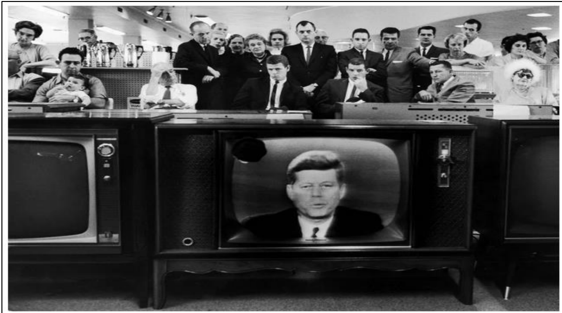
Slika 3. Televizijska najava američkog predsjednika Johna F. Kennedyja o pomorskoj blokadi Kube 22. listopada 1962.