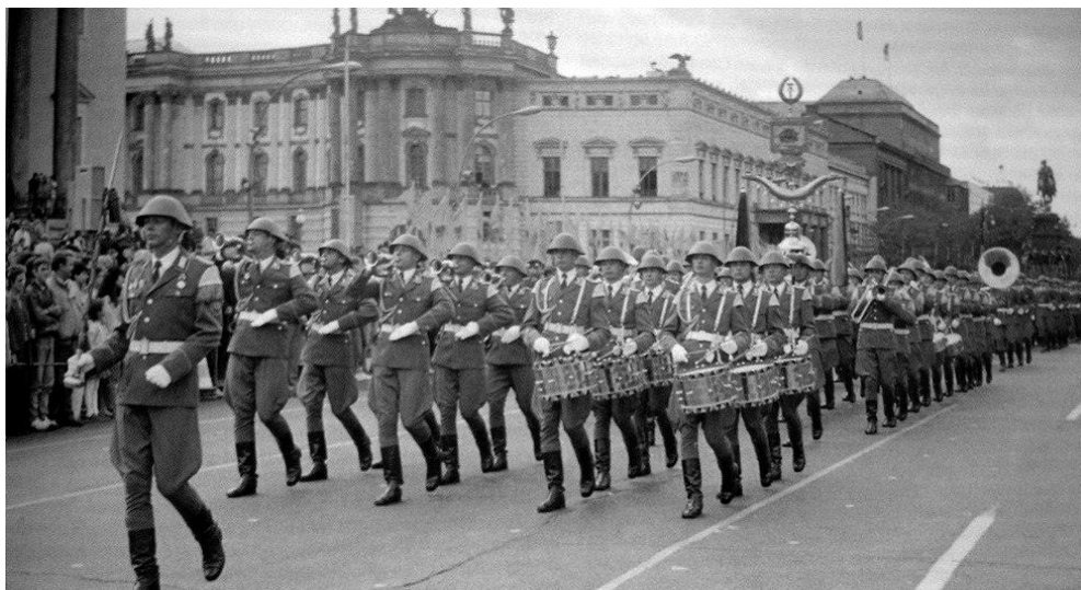
Slika 2. Tabour major

https://web.facebook.com/deutsche.militaermusik/photos/a.1103419849689602/1219566451408274/?type=3&paipv=0&eav=AfYIaxQSfw5_KR2PCNU55Cuz8nQasEJD_oy3ZKMHXsuM0QdatLqQcKFSor_-JOfK98&rdc=1&rdr