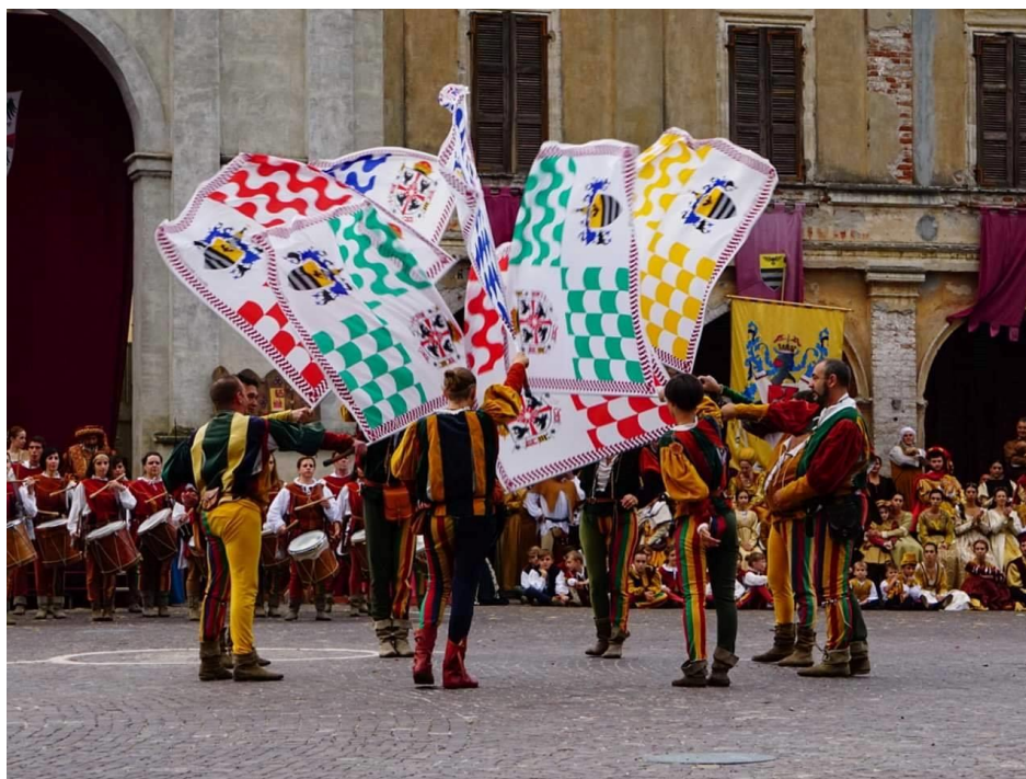
Slika 1. Švicarski bacači zastava

Šćurić (2017), navodi teoriju da su mažoretkinje nastale od raznolikih švicarskih bacača zastava. To su bile stjegonoše koji su pored standardnog držanja zastava izvodili jednostavne figure s kopljima zastava, poput vrtnje, mahanja, okretanja, bacanja i slično. Kasnije se razvio poseban izraz "sbandieratori". Oni su danas jedna od najvažnijih atrakcija karnevala i drugih festivala u Zapadnoj Europi. Jedna od karakteristika izraza je izvođenje vratolomija s jednom ili više imitacija srednjovjekovnih zastava, često u opremi onoj koju su nosili paževi tog vremena. Na glazbu orkestra i perkusija (udaraljki) izvođači bacaju vlastite zastave više od deset metara u zrak, te ih rotiraju oko ruku i drugih dijelova tijela. Ovaj način izvođenja podržava teoriju da su mažoretkinje nastale od švicarskih bacača zastava (Šćurić, 2017).