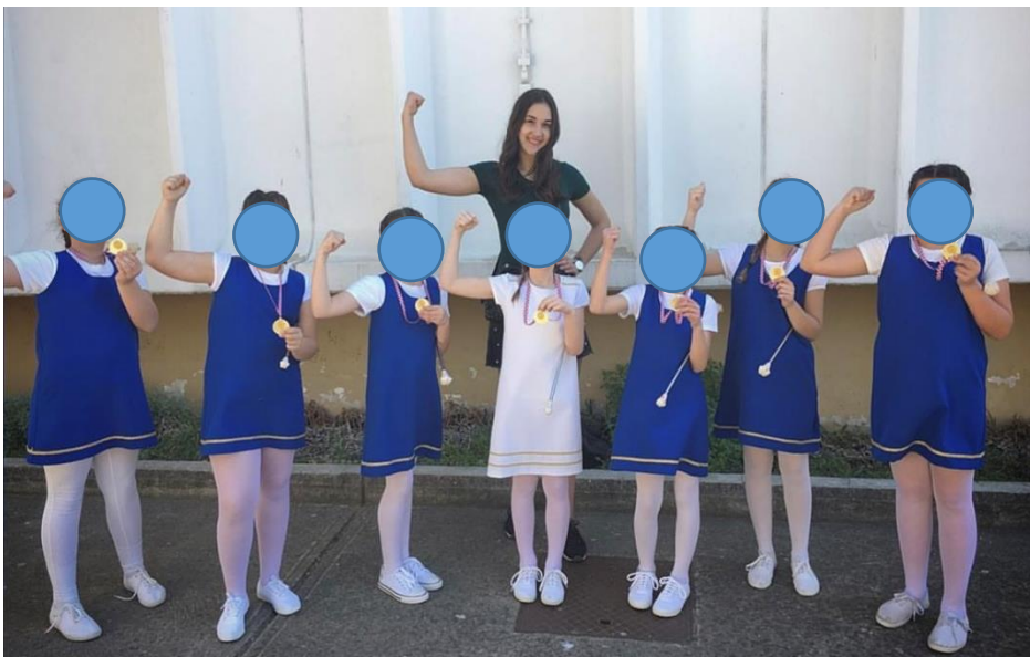
Slika 6. Natjecanje u prvom i višem koraku

Isto tako, HMS priređuje i natjecanje „Prvi korak“ za djevojčice dobnih skupina od 3 do 9 godina i natjecanje „Viši korak“ za mažoretkinje od 10 do 25 godina. Ovakav koncept natjecanja je koncipiran kako bi pružio priliku mažoretkinjama početnicama koje još nisu spremne za natjecanja na državnoj razini. Na ovom natjecanju, djevojčice plešu pred jednim sudcem prema unaprijed zadanom programu, a zatim dobivaju zlatnu, srebrnu ili brončanu medalju ovisno o broju bodova koje ostvare, sve djevojčice dobivaju medalju (članak 42. natjecateljskog pravilnika HMS, 2017). Nadalje, neki savezi također imaju članice u veteranskom sastavu (mažoretkinje iznad 26 godina) te sastav između škola za djecu s blagim i srednjim mentalnim poremećajem (Šćuric, 2017). Treba napomenuti da HMS na državnom prvenstvu nudi mogućnost natjecanja mažoretkinja u kategorijama „solo“ i „duo“. U kategoriji „solo“ jedna mažoretkinja iz tima izvodi individualni ples i natječe se protiv jedne mažoretkinje iz drugih timova. Obično je to mažoretkinja koja je među najboljima u svom timu. Kategorija „duo“ podrazumijeva natjecanje dviju mažoretkinja u paru iz svakog tima. Sudjelovanje u ove dvije kategorije nije obvezno.