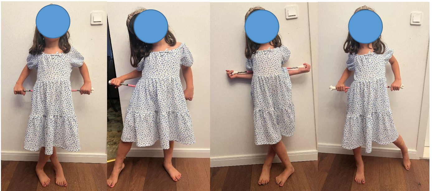
Slika 12. „Križanje“