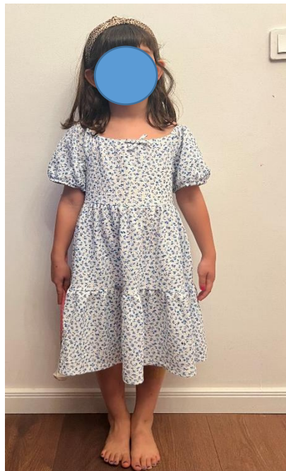
Slika 10. „Uspravan stav i držanje“

U radu s djecom, primjenom mažoret plesa, cilj je razviti njihov kinestetički osjećaj i srodne sposobnosti. Osnovna svrha je omogućiti im pretvaranje spontanijih motoričkih reakcija u svjesno odabrane, disciplinirane i svrhovite akcije. Kroz razvijeni osjećaj za pokret, djeca će moći inteligentno doživjeti, prepoznati, analizirati, ponavljati i uspoređivati svoje motoričke aktivnosti s onima drugih (Maletić, 1983). Kinestetički osjeti pružaju informacije o položaju i pokretima udova i glave u odnosu na tijelo. U mažoret plesu, najizraženiji su pokreti ruku i nogu, bez obzira na to je li tijelo u simetričnom ili asimetričnom stavu. Pokreti su stabilniji kada se stoji u simetričnom stavu, dok su pokreti u asimetričnom stavu manje stabilni. Za izvođenje određenog zadatka ili pokreta u asimetričnom stavu, ključni su osjećaj za ravnotežu i kontrola, odnosno koordinacija ruku i nogu pri tom pokretu. Prilikom izvođenja određenog zadanog pokreta bitna je i dinamika pokreta, koja određuje jesu li pokreti napeti ili opušteni, snažni ili slabi, teški ili lagani, te naglašeni ili nenaglašeni (Božić, Ilić i Mercandel, 2012).