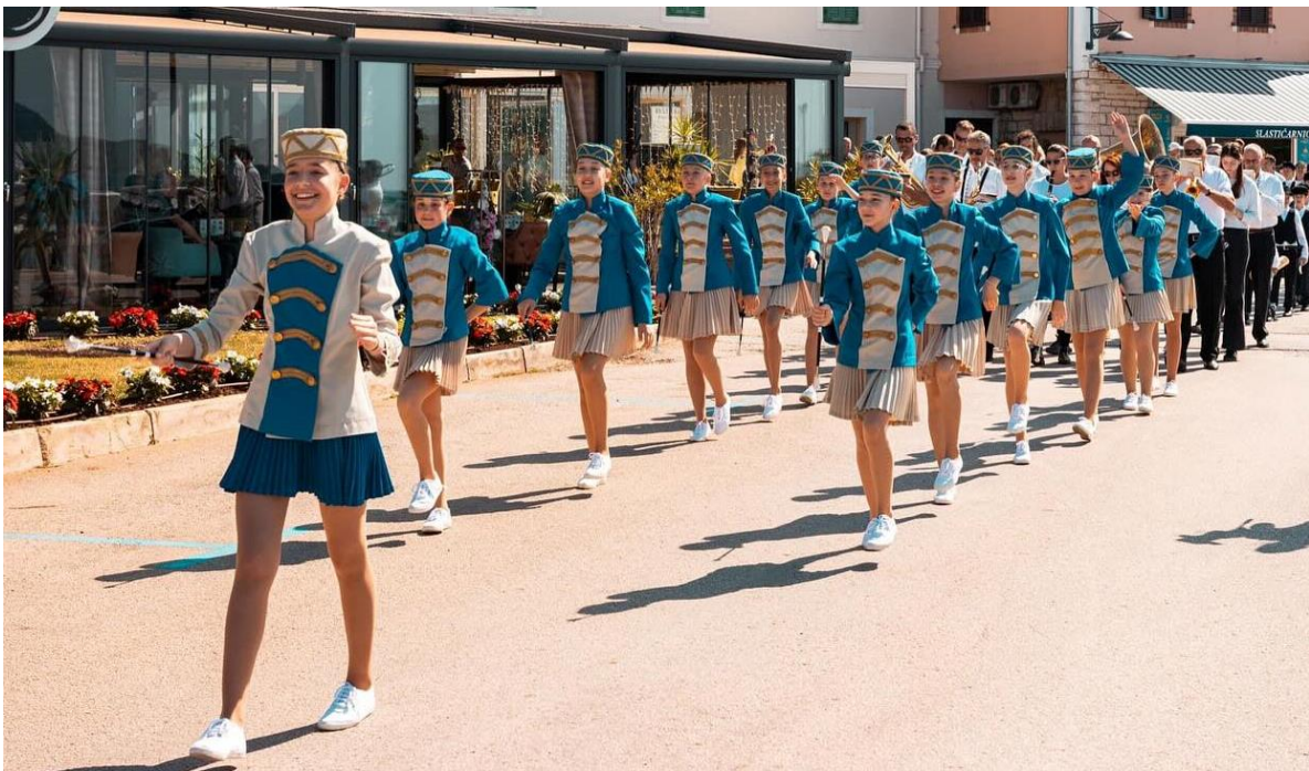
Slika 8. Biogradske mažoretkinje

Opći dojam čine svi oni elementi koji se ne ocjenjuju posebno sami za sebe, ali važni su za konačan uspjeh tj. neuspjeh mažoret sastava. Također, opći dojam nosi maksimalno 10 bodova i njegov utjecaj na sudce puno je veći od 10 bodova jer tehnički dobro izvedena koreografija nikada neće biti najbolja bez da sastav ima dobar opći dojam. Elementi općeg dojma su: uniformiranost, izgled mažoretkinja, stupanje (stupovni korak), ulazak/izlazak (iz) koreografiranog programa, početak/kraj paradnog defilea i puhaći orkestar (Vrvišćar, 2011).