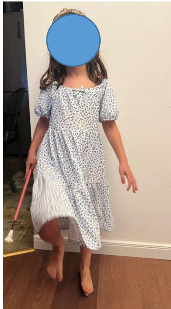
Slika 11. „Stupanje“