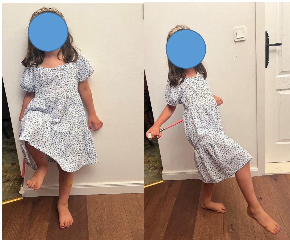
Slika 13. „Kick“