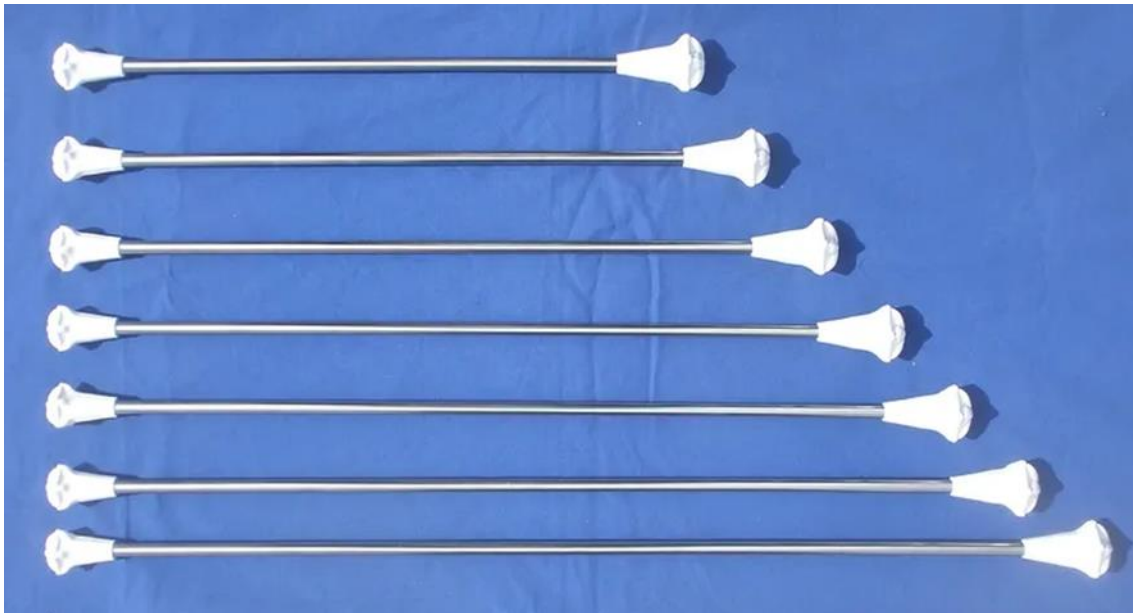
Slika 7. Različite duljine štapove ( https://zagrebmajorettes.wixsite.com/zama/mazoret-oprema )

Tijekom izvedbe svaka mažoretkinja posjeduje svoj štap i nije dopušteno dodavanje štapova izvana. Međutim, mažoretkinje mogu međusobno zamjenjivati štapove pa je stoga dopušteno da neke mažoretkinje rade s dva ili više štapova, dok druge ne koriste štap uopće (Vrvišćar, 2011).