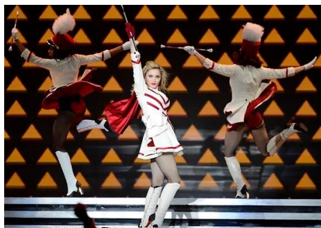
Slika 3. Madonna kao mažoretkinja

Formacije mažoretkinja koje su se početkom 20. stoljeća pojavile u Francuskoj i Nizozemskoj više nisu bile isključivo povezane s vojnim paradama. Umjesto toga, mažoretkinje su postale zabavna atrakcija koja je uveseljavala stanovništvo svojim plesom uz pratnju puhaćih orkestara. Tridesetih godina 20. stoljeća u Americi su nastale drum-majorette, djevojke koje su ispred orkestra tehnicirale sa štapom. U to vrijeme, mažoretkinje su često bile jedine ženske osobe u paradi, a njihov broj se obično kretao od jedne do tri. Važno je napomenuti da je samo mažoretkinjama bilo dozvoljeno da nose mini-suknje jer se nošenje istih smatralo nemoralnim ili čak protuzakonomitim u mnogim dijelovima Amerike. Ovaj aspekt je naglašavao poseban status i ulogu mažoretkinja u paradama i javnim priredbama tog vremena. 1927. godine Ed Clark je oformio prvu manufakturu za proizvodnju mažoret štapova. Također, navodi se kako je 1941. godine časopis "Life Magazine" imao mažoretkinje na naslovnici te ih je istovremeno predstavljao i opisivao na nekoliko stranica unutar samog časopisa. Jedan od značajnijih trenutaka u povijesti mažoretkinja bilo je pojavljivanje Judy Garland u filmu "Ziegfeld Girl" kao mažoretkinje. No, najveća promidžba koja je podignula golemu popularnost mažoretkinjama dogodila se kada je Madonna, tijekom turneje MDNA, plesala kao mažoretkinja uz pratnju skupine mažoretkinja (Šćuric, 2017).