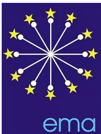
Slika 4. Europska Mažoret Asocijacija (EMA)