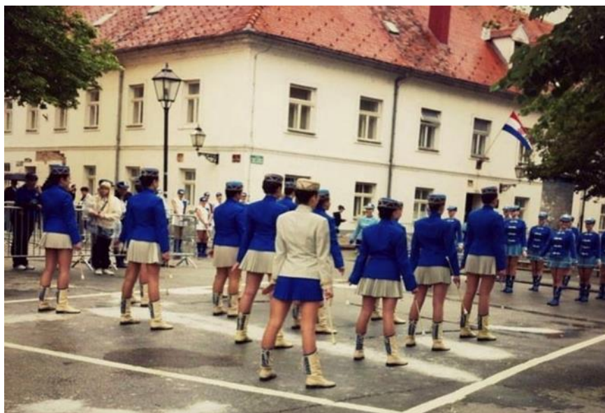
Slika 9. Početna formacija paradnog defilea