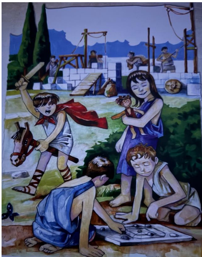
Slika 2: Ilustracija iz slikovnice "Priča o Gaju Liberiju" autora Ibrahima Agačevića