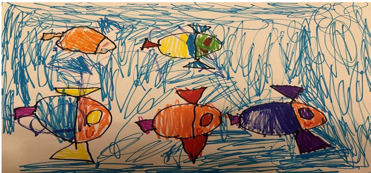
Slika 4, T.K (5.5 godina)

Dijete u likovnom radu koristi tehniku flomastere. Crtež prikazuje ribe u moru. Konture riba su definirane crnim zatvorenim linijama, što ih vizualno izdvaja iz pozadine. Pozadina je ispunjena raznim linijama nanesenim brzim pokretima ruke, dok su ribe pretežno ispunjene vodoravnim i okomitim linijama. Dijete koristi gotovo čitav prostor papira, izbjegavajući praznine. Prostor je prikazan bez perspektive, tipično za dječje crteže. Ribe su raspoređene po površini papira, čime se stvara osjećaj kretanja i živosti. Dijete koristi kombinaciju primarnih (plava, žuta, crvena) i sekundarnih (narančasta, zelena, ljubičasta) boja kako bi stvorilo živopisni i dinamični prikaz. Svaka riba ima jedinstvene karakteristike, poput različitih boja tijela, peraja, očiju i repova. Uzimajući u obzir na dječak komentar na rad, zaključuje se da je crtež nastao pod snažnim utjecajem medija.