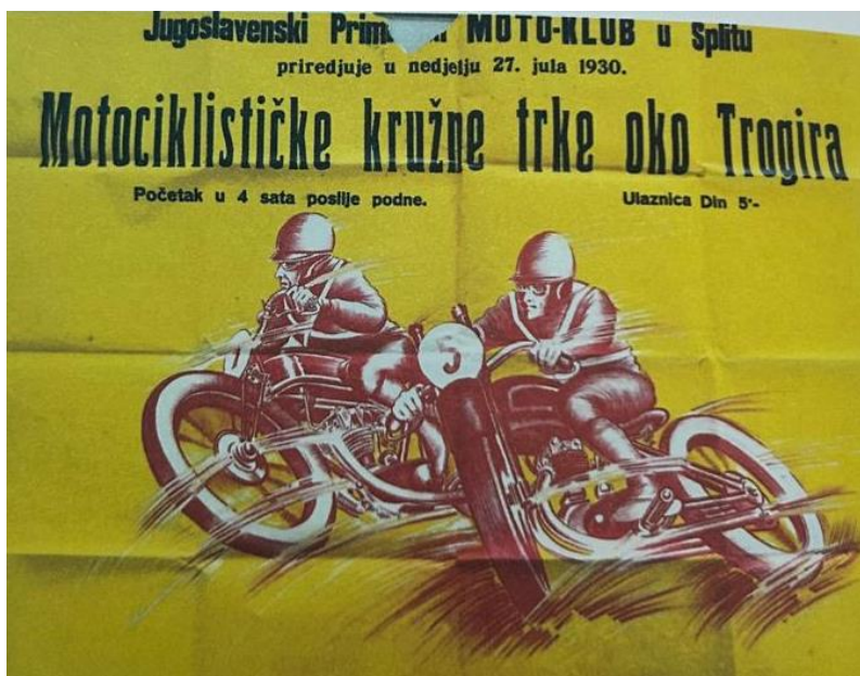
Slika 17. Plakat za promociju Motociklističke utrke 1930.

sportskih destinacija tog vremena. Ipak zabilježeno je u kolovozu iste godine i negodovanje povodom održavanja trka. No, kako se ulaže oglašavanje tako je to ipak jedna dobra reklama za Trogir, a sve zahvaljujući Moto klubovima. 233