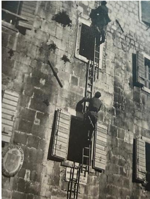
Slika 70. Penjačko odjeljenje na vježbama 25. travnja 1937. godine