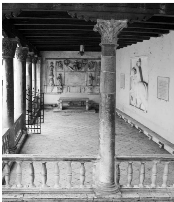
Slika 6. Unutrašnjost lože