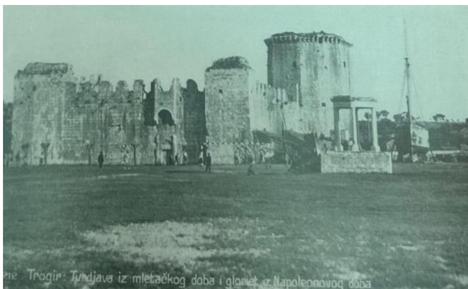
Slika 13. Igralište na Batariji 1912. godine

Nogometne aktivnosti u Trogiru nisu bile ograničene samo na jedno igralište. Osim terena kod kule Kamerlengo, utakmice su se igrale i na predjelu Soline. Međutim, igrači su se suočavali s izazovima u pogledu prikladnosti terena. Posebno je zanimljiv slučaj igrališta na Batariji, gdje su stabla ometala igru. Suočeni s nedostatkom razumijevanja od strane općinskih vlasti, igrači su uzeli stvar u svoje ruke. U tajnoj noćnoj akciji, posjekli su sva stabla na terenu, prisiljavajući tako vlasti da priznaju njihove potrebe i prilagode prostor za igranje. Razvoj kluba privremeno je prekinut izbijanjem Prvog svjetskog rata 1914. godine. Međutim, odmah po završetku rata 1918., klub je obnovljen i nastavio svoje aktivnosti tamo gdje su stale prije rata. 202