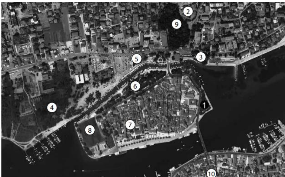
Slika 1. Satelitska snimka Trogira i neposredne okolice s naznačenim najvažnijim toponimima: 1. Žudika; 2. Dobrić; 3. Lokvice; 4. Soline; 5. Travarica; 6. Fortin; 7. Pasike; 8. Batarija; 9. Garanjinov vrta; 10. Čiovo

Pažljivim proučavanjem klimatskih obilježja obalnog područja Trogira uočena je prisutnost jadranskog tipa mediteranske klime s izrazito povoljnim mikroklimatskim uvjetima koji su znatno povoljniji u usporedbi s obližnjim Splitom i Šibenikom. Razlog tome leži u zaštićenosti trogirskog primorja od vjetrova. Sa sjeverne strane zaštitu pruža lanac brežuljaka, dok od južnih i istočnih vjetrova štiti čini otočki arhipelag. 8