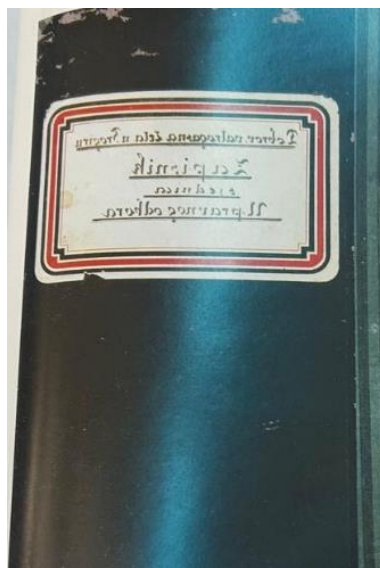
Slika 9. Zapisnik sjednica Upravnog odbora