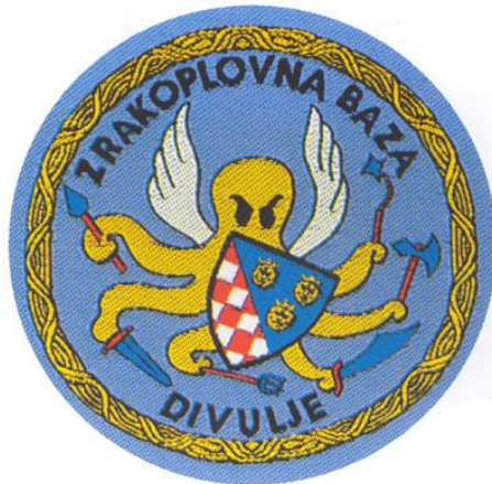
Slika 18. Grb sadašnje zrakoplovne baze Divulje