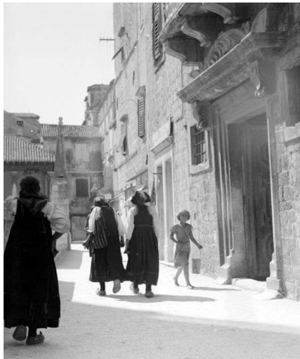
Slika 4. Svakodnevni život u Trogiru 1933./34. godine.

težaka da će agrarna reforma donijeti promjene u vlasništvu zemlje. Međutim, ta reforma dugo je zaobilazila dalmatinske krajeve. Državna politika često je bila neosjetljiva za lokalne probleme, dodatno otežavajući situaciju nametanjem različitih poreza i neadekvatnih rješenja. Stanovništvo koje se bavilo poljoprivredom i oslanjalo na prodaju vina, buhača i maslinovog ulja, suočavalo se sa sve težim uvjetima na tržištu. Industrijski sektor, ionako slabo razvijen u trogirskom kraju, dodatno je pogođen velikom gospodarskom krizom. Zatvaranje brojnih pogona rezultiralo je značajnim iseljavanjem stanovništva u prekomorske zemlje u potrazi za boljim životnim uvjetima.