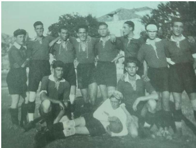
Slika 14. Nogometaši Slavena 1930. godine.

Iz priloga Jadranski sport koji je tada bio službeno glasilo skupštine Splitskog Nogometnog podsaveza saznajemo da klub Trogir iz Trogira više nije član istog. 204 Međutim, ubrzo se uz promjenu imena, vraća pod okrilje podsaveza i to 1930. godine kao Jugoslavenski radnički klub Slaven . Pod vodstvom predsjednika Vinka Buble-Konte, Slaven je sudjelovao u Pokalnom prvenstvu Splitskog nogometnog podsaveza. Unutarnji nesporazumi doveli su do formiranja novog kluba, NK Jarac , dok je Slaven popunjavao svoje redove igračima iz Vojnog garnizona u Divuljama. Klub je sudjelovao na raznim sportskim događanjima u regiji. 205