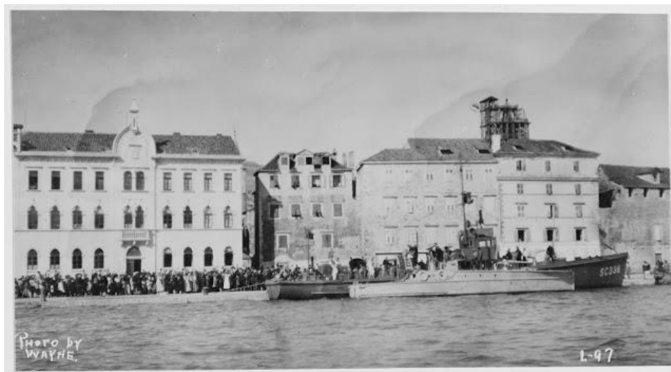
Slika 3. Talijani i Amerikanci s brodom USS OLYPIA vezani jedni za druge na rivi 23. rujna 1919. godine

Neposredno nakon rata, u jesen 1919., talijanske snage pokušale su okupirati trogirsko područje, no ovaj pokušaj naišao je na snažan otpor lokalnog stanovništva i intervenciju američkih i srpskih vojnih vlasti. Protutalijanski osjećaj rezultirao je demonstracijama i odlaskom dijela talijanski orijentiranih obitelji iz grada. 36 Otpor Talijanima vidljiv je kroz održane skupštine, memorandume, ali i fizičke sukobe. Tako se nova vlast odmah suočila s izrazito kompleksnim i nestabilnim okolnostima. Dalmatinski su se političari našli pred izazovom opskrbe stanovništva hranom, ali i problemom okupacije dijelova Dalmacije. Posebno je aktualno bilo tzv. Jadransko pitanje, koje je izazvalo značajnu zabrinutost dalmatinske javnosti. Kao odgovor na ovu situaciju, formirana je tajna organizacija s ciljem oslobađanja okupiranih teritorija, što je predstavljalo pokušaj proaktivnog djelovanja u rješavanju gorućih geopolitičkih problema regije. 37