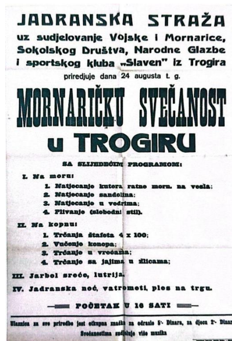
Slika 11. Plakat mornaričke svečanosti održane u Trogiru 1930.