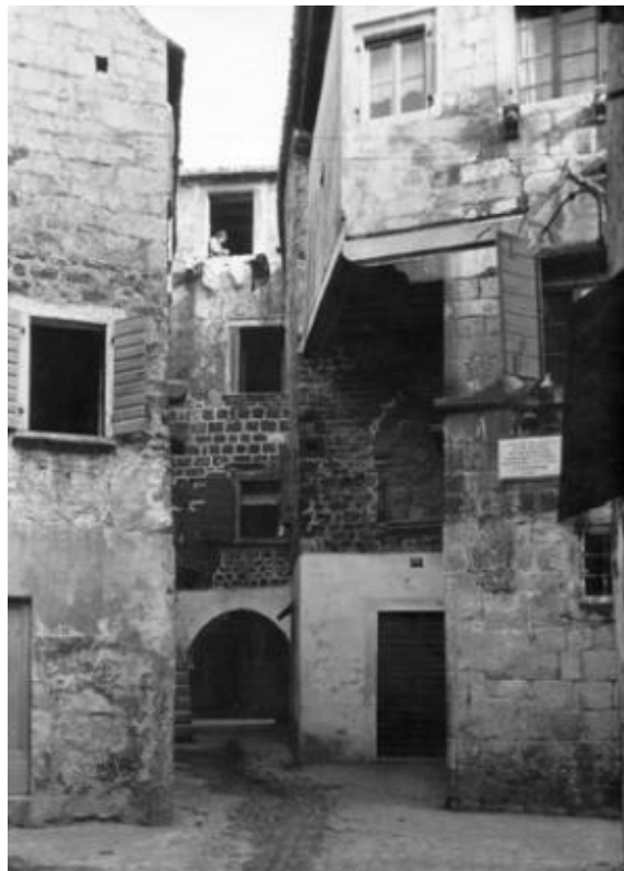
Slika 7. Kuća Berislavić