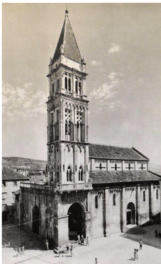
Slika 12. Katedrala sv. Lovre