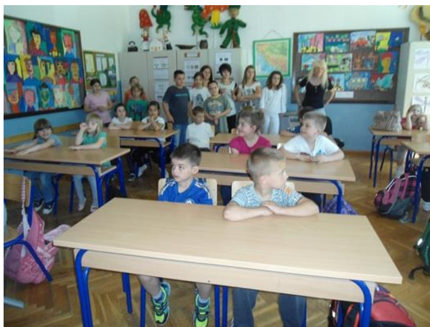
Slika 1. : Posjet predškolske djece u školi ( https://www.dv-zirek.hr/novosti_detaljno.asp?page=58 , pristupljeno 13. 8 . 2024.)