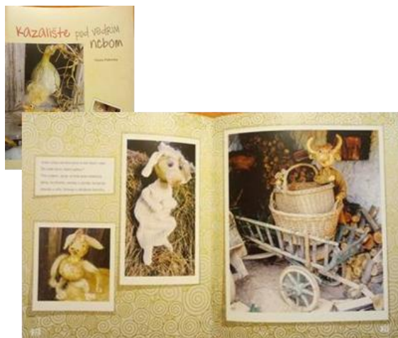
Slika 1: Naslovnica i dio slikovnice „Kazalište pod vedrim nebom“

Slikovnica je objavljena 2015. u sklopu biblioteke „Tikvići“ koja je kasnije objavila i ostale slikovnice iz autorskog niza Vlaste Pokrivke.