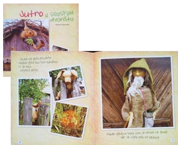
Slika 3: Naslovnica i dio teksta slikovnice „Jutro u seoskom dvorištu“