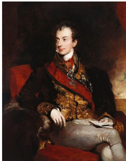
Slika 7. Klemens Wenzel Lothar Metternich