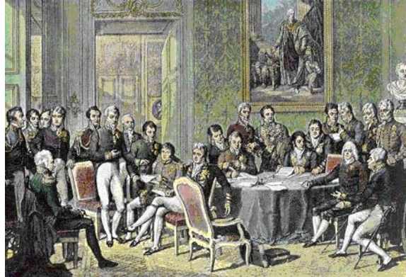
Slika 5. Održavanje Bečkog kongresa

Kotulla nam opisuje kako su se okupljeni knezovi i državnici gotovo svih europskih država (osim Turske) sastali tamo (uključujući i pripremnu konferenciju) u razdoblju od 18. rujna 1814. do 9. lipnja 1815. Pod vodstvom austrijskog kancelara princa Metternicha, pobjedničke sile Rusije, Pruske, Austrije i Velike Britanije u početku su se borile za novi mirovni poredak. Osim toga, ubrzo se pojavio pravi gubitnik rata, Francuska, tako da su odlučujući rezultati dogovoreni u užem "Odboru pet sila", koji je po potrebi proširen na Švedsku, Španjolsku i Portugal. Sva su pitanja odlučena s učinkom za i protiv trećih država, iako su rezultati uglavnom unaprijed dogovoreni s predstavnicima srednjih i malih država prisutnim u Beču. 21