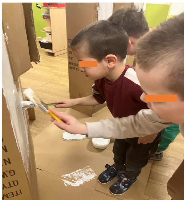
Slika 9. Bojenje dalmatinske kuće