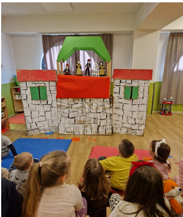
Slika 13. Animacija lutaka