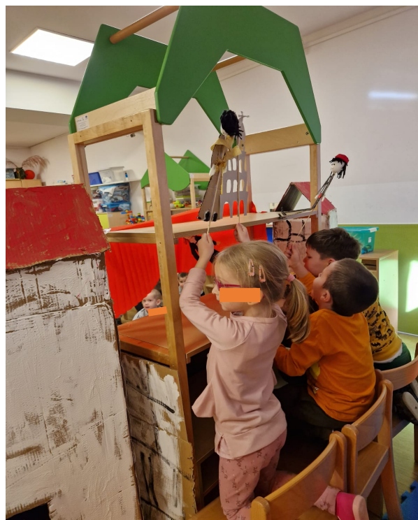
Slika 14. Animacija lutaka