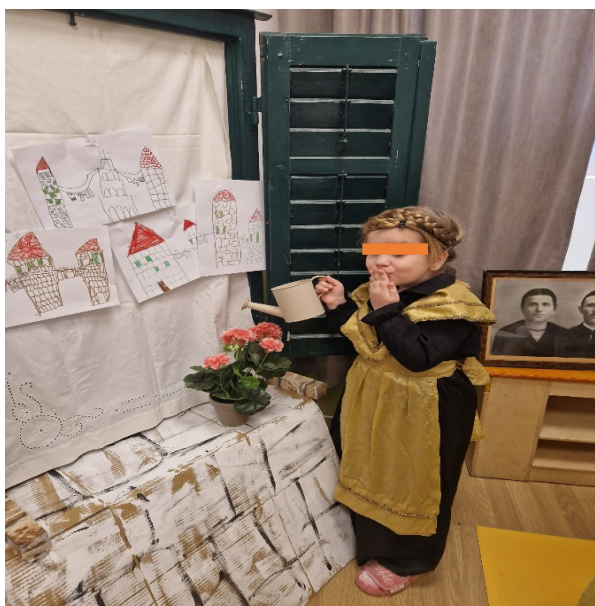
Slika 20. Zalijevanje cvijeća