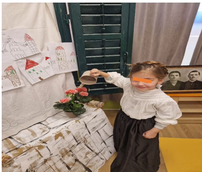
Slika 21. Zalijevanje cvijeća