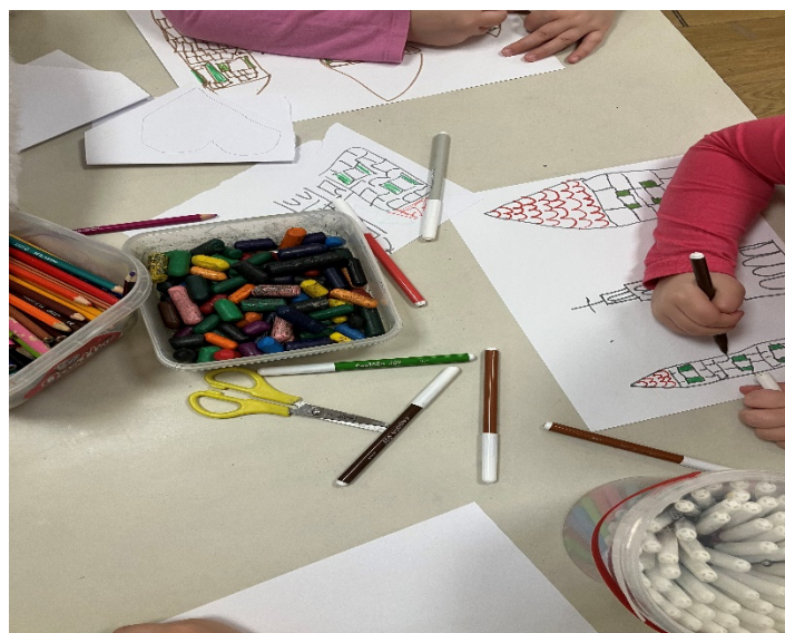
Slika 11. Crtanje grada Splita