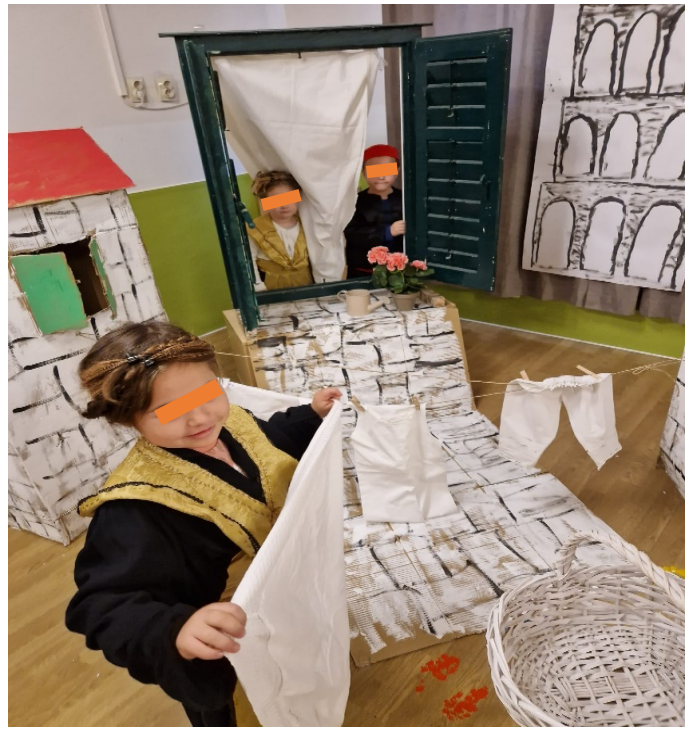
Slika 18. Prostiranje robe na tiramolu