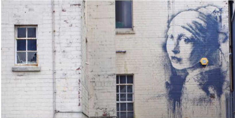
Slika 12: Djevojka s bisernom naušnicom

Ovo se djelo prvi put pojavilo nakon izgradnje zida Zapadne obale. Učinjeno je to u Betlehemu, na zidu koji dijeli Palestinu od Izraela, gdje je sam zid postao platno prepuno protesta protiv spomenute gradnje. Možemo vidjeti čovjeka pokrivenog lica, pripremljenog za tučnjavu, ali umjesto da baci artefakt spreman je baciti buket cvijeća. 5 Ovaj mural šalje snažnu antiratnu poruku i zbog toga predstavlja značajan primjer Banksy- evog umjetničkog djelovanja.