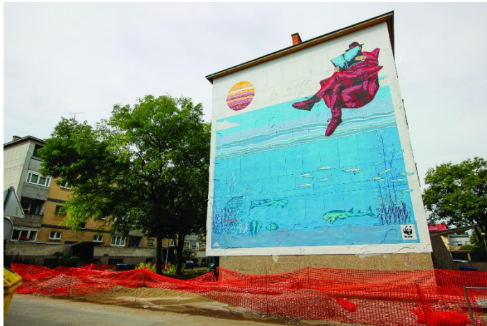
Slika 27: Daj ribi šansu