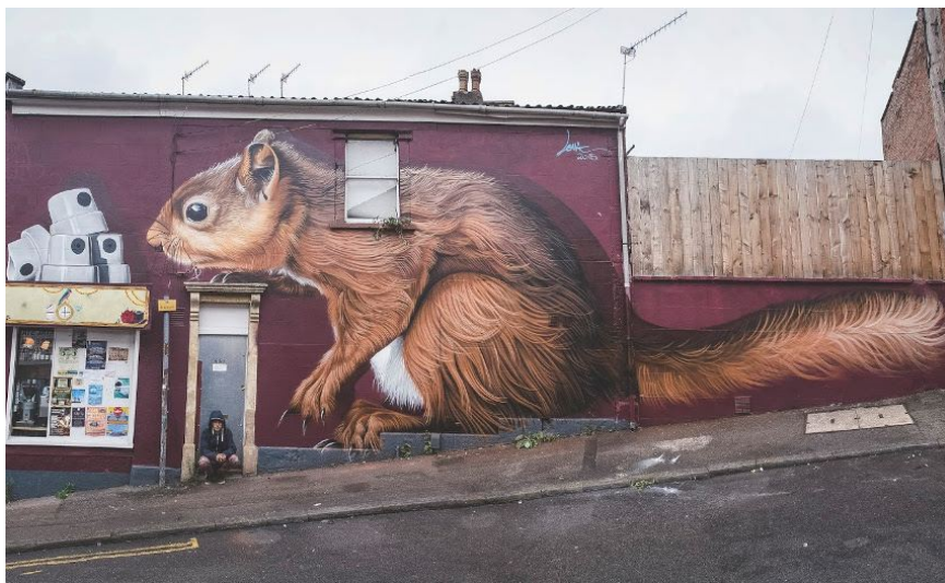
Slika 29: Djelo navedenog autora