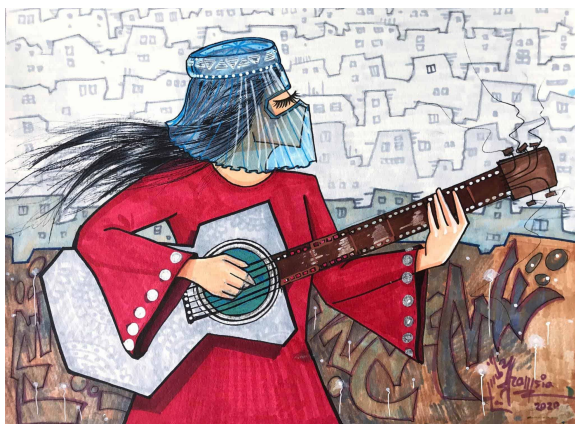
Slika 14: Silueta žene bez glasa

Njena djela uglavnom su usmjerena na delikatno iskazane siluete vitkih žena, elegantnih, zamišljenih figura sa spuštenim očima koje nemaju usne jer im nije dopušteno govoriti i izražavati svoja mišljenja. Te su figure omotane šarenim čadorima na kojima su otisnute slike njihovog grada u ruševinama. Drže cvijeće i pritisnute glazbene instrumente uz svoja prsa, dok podižu glave kako bi osjetile povjetarac. Djela Shamsie Hassani usmjerena su na preoblikovanje uma i svijesti žena u Afganistanu, društvu dominiranom muškarcima, a poseban i drugačiji izgled koji ona daje afganistanskim ženama odražava njihovu snagu, ambicije, ponos i volju da postignu svoje ciljeve. Kroz vlastite živote, protagonisti njezinih djela postaju nositelji pozitivne poruke promjena, koje donose nove nade za sve afganistanske žene (Mug Magazine, 2024).