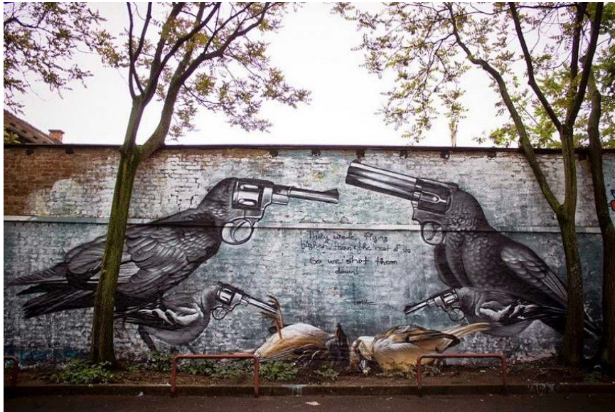
Slika 29: Djelo autora Lonca