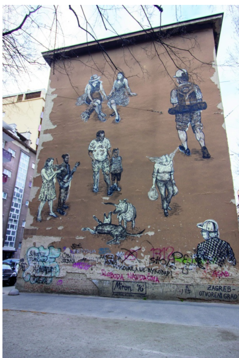
Slika 26: Slika svakodnevnice