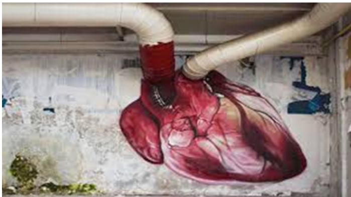
Slika 28: Srce koje kuca