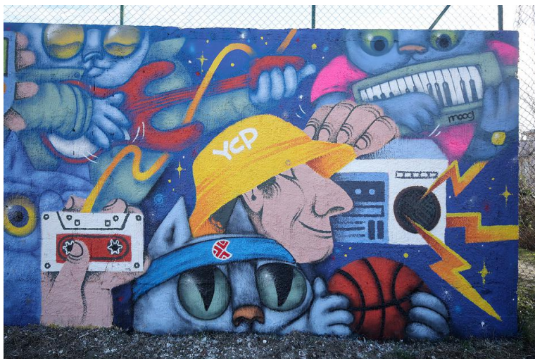
Slika 25: Tea Jurišić i Lunar, eminentni hrvatski umjetnici potpisuju novi mural na zagrebačkoj Kustošiji koji nas s nostalgijom vraća u osamdesete