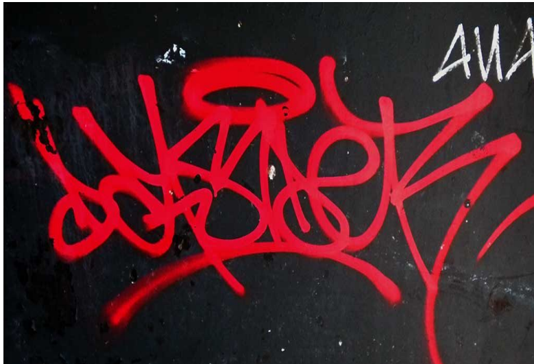
Slika 2: Crveni potpis, Pariz