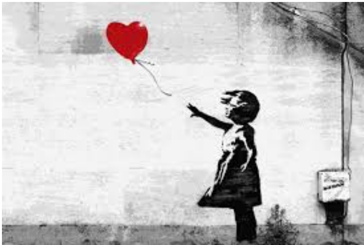
Slika 8: Djevojčica s balonom

„Djevojčica s balonom” jedno je od najpoznatijih Banksyjevih djela, koje prikazuje djevojčicu koja poseže za srcolikim crvenim balonom. Prvi put je ovaj mural oslikan na mostu Waterloo u Londonu. Međutim, najpoznatija verzija djela postala je ona uokvirena na platnu, koja je 2018. godine prodana na aukciji kuće Sotheby's za oko milijun funti. Neposredno nakon prodaje, pred šokiranim posjetiteljima i aukcionim vodičima, slika je počela izlaziti iz okvira, dok ju je rezač papira, ugrađen u okvir, počeo uništavati. Iako nije bilo jasno kako je uređaj aktiviran, Banksyjeva subverzivna gesta prema aukcijskoj industriji izazvala je snažne reakcije. Unatoč uništavanju, slika je ipak prodana, a njezina vrijednost je nakon toga porasla. U službenoj izjavi kuće Sotheby's, događaj je označen kao povijest u umjetničkom svijetu, a Banksyjeva slika postala je prvo umjetničko djelo koje je nastalo tijekom aukcije (MixMag, 2020).