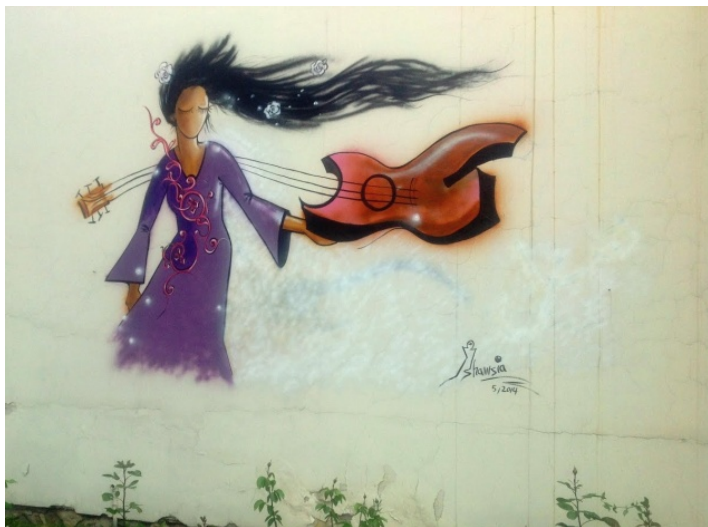
Slika 15: Melodija proljeća