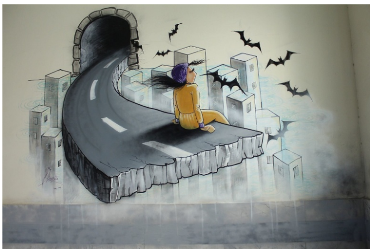
Slika 16: Krila slobode