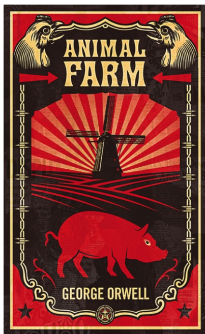
Slika 22: Naslovnica za novo izdanje engleskog klasika “ Životinjska farma ” Georgea Orwella.