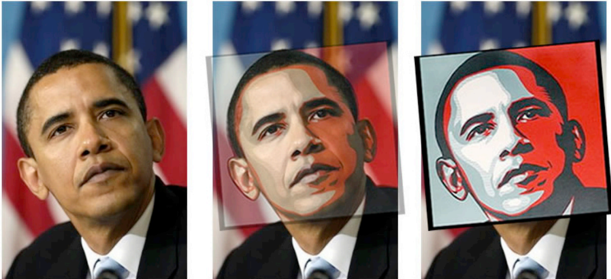
Slika 23: Hope