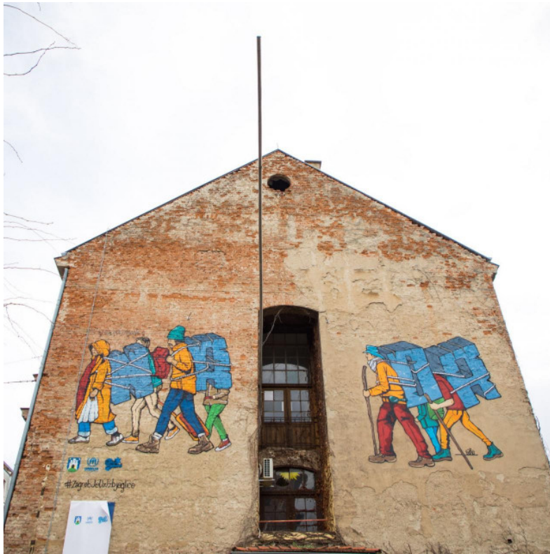
Slika 35: Novi mural u Zagrebu posvećen izbjeglicama