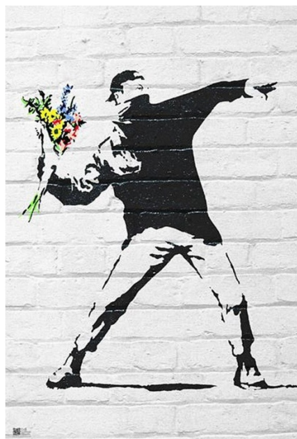
Slika 11: Bacač cvijeća

Izvor: https://banksyexplained.com/toxic-mary/