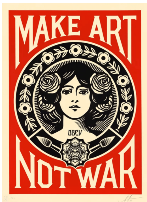
Slika 20: Stvarajmo umjetnost a ne rat