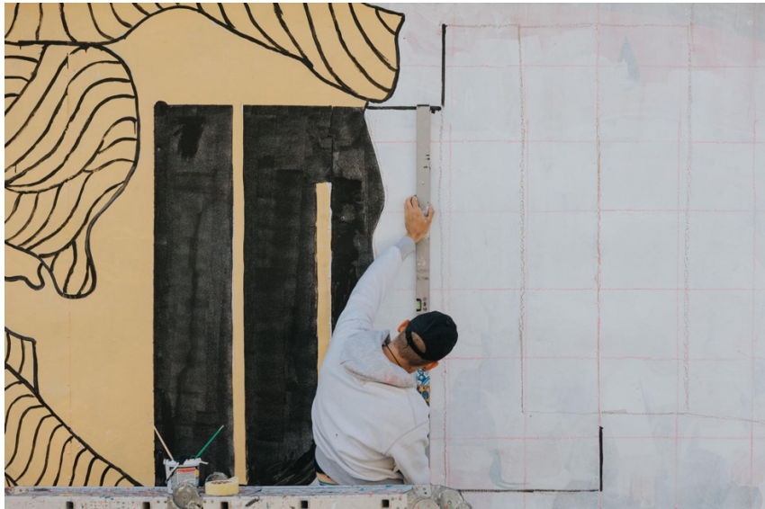
Slika 40: Polite bastART