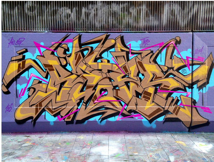
Slika 3: Divlji stil grafita