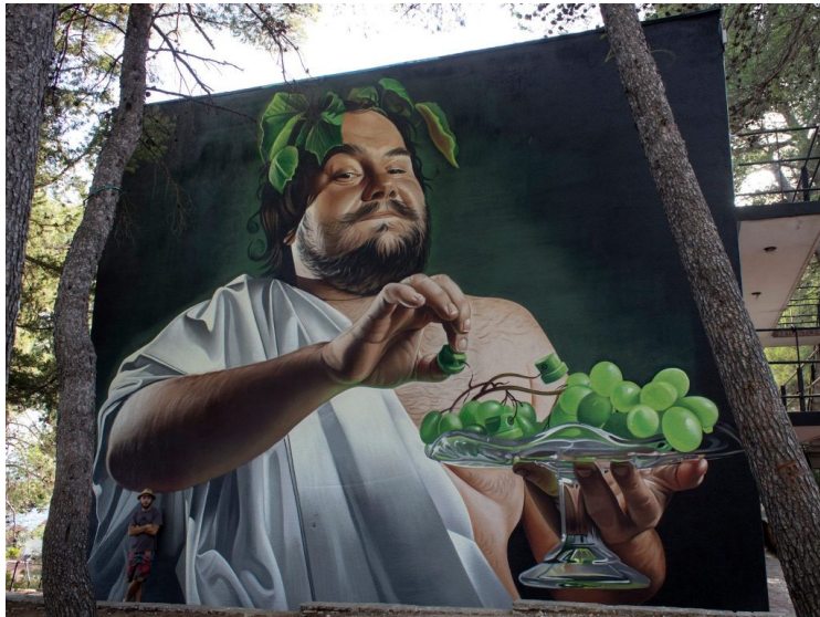
Slika 31: Dionysus