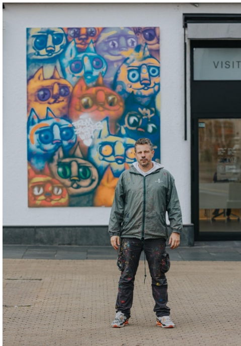
Slika 37: Lunar

nebeska prostranstva, grupe mačaka prikazuju različite kulture i ljude s bojama i elementima koje se miješaju i ponavljaju (Wikipedia, 2023).