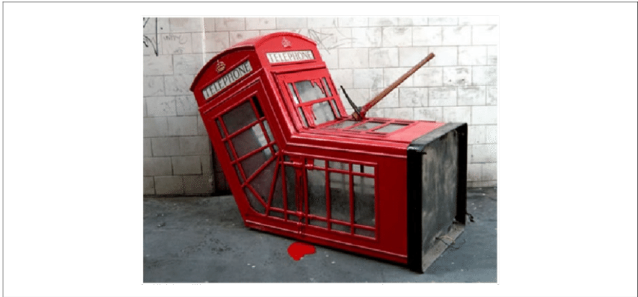
Slika 9: Telefonska govornica