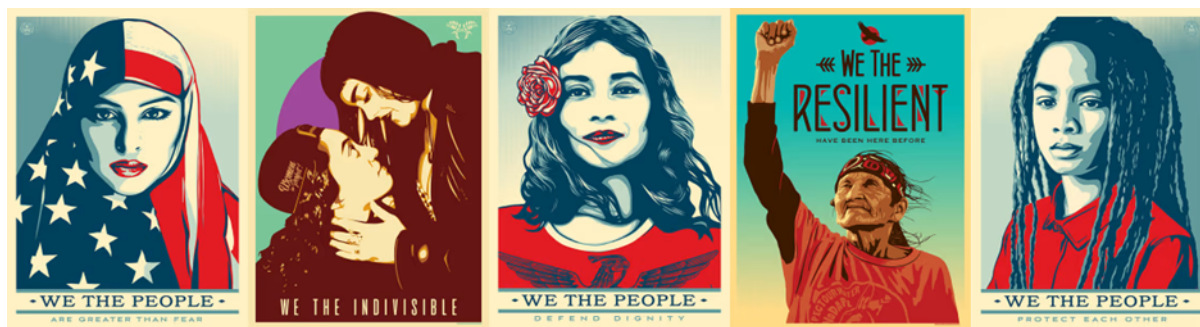
Slika 19: We the people