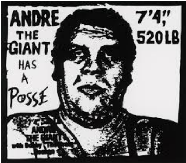
Slika 17: Andre the Giant Has a Posse

Frank Shepard Fairey (rođen 15. veljače 1970.) je američki suvremeni umjetnik, aktivist i osnivač brenda OBEY Clothing, koji je postao poznat u skateboarding sceni. 1989. godine dizajnirao je kampanju "Andre the Giant Has a Posse" (...OBEY...) naljepnica dok je pohađao Rhode Island School of Design (RISD) (Wikipedia, 2024).