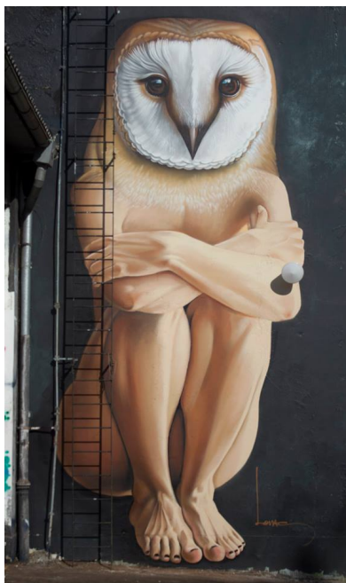
Slika 32: Djelo umjetnika Lonca

Izvor: https://www.isupportstreetart.com/artist/lonac/