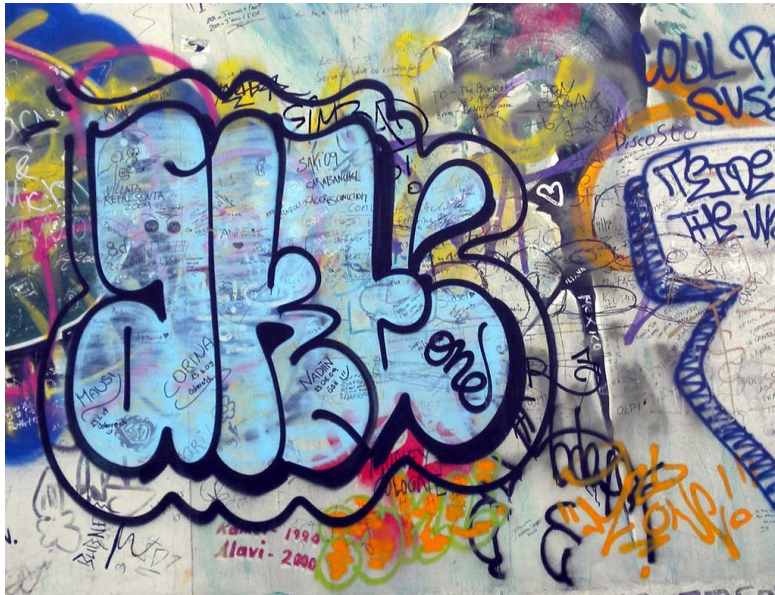
Slika 4: Bubble stil graffita