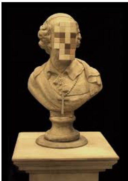
Slika 7: Kardinalov sin

Nadalje, nakon skandala vezanih uz zataškavanje slučaja zlostavljanja djece unutar Katoličke crkve, Banksy je 2011. godine odlučio napasti crkvu na svoj prepoznatljiv način. Izradio je repliku biste jednog svećenika iz 18. stoljeća, čije je lice zamijenio pločicama koje imituju piksele korištene za skrivanje identiteta osumnjičenih kriminalaca. Bista je izložena u galeriji Walker u Liverpoolu, a Banksy je istaknuo: “Tako je lako zaboraviti istinske kršćanske vrijednosti – laži, korupciju i zlostavljanje”, te je oštro kritizirao sve ono što kršćanstvo formalno predstavlja (MixMag, 2020).