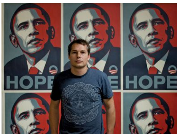
Slika 18: Fairey pozira ispred postera Hope

U 2008. godini, Fairey je postigao i mainstream uspjeh i kontrakulturnu prepoznatljivost s plakatom "Hope" za Obama. Međutim, plakat je temeljio na fotografiji Mannieja Garcije bez dozvole, što je dovelo do tužbe Associated Pressa. Fairey je tužio AP, tvrdeći da nije prekršio autorska prava. Slučaj je riješen 2011. godine, a 2012. godine Fairey je priznao krivicu za uništavanje dokumenata. Godine 2015. suočio se s optužbama zbog ilegalnog postavljanja plakata u Detroitu, no slučaj je kasnije odbačen. Plakat "Hope" samo je jedan primjer Faireyjeva čestog korištenja umjetnosti za izražavanje svojih snažnih uvjerenja. Prosvjedovao je protiv rata u Iraku, podržavao Occupy Wall Street, zalagao se za kontrolu oružja i zaštitu okoliša, te dizajnirao majicu za predsjedničku kampanju Bernieja Sandersa 2016. godine. 2012. je stvorio portret ubijenog afričko-američkog tinejdžera Trayvona Martina, a 2016. godine, u odgovoru na rasizam i netoleranciju tijekom predsjedničke kampanje, stvorio je seriju plakata "We the People" s manjinama kao glavnim likovima (Britannica, 2024).