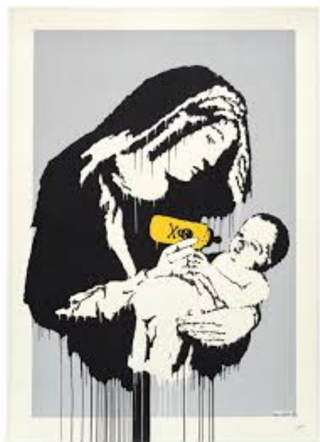
Slika 10: Banksy, Toxic Mary, 2003