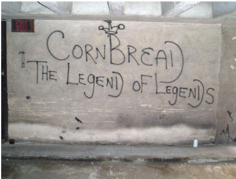
Slika 1: Cornbread

Grafiti, jednostavan čin sprejanja, pojavio se u Philadelphiji krajem 1960-ih. Godine 1965., Darryl “Cornbread” McCray, koji je danas široko prihvaćen kao prvi moderni grafiter na svijetu, bio je 12-godišnji problematični dječak smješten u Philadelphijskom Centru za razvoj mladih (YDC). Kao što možemo pretpostaviti, McCray je obožavao kukuruzni kruh. Volio ga je toliko da su mu kuhari u YDC-u dali nadimak “Cornbread” jer im je stalno dosađivao, tražeći da mu naprave kukuruzni kruh koji je jeo dok je odrastao s bakom. Potpuno oduševljen svojim novim nadimkom, Cornbread je osjetio potrebu podijeliti ga s drugim dječacima. Umjesto da sudjeluje u nasilju i konzumiranju droga koje su vladale u YDC-u, Cornbread je svoje vrijeme provodio dodajući svoj jedinstveni potpis na zidove objekta, koji su do tada bili prekriveni isključivo imenima bandi i njihovim simbolima. 1