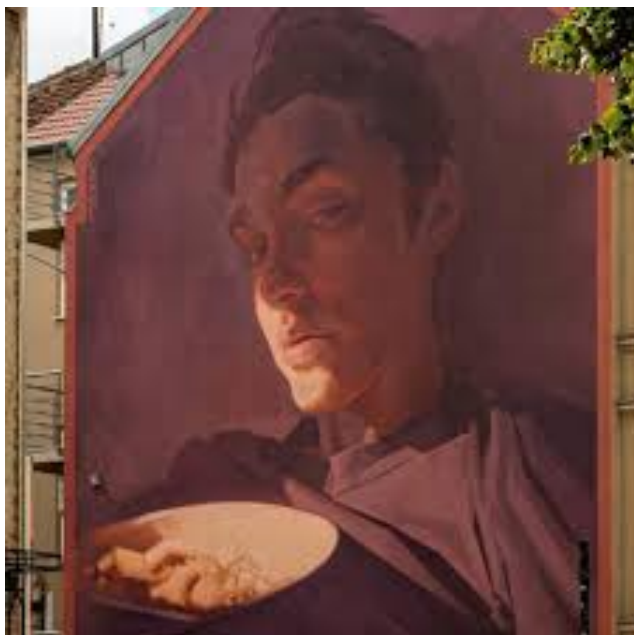
Slika 30: Flegma – doručak u krevetu