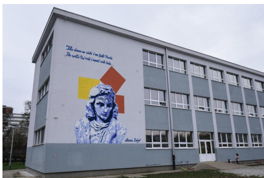
Slika 24: Mural Marina Držića na OŠ Marina Držića

Mural velikog hrvatskog dramskog pisca Marina Držića osvanuo je na istoimenoj osnovnoj školi u Trnju. Mural koji su njegovi autori, koji su ujedno i članovi umjetničke grupe ZID, darovali učenicima škole dio je osvještavanja i edukacije mladih o graffiti radovima kao umjetničkom, a ne vandalskom činu.