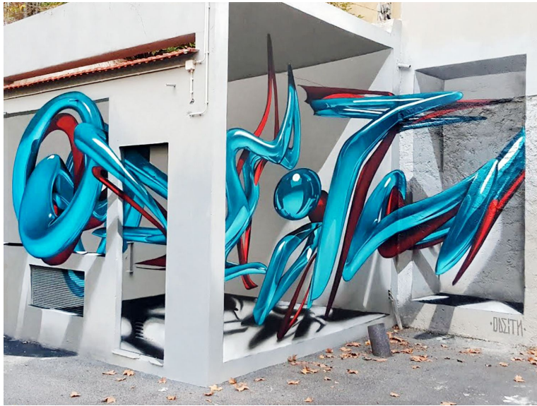
Slika 5: 3D stil