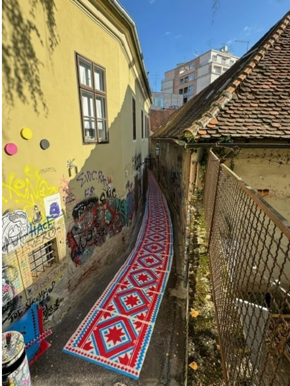
Slika 36: Novi mural prema Zakmardijevim stubama

najnoviji rad u blagdanski Zagreb donosi dodatnu toplinu i kreativnost, potvrđujući kako umjetnost može povezati ljude i obogatiti doživljaj grada u najljepšem dijelu godine (Journal, 2024).