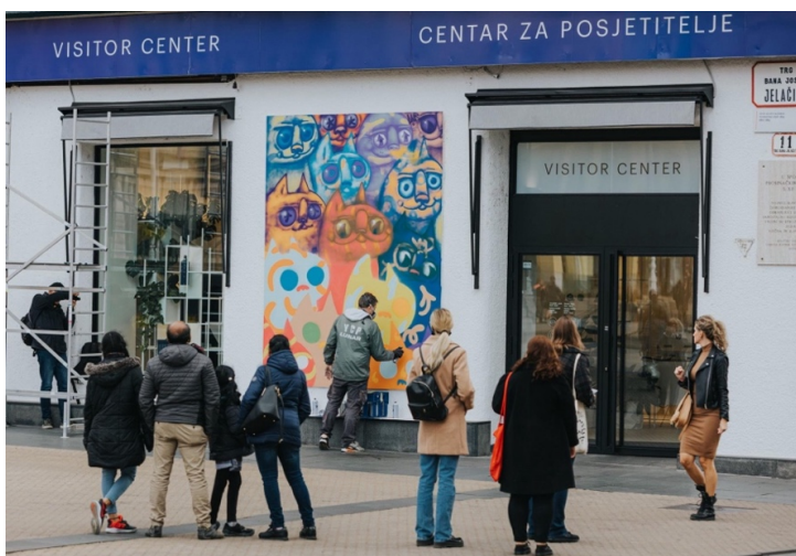
Slika 38: Rad street art umjetnika Lunara