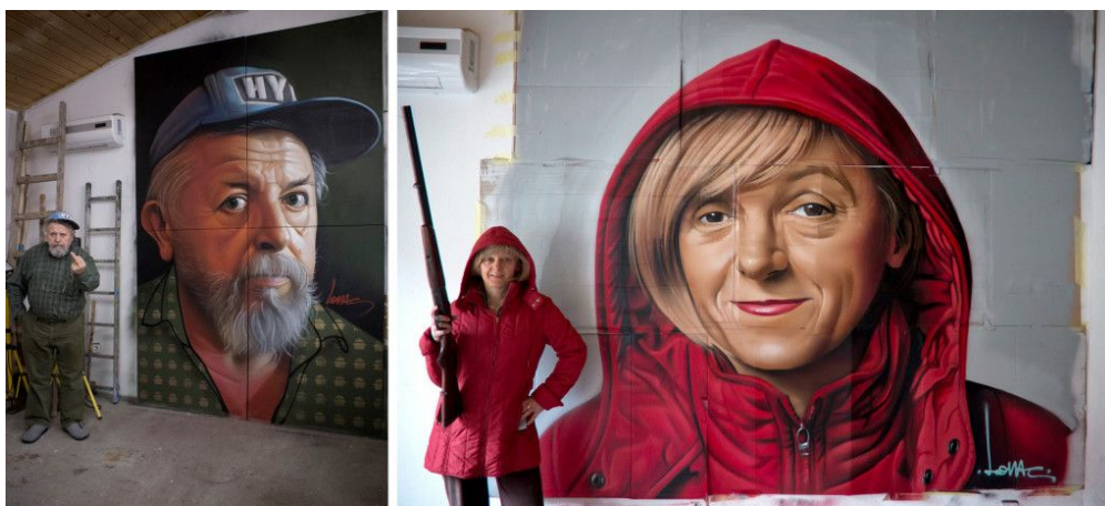
Slika 33: Portet roditelja prethodno spomenutog umjetnika