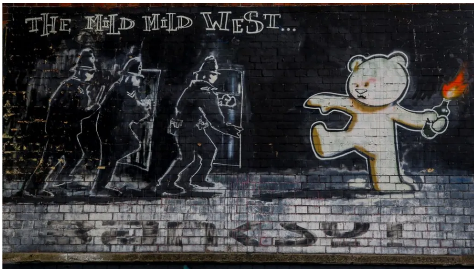
Slika 6: The Mild Mild West, Banksy

Banksy je jedan od najpoznatijih svjetskih umjetnika, no unatoč globalnoj popularnosti, njegov stvarni identitet ostaje nepoznat, barem službeno. Često ga novinari opisuju kao "nestalog" i "tajanstvenog" umjetnika, a "gerilski ulični umjetnik" broji slavne osobe poput glumca Brada Pitta među svojim obožavateljima i kolekcionarima. Za neke je heroj, a za druge vandal, dok njegova djela dostižu nevjerojatne cijene, a gradovi i vlasnici zemljišta žure iskoristiti ili preurediti zgrade koje odabere za svoja najnovija platna. Ipak, tajni umjetnik i figura koja se protivi establišmentu, uspješno je uspio ostati anonimn. Banksy je postao poznat nakon što je počeo sprejom oslikavati svoje sada prepoznatljive stencile u Bristolu početkom 1990-ih. Utjecajna glazbena i umjetnička scena tog grada, doma grupe poput Massive Attack i Portishead, navodno je inspirirala njegovo stvaralaštvo. Vjeruje se da je Banksy rođen u obližnjem gradiću Yate, u okrugu South Gloucestershire, početkom 1970-ih. Njegov prvi veliki stencil mural, The Mild Mild West, na kojem je prikazan medvjedić koji baca Molotovljev koktel na tri policajca, naslikan je u području Stokes Croft u Bristolu 1999. godine (BBC, 2024a).