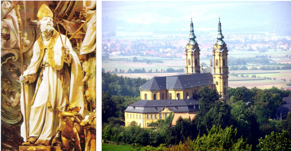
Slika 2. Kip sv. Vlaha (lijevo) s oltara 14 svetih pomoćnika u crkvi Vierzehnheiligen (desno), Bavarska

Neumanns, a raskoš boja, svjetla, oltara i kipova stavlja ovo svetište u red glasovitih crkava u Njemačkoj. 26