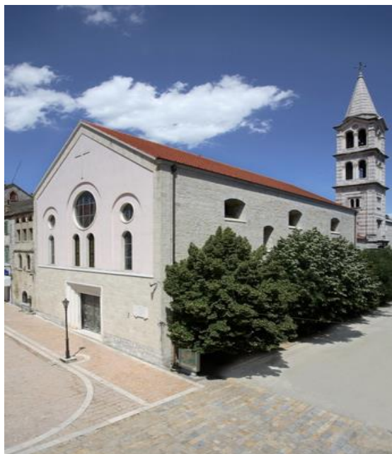
Slika 7. Svetište Gospe Sinjske