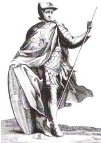
Slika 4. Vitez Reda svetoga Vlaha i BDM, bakrorez iz 18. stoljeća

Templara 52 , a za osnivača se smatra Leon Prvi, kralj armenske Cicilije 53 . Na prednjoj strani jednog stupa kapelice Rođenja Isusova u Jeruzalemu prikazana je Djevica Marija, a na stražnjoj pripadnik Reda. Pripadnik je obučen u bijelu tuniku koja na sredini ima medaljon sa slikom križa i svetog Vlaha. Sačuvano je i pismo preporuke pape Inocenta III. koje je 1206. godine poslao Leonu II., kralju armenske Cicilije, u kojem piše o naoružanju laika i pripadnika vojno-vjerskih redova te spominje Red svetog Vlaha i Blažene Djevice Marije. Pripadnici Crkve i politički vjerodostojnici zalagali su se za spajanja malih redova s većima jer su planirali započeti novi križarski rat i ponovno osvojiti Svetu Zemlju. 54