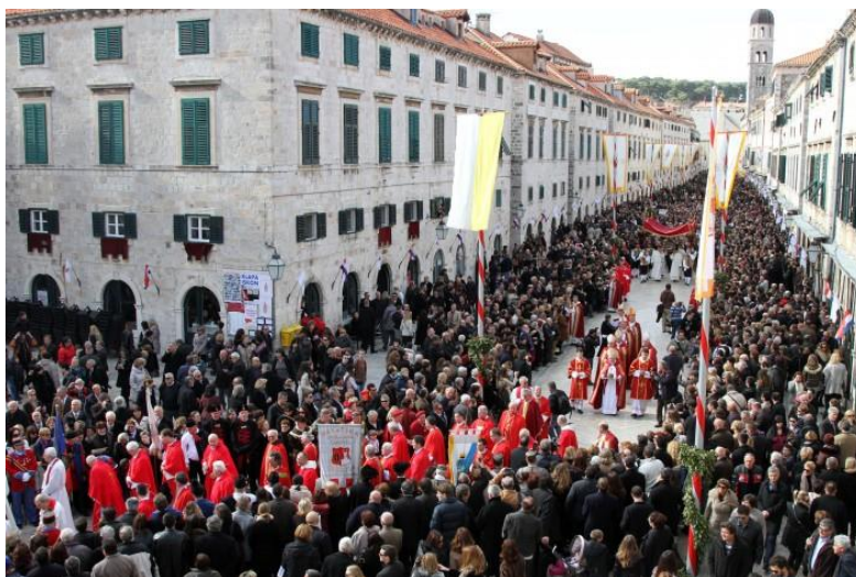
Slika 8. Procesija preko Straduna

Prvu nedjelju nakon Feste, vjernici u svečanoj povorci iz Grada hodočaste na Goricu svetoga Vlaha. Ispred crkvice na Gorici bude misa na otvorenom. Hodočasnici se nakon mise