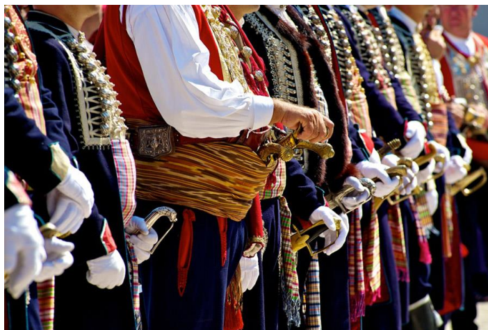
Slika 10. Detalji s nošnji alkarskih momaka i alkara

Po međunarodnim mjerilima, Alka je proglašena hrvatskim pokretnim spomenikom kulture najviše kategorije. Veliku čast ukazao joj je i Međunarodni odbor UNESCO-a 16. studenoga 2010. kada je na sjednici u Nairobiju donio odluku o upisu Sinjske alke na Popis zaštićene nematerijalne kulturne baštine čovječanstva. Tada je najstarija viteška igra na svijetu dobila i službeno priznanje najvažnije svjetske organizacije koja promiče kulturne vrijednosti. 104