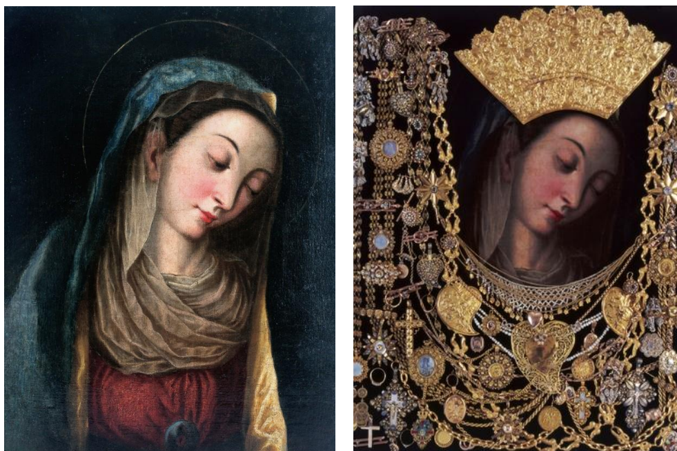
Slika 6. Čudotvorna slika Gospe Sinjske; lijevo: bez ukrasa, desno: sa zavjetnim darovima

sprijeda, čitava je Slika ukrašena zlatom – križevima, kolajnama, naušnicama, prstenjem i raznim drugim nakitom kojeg su Gospi darovali pobožni vjernici nakon primljenih milosti. Jednostavan pozlaćeni okvir zamijenjen je novim srebrnim okvirom izrađenim u Mlecima 1748. godine.