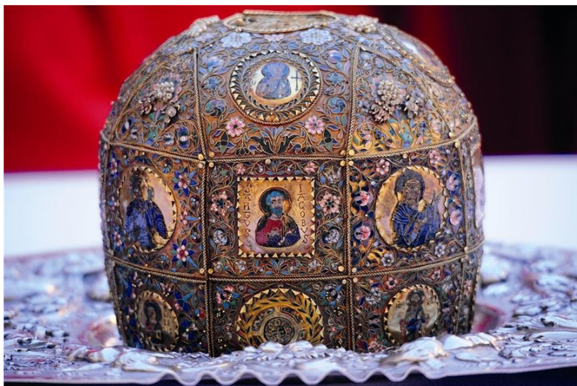
Slika 3. Moćnik glave sv. Vlaha

Brigović je zapisao da je, po jednoj predaji, moćnik glave svetog Vlaha donesen s istoka te da se u Gradu nalazi od 1026. godine kada ga je grčki opat ponudio u zamjenu za 500 dukata. Prema drugoj predaji, taj su relikvijar izradili bizantski majstori u 11. stoljeću upravo u Dubrovniku. Moćnik je i oblikovan kao bizantska kruna koja se sastoji od kupole s osam ploča, ispod koje slijede dva pojasa, od kojih svaki sadrži osam ploča također. Za ploče su pričvršćeni zlatni medaljoni kvadratnoga ili kružnoga oblika. Četiri medaljona na kupoli prikazuju svece: Mihajla, Vlaha, Petra i Andriju. Osam medaljona na srednjem pojasu prikazuju: svece Vlaha, Mateja, Jakova i Petra te Isusa, Bogorodicu i dva mučenika. Osam medaljona na donjem pojasu prikazuju Isusa, svece Zenobija, Ivana Evanđelistu i Ivana Krstitelja te četiri bizantska ornamenta. Cijelu krunu prekrivaju u filigranu i emajlu izrađeni cvjetovi, plodovi i lišće. Ove ukrasne pločice dodao je mletački zlatar Francesco Ferro 1694., kada je popravljao moćnik koji je oštećen u Velikom potresu. U svečanoj procesiji ovu relikviju nosi dubrovački biskup. 41