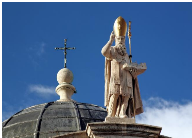
Slika 1. Kip svetog Vlaha na Crkvi sv. Vlaha u Dubrovniku

„Ne daj, Najveći, Bože, da tvrđave ove nad kojima pomno stražarim, zla ikada pritisne kob! Kriste, održavaj vazda sigurnost zidina ovih da bi uvijek te moj slavio puk!“ 14