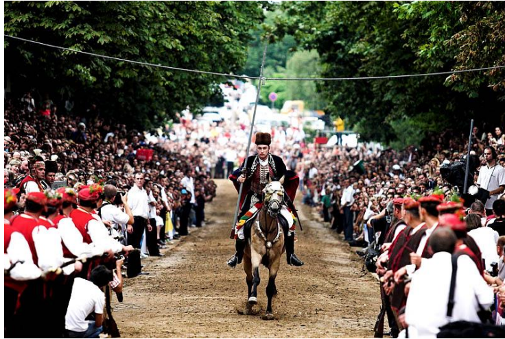
Slika 9. Alkar u trku

trenutak proglašenja slavodobitnika prati pucanje mačkula s bedema staroga Grada. Zatim Predsjednik Republike Hrvatske drži kraći prigodni govor te predaje pobjedniku sablju, a njegovom momku perni buzdovan ili kuburu kao poklon. 102