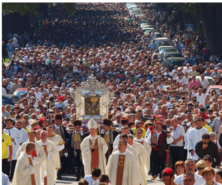
Slika 11. Procesija

prvu misu u zoru velikog blagdana. Blagdan Uznesenja Marijinog osobito se svečano slavi cijeli dan. Ujutro, nakon što se sviranjem fanfara i zvonjavom crkvenih zvona označi skidanje Čudotvorne slike Gospe Sinjske s oltara, slika se okadi te se zapjeva Njoj u slavu. Zatim četvorica svećenika uzimaju Sliku na ramena da je prenesu okićenim ulicama Sinja. U procesiji, koja se jako sporo kreće potpuno zbijenim ulicama, Sliku jedni drugima prenose alkari, alkarski momci, predstavnici hrvatske policije i vojske, predstavnici braniteljskih udruga, redovnice i vjeroučitelji te druge civilne udruge. Za vrijeme procesije čitaju se tekstovi za razmišljanje na onu temu na koju je usmjeren blagdan te određene godine; obitelj, ljubav, zahvalnost, trpljenje... Ushićeni puk nagurava se kako bi došao što bliže Prilici Majke Božje, svi je žele pomilovati i poljubiti.