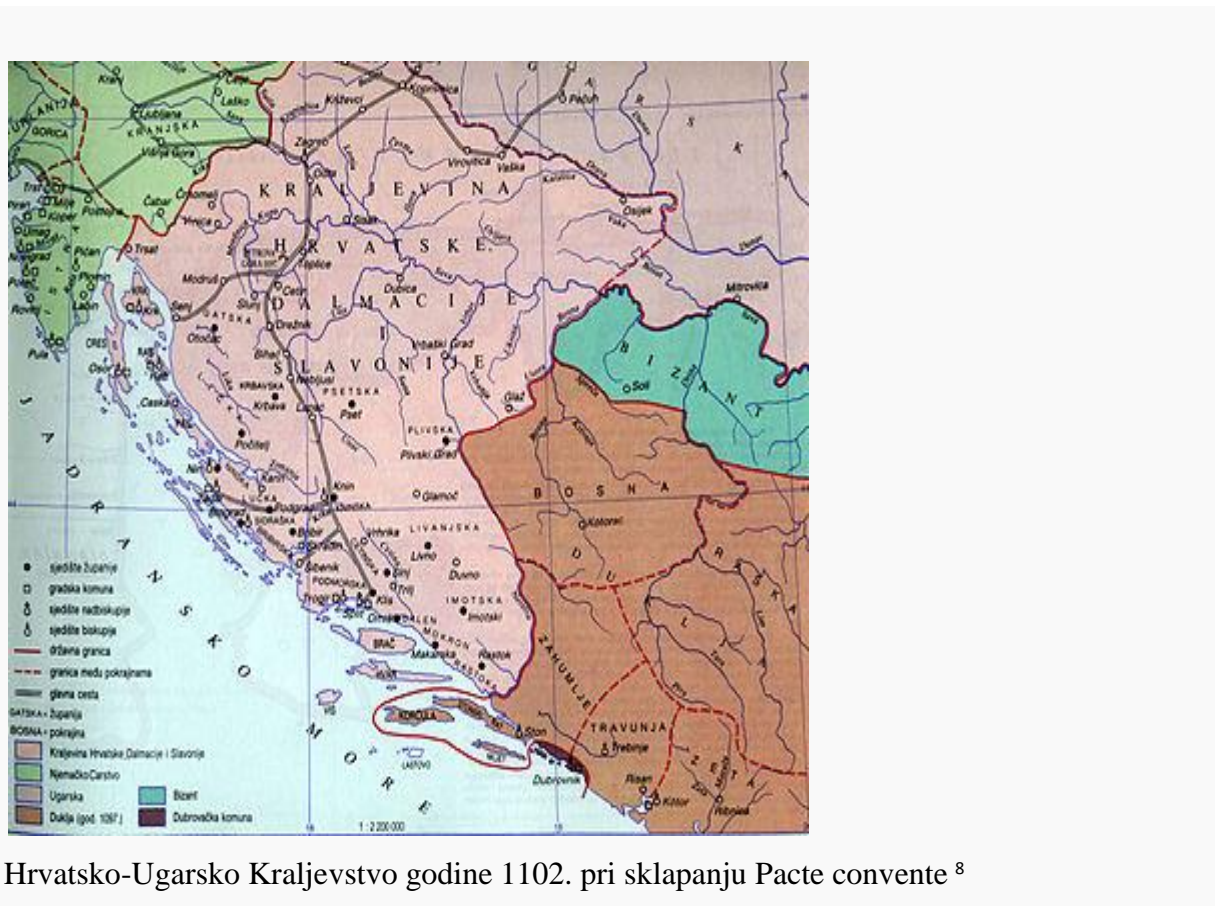
Hrvatsko-Ugarsko Kraljevstvo godine 1102. pri sklapanju Pacte convente 8

je jaku vojsku koja se mogla uzdržavati samo teritorijalno, pa je Koloman sve zemljišne posjede, koji već nisu bili u posjedu slobodnih seljaka ili vlastelina, davao vojnicima u zamjenu za vojnu obvezu. Hrvatsko plemstvo se također feudalizira i nestaju stare strukture hrvatskog plemstva županijskog ustrojstva a javlja se novi oblik sa sudskom, upravnom i gospodarstvenom ovlasti. Mađarski kraljevi su imenovali hrvatskog bana, dijelili su donacije vlastelinima, potvrđivali zakone donesene na hrvatskom i slavonskom saboru i zapovijedali udruženom ugarsko-hrvatskom vojskom. Hrvatski ban je imao obvezu upravljanja administracijom, sudstvom, financijama i predvodio je hrvatsku vojsku u ratovima. Pojedine su se obitelji, zahvaljujući donacijama, toliko osilile i na taj način uvažavale i jak politički utjecaj (krčki i blagajski knezovi, bibrirski Šubići, cetinjski Nelipići, omiški Kačići, krbavski Kurjakovići). Slijedi slika koja pokazuje tadašnju podijelu Hrvatske.