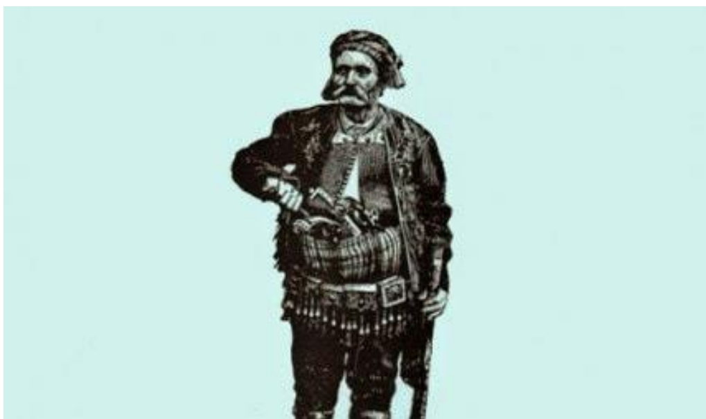
Hajduk Andrijica Šimić 19

Za Imotsku krajinu veže se i jedna posebna priča, koja je u usmenoj predaji preživjela u nekoliko različitih varijanti. Priča je to o Andrijici Šimiću, legendarnom hrvatskom hajduku koji je svojom spretnošću i snalažljivošću postao zapamćen među Hrvatima u Dalmaciji i Hercegovini. Rodio se 2. listopada 1833. godine u Alagovcu pored Gruda. Sa samo 10 godina otišao je u Mostar u službu agi Tikvini i služio ga punih 10 godina. Nepravde i zulum kojemu je svjedočio natjerali su ga da 1959. godine ode u planinu. Oružje je oteo nepoznatome begu tako što mu je sasuo šaku prašine u oči. Andrijica Šimić hajdukovao je po Rakitnu, Doljanima, Imotskom, Kupresu, Livnu, Glamoču i Vrlici. Narod ga u pričama opisuje kao branitelja sirotinje i zaštitnika potlačenih. Često je progonio i bogatije kršćane. Uhićen je nakon izdajom 1866. godine i izručen turskim vlastima. Dvije godine proveo je u tamnicama u Splitu, Imotskom, Duvnu, Livnu i Ljubuškom da bi, „prepilivši okove, 1868. pobjegao iz ljubuškog zatvora i ponovno se odmetnuo u hajduke.“ 18