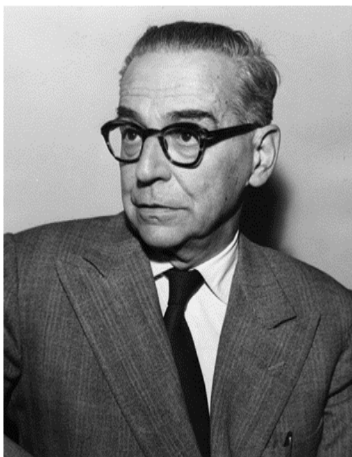
Ivo Andrić 8