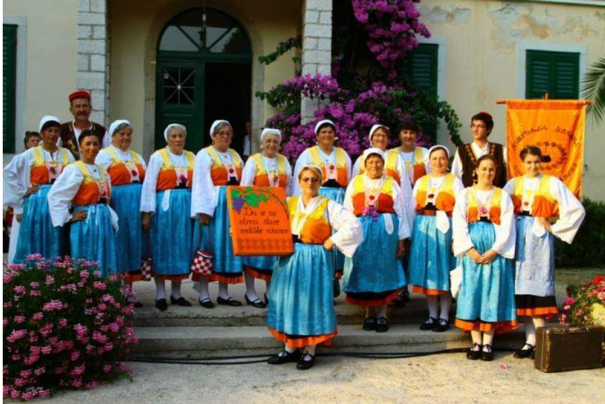
Slika 3. Vodička narodna nošnja (svečana); na fotografiji su članice i članovi KU Vodiške perlice, preuzeto s mrežne stranice Infovodice (24.8.2019.), URL: https://www.infovodice.com/obavijesti/2948-rad-vodicke-kulturne-udruga-vodiske-perlice-mozete-pratiti-i-na-facebook-u.html

Ka radnu robu, trliš nosili su košuju ili majicu i na glavi klobuk. 115