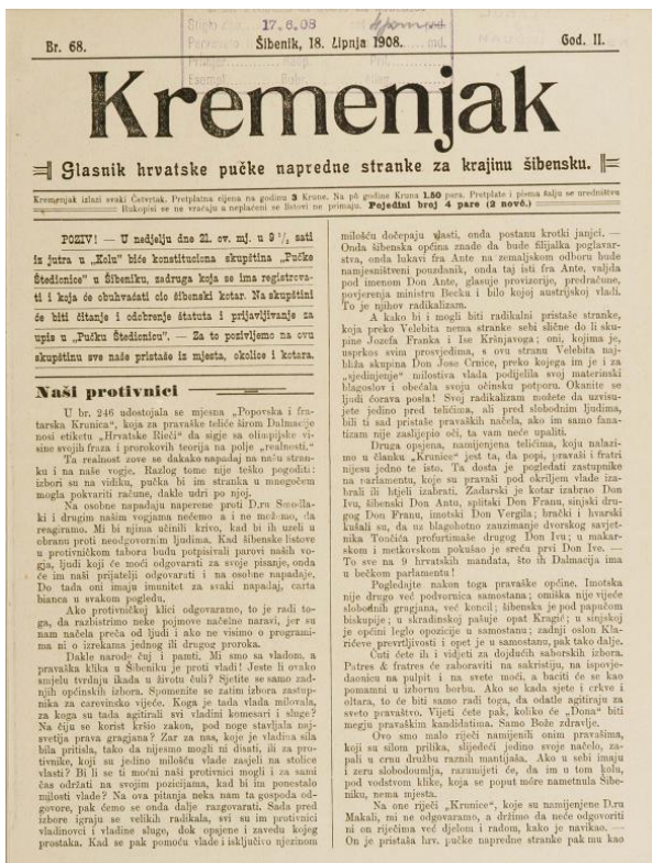
Slika 1. Naslovnica časopisa Kremenjak, br. 68., 1908

to je bilo društveno, društvena norma. Prvo šta su to bili vjerojatno mlađi momci, iako oni dokumenti šta ih mi imamo, to je baš vridno za spomeniti, ima ih tri-četiri šta je župnik da, di piše kako su oni pisali molbu za ući u žudije. Nisu pisali oni u svoje ime, nego su pisali stariji, kao u ime bratovštine, da predlažu tih pet i moli se da se to zadrži u tajnosti ako slučajno ne bi župnik odobrija da oni mogu biti. To su dokumenti iz '41. i '28. i još piše: te napominjemo da nisu u nikakvoj stranci, „stranki“, niti u društvu i tako dalje i moli se da se zadrži u tajnosti ako ne bi uspili ući u žudije. Znači, isto to nije bilo baš bez veze, isto si ti mora nekako; moralo te primiti na osnovu nečega. 60