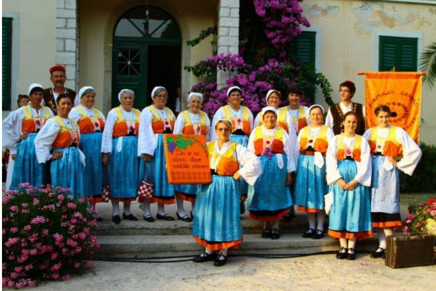
Slika 3. Vodička narodna nošnja (svečana); na fotografiji su članice i članovi KU Vodiške perlice, preuzeto s mrežne stranice Infovodice (24.8.2019.), URL: https://www.infovodice.com/obavijesti/2948-rad-vodicke-kulturne-udruge-vodiske-perlice-mozete-pratiti-i-na-facebook-u.html

Ka radnu robu, trliš nosili su košuju ili majicu i na glavi klobuk. 115