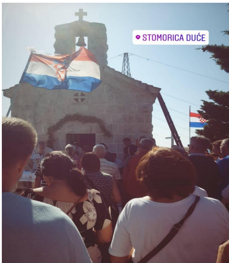
Stomorica, kolovoz 2019. godine. Sveta misa.