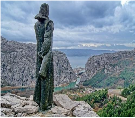
Meštrovićeva statua Mile Gojsalić, Gata.