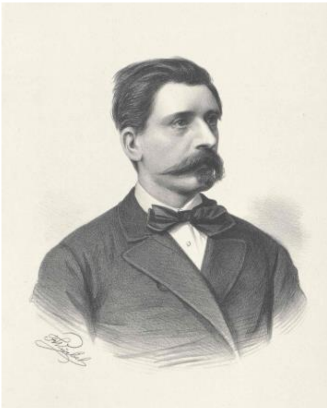
Slika 1.- Benjamin Kállay

ispunjen poslom i kontinuiranim obrazovanjem, pronašao bi i vrijeme za zabavni život pa je tako uživao u lovu, mačevanju, plesu ali i pohađanju kazališta. Kartao je, bio je ljubimac žena koje je očaravao mnogovrsnim znanjima i vještinama, a koje će iskoristavati kako bi se probijao u društvenoj hijerarhiji. 34 Od 1863. godine do 1865. godine vodio je svoj prvi dnevnik. U njemu je pak pomno bilježio samo preokupacije ekonomske prirode, vezane uz poslove oko imanja sa mnogo dugova i malo prihoda. Taj dnevnik je potvrdio kako je kasniji beogradski dnevnik zapravo sastavni dio njegovog metodičnog rada, karakteriziran upravo time što je pomno kontrolirao i bilježio sve što je učinjeno sa njegove strane u onim životnim područjima kojima je tih godina bio najviše zaokupljen. 1867. godine je izdao spis u mađarskom prijevodu sa predgovorom: O slobodi britanskog utilitarističkog filozofa Johna Stuarta Milla. 35 Iz analize tog djela, mađarski povjesničar Lajos Thallóczy je primijetio kako su Kállayevu pažnju najviše zauzimali Millovi pogledi na praktične političke odnose pa je tako u predgovoru posebno istaknuo Millove stavove o utilitarizmu, organizaciji vlasti i birokraciji. 36