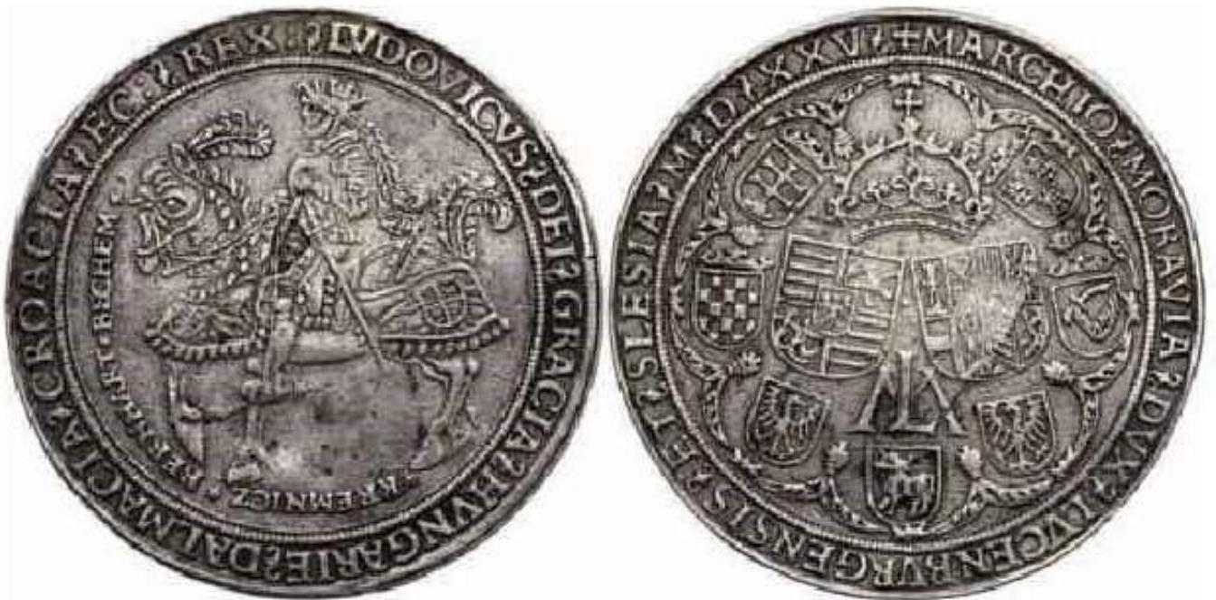
Slika 10.- Avers i revers srebrenog talira ugarsko - hrvatskog kralja Ludovika II. iz 1525.