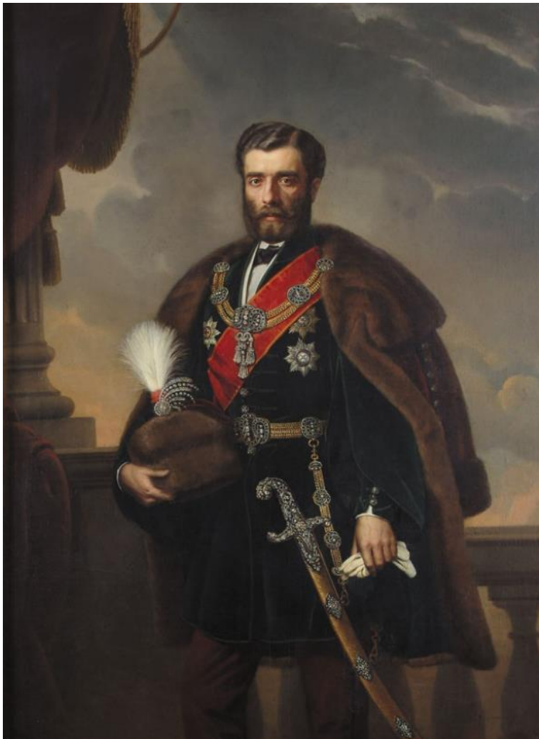
Slika 2.- Knez Mihailo Obrenović

„Moj rad ovdje je tako dobro počeo, čvrsto vjerujem kako bih samo i za jednu godinu mirnog djelovanja uspio uvjeriti Srbiju u to da smo joj mi iskreni prijatelji, i možda bih uspio da zauvijek uništim ruski utjecaj u ovoj pokrajini. Sada moram početi sve iz početka, čak se nema što ni početi jer je svima potpuno nepoznat teren kojim se krećemo. Istina je kako su ovo zanimljive prilike i vremena, ali možda mogu imati štetan ishod po našu politiku i priznajem kako bih više volio makar lagan i neupadljiv ali siguran rezultat. Premećući takve misli po glavi, nisam mogao da zaspim.“ 82