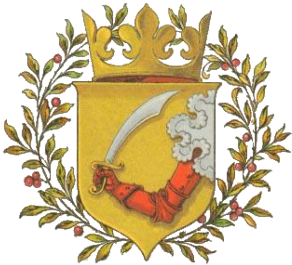
Slika 9.- Grb Bosne i Hercegovine od 1889.