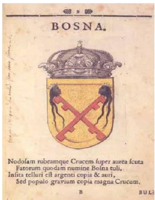
Slika 8.- Grb Bosne iz zbirke Stemmatographia

Kállay je izvjestio ugarskog ministra – predsjednika Sándora Wekerlea o potrebi uvođenja bosanskog grba i zastave jer su prilike u Bosni i Hercegovini potkraj osamdesetih godina nalagale definitivnu odluku o bosanskom grbu i zastavi pa je tako tvrdio da se domaće stanovništvo služi zastavama u hrvatskim ili srpskim bojama što je prema Kállayevom mišljenju davalo povod neprijatnostima ali i što više nije mogao podnositi iz političkih i državno – pravnih razloga. Od nekoliko varijanti grbova do kojih su došli istraživači, Kállay se odlučio za grb Rame, koji se inače nalazio u ugarskoj kruni, a zatim i u habsburškoj kruni i koji se pojavljuje u dva carska patenta iz 1804. godine i 1836. godine na velikom pečatu kao grb Bosne. 211 Značajan utjecaj na odabir grba Rame imati će i poznata ugarska deviza da je „Rama isto što i Bosna“ ( Rama seu Bosna ). Dakle, time se nastojalo potvrditi kako je Bosna uistinu isto što i Rama, odnosno da su ugarski kraljevi imali prevlast nad Bosnom jer su smatrali da se ona još od 12. stoljeća pod imenom Rame javljala u ugarskoj vladarskoj titulaturi. 212 Osoba koja je predložila izabrani grb, Lajos Thallóczy, uživala je veliki ugled i autoritet kod vladajućih struktura u Bosni i Hercegovini 213 , a na inicijativu samog Kállaya došao je u Beč i postao državni savjetnik i direktor Arhiva Zajedničkog ministarstva financija. 214