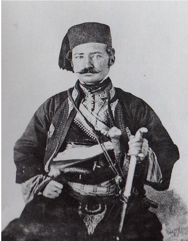
Slika 3.- Milivoje Petrović Blaznavac