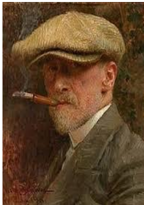
Autoportret s beretom, 1914.

Grafička aktivnost s karton – tiskom u kontaktu s likovnim djelom „ Autoportret s beretom “, trajala je desetak dana tijekom rujna 2019. godine u jednoj odgojnoj skupini od 21 djece 3 do 7 godina. U grafičkoj izradi karton - tiska uvijek su sudjelovala sva djeca koja su toga dana bila u vrtiću. Prosječno dnevni dolazak djece u vrtić je 16 – 18 djece. Do završetka procesa aktivnosti s karton tiskom, kontinuirano je sudjelovalo šestero djece.