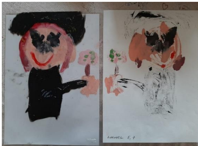
Oslikan rad na foliji i otisnut rad na papiru, (Š.V. 5,9 god.)