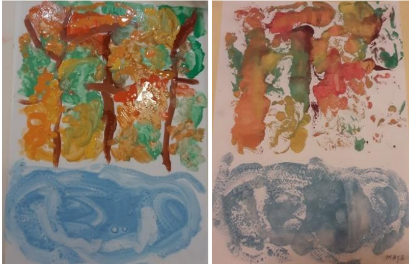
Oslikan rad na foliji i otisnut rad na papiru (M. V., 6 god.)