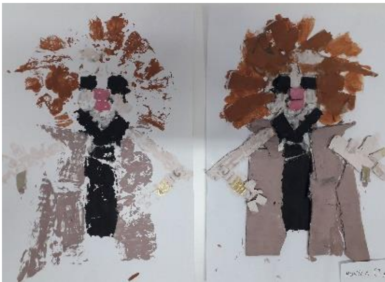
Otisnut rad i obojan rad prije tuskanja ( M. I., 7 god.)