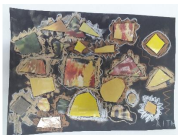
Kolaž od bojanog papira i slika iz časopisa, „Boje jeseni“, dijete 6 god.

Također, tijekom rada na odgojnim projektima u dječjim vrtićima često se primjenjuju kolaž, foto-montaža rezanim i trganim obojanim papirima, foto-reprodukcijama, tkaninama i drugim materijalima. Kolaž i foto-montaža pružaju mnoštvo mogućnosti improvizacija. Izrezivanjem ili kidanjem različitih obojenih papira, časopisa, novina, fotografija, tkanina te naljepljivanjem na podlogu djeca oblikuju plošni kolaž i foto-montažu. „Premještanjem izrezanih oblika bez suvišnih detalja zapaziti će niz oblikovanih mogućnosti građenja odabranih sadržaja čime će se djeca uspješno pripremiti za dalja grafička razmišljanja i djelovanja“ (Vuljan, Kušćević, 2007, 53).