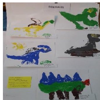
Monotipija „Dinosauri“, radovi djece, 5 god.