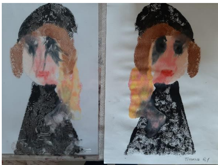
Otisnut rad na papiru i oslikan rad na foliji (P.R., 6, 2 god.)