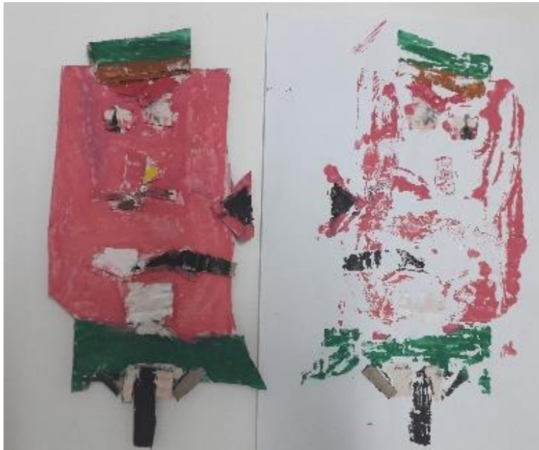
Obojan rad i otisnut rad poslije bojanja (E. G., 5,5 god.)