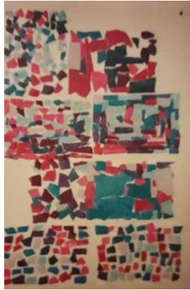
Kolaž od bojanih komadića papira, radovi djece od 5 god.

Tri odgojiteljice iz likovnih vrtića u Splitu ponekad koriste tehniku monotipiju , a za podlogu tada koriste raznobojne fotopapire, plastične folije ili alufoliju. Dijete naslika što želi na plastičnoj foliji ili komadu pleksiglasa (može i na papiru), te zatim otisne svoj uradak na drugi papir. Kako izjavljuju te odgojiteljice, djeca brzo nauče da osim rukama i valjkom mogu tiskati foliju na podlogu. Šparavec ističe da „premda monotipija pretpostavlja jedan otisak, može se pokušati jednom otisnut rad otisnuti još jednom ili dvaput, ali tada je otisak slabiji, nejasniji. To je radnja koja djeci otvara još jedna vrata u procesu učenja, shvaćanja, ali i stvaranja“ (Šparavec, 2018, 100).