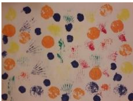
Otiskivanje čepova i školjki , dijete 4,3 god.

Također, tijekom rada na odgojnim projektima u dječjim vrtićima često se primjenjuju kolaž, foto-montaža rezanim i trganim obojanim papirima, foto-reprodukcijama, tkaninama i drugim materijalima. Kolaž i foto-montaža pružaju mnoštvo mogućnosti improvizacija. Izrezivanjem ili kidanjem različitih obojenih papira, časopisa, novina, fotografija, tkanina te naljepljivanjem na podlogu djeca oblikuju plošni kolaž i foto-montažu. „Premještanjem izrezanih oblika bez suvišnih detalja zapaziti će niz oblikovanih mogućnosti građenja odabranih sadržaja čime će se djeca uspješno pripremiti za dalja grafička razmišljanja i djelovanja“ (Vuljan, Kušćević, 2007, 53).