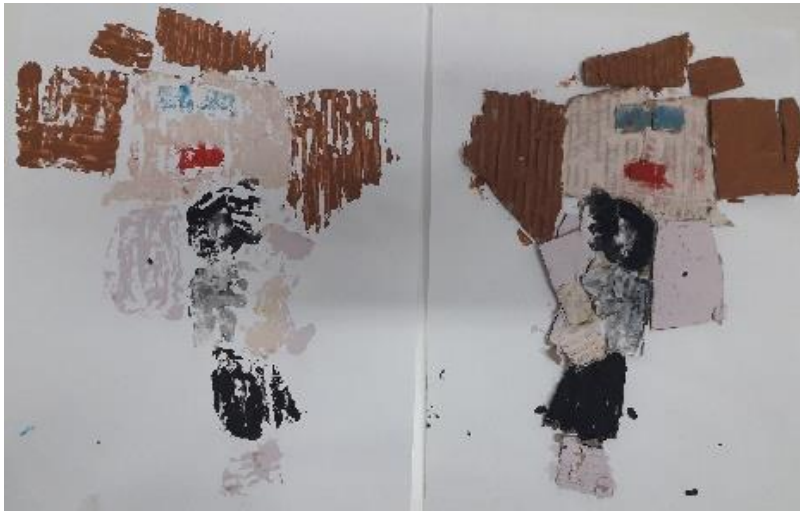
Otisnut rad i obojani rad prije tiskanja (T. M., 4,5 god.)