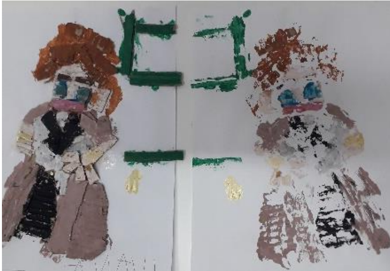
Obojani rad i otisnut rad poslije (I. Š. , 6 god.)