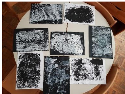
Otisnuti radovi s alufolije, „Paukova mreža“, radovi djece, 5 god.

Tri odgojiteljice iz likovnih vrtića u Splitu ponekad koriste tehniku monotipiju , a za podlogu tada koriste raznobojne fotopapire, plastične folije ili alufoliju. Dijete naslika što želi na plastičnoj foliji ili komadu pleksiglasa (može i na papiru), te zatim otisne svoj uradak na drugi papir. Kako izjavljuju te odgojiteljice, djeca brzo nauče da osim rukama i valjkom mogu tiskati foliju na podlogu. Šparavec ističe da „premda monotipija pretpostavlja jedan otisak, može se pokušati jednom otisnut rad otisnuti još jednom ili dvaput, ali tada je otisak slabiji, nejasniji. To je radnja koja djeci otvara još jedna vrata u procesu učenja, shvaćanja, ali i stvaranja“ (Šparavec, 2018, 100).