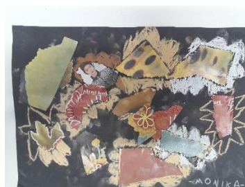
Kolaž od slika iz časopisa i slikarsku kedu „Boje jeseni“ , dijete 7 god.