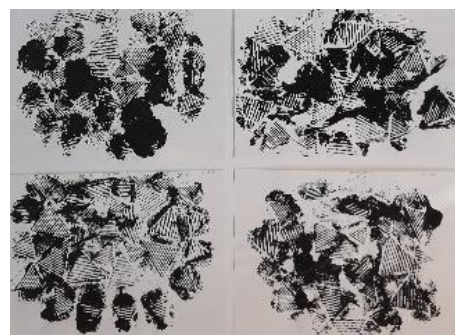
Karton tisak „Čipka“, radovi djece od 6 god.