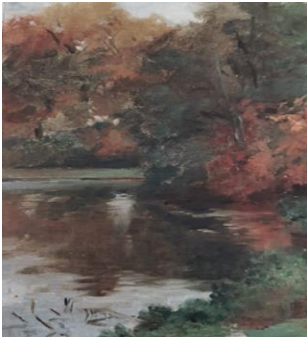
Iz Fontaineblaua, oko 1886.

Praćenje aktivnosti izrade monotipije u komunikaciji s Bukovčevim djelom Iz Fontaineblaua , realizirali smo s istom grupom djece iz istog vrtića od 25. do 29. studenoga 2019. godine.