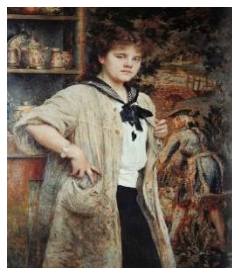
Mlada umjetnica, 1914.

Živa mrljasta pozadina sjajnih pastoznih namaza pretežno je sive, zelene i crvenosmeđe boje. Opći dojam slike je taman. Luministički akcenti su na ovratniku i kapi.