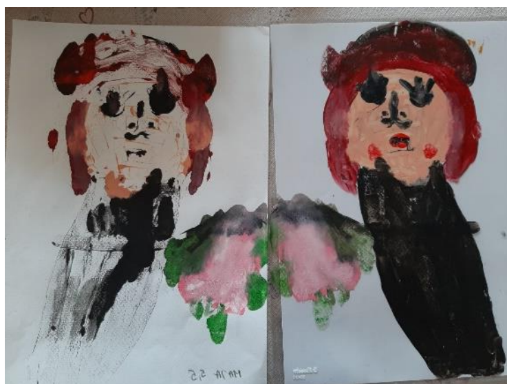
Otisnut rad na papiru i oslikan rad na foliji (M. A., 5,6 god.)