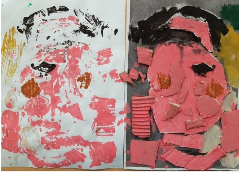
Otisnut i obojan rad prije tisknja (N. I., 4 god.)