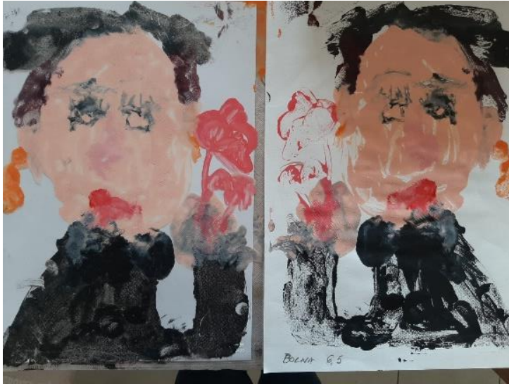
Oslikan rad na foliji i otisnut rad na papiru ( T.P., 4,8 god).