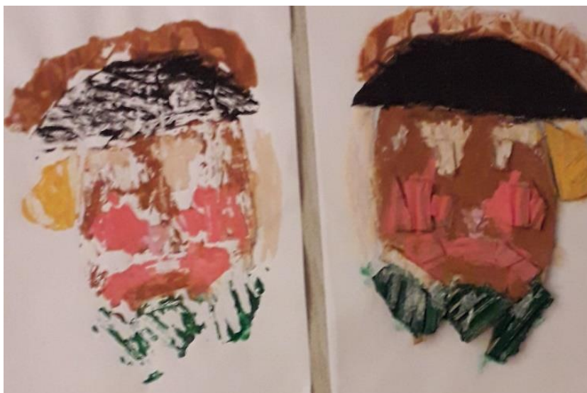
Otisnut rad i obojan rad prije tiskanja (N. T., 4,2 god.)

Iz prezentiranih radova uočava se različitost u doživljaju umjetničkog djela. Svako je dijete na svoj način bojom i plohom oblikovalo svoj doživljaj. Možemo zaključiti da su djeca različite dobi uspješno prenijela promatrani i doživljeni motiv reprodukcije kroz zadanu grafičku tehniku karton-tisak.