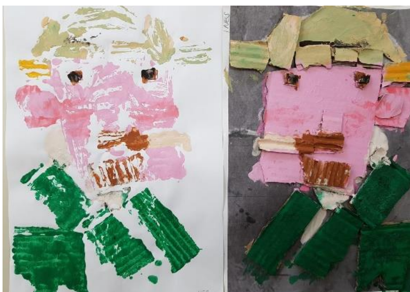
Otisnut i obojan rad prije tiskanja (I. P. 6 god.)