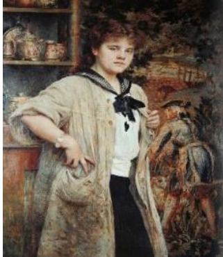
Mlada umjetnica, 1914.

Likovne aktivnosti izrade karton-tiska u komunikaciji s Bukovčevim djelom Mlada umjetnica realizirali smo s istom grupom djece u istom vrtiću, kroz metodu estetskog transfera, u periodu od 15. do 25. listopada 2019. godine.