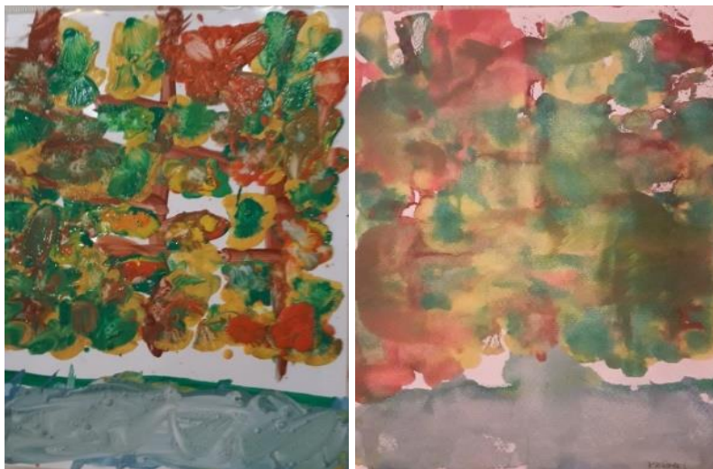
Oslikan rad na foliji i otisnut rad na papiru (K. J. 6,2)