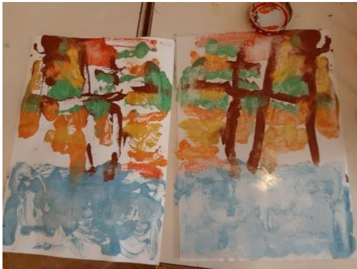
Otisnut rad na papiru i oslikan rad na foliji ( M. J. 4, 9 god.)