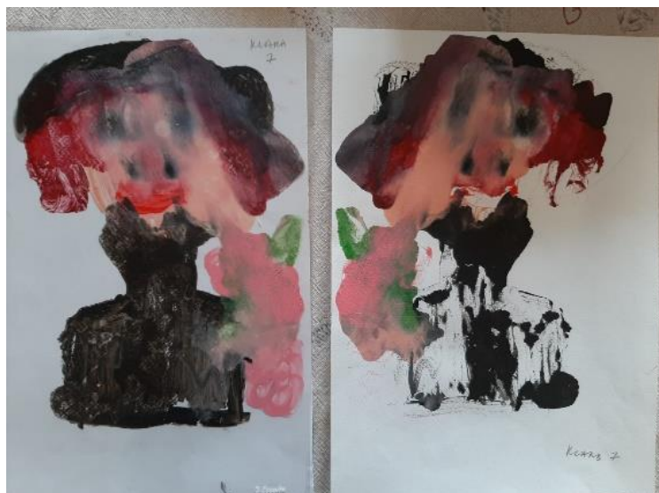
Oslikan rad na foliji i otisnut rad na papiru, (P. J. 7 god.)

Zajedno s odgojiteljem djeca su izložila svoje radove te su komentirala svoj rad i rad svojih vršnjaka. Tako je bio uspostavljen dijalog između odgojiteljice i djece, između djece, likovnim radovima i postavljenim ciljem likovno stvaralačkog rada.