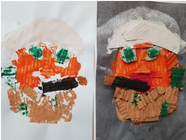
Otisnut i obojan rad prije tiskanja (I. Š., 5,5 god.)