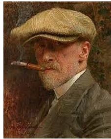
Autoportret s beretom, 1914.

sa šetnje ili izleta, odlaskom u muzej i promatranjem slika pejzaža. Stoga smatramo da će motivi izabranih Bukovčevih djela potaknuti doživljaj u djece te želju da ih likovno izraze.