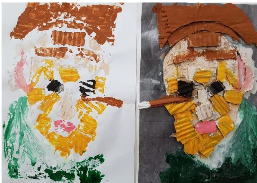
Otisnut rad i obojan rad prije tiskanja (I. T., 6 god.)