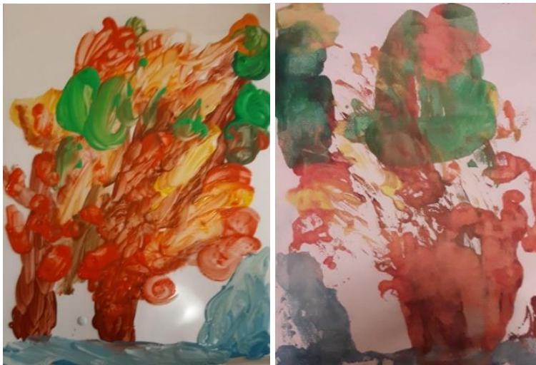
Oslikan rad na foliji i otisnut rad na papiru (V. M., 5 god.)