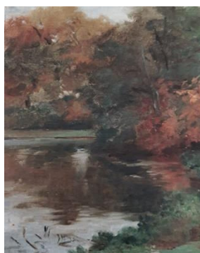
Iz Fontaineblaua, oko 1886. god.

Pejzaž Iz Fontainebleaua (oko 1886) izrađen je tehnikom ulja na platnu u dimenzijama 32,5 cm x 45,5 cm oko 1880. godine a naslikan je u šumi Fontainebleau kraj Pariza. Na slici je prikazan „smiren šumski predjel u bogatoj jesenjoj skali boja, koji su u početku još zatvoreni i tamni, a umjetnikova pažnja usmjerena je na površinu vode u prednjem planu, koja zadržava svoju okolinu“ (Kružić – Uchytíl, 1968, 73).