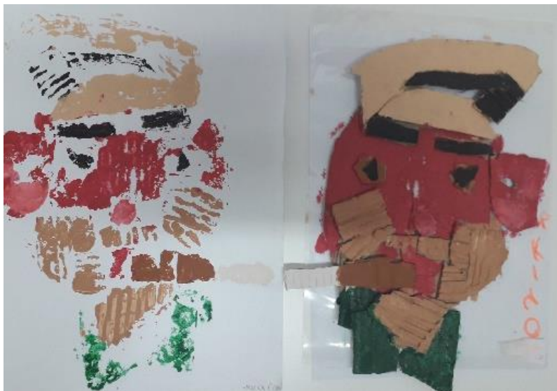
Otisnut rad i obojan rad prije (M. Š. 7 god.)