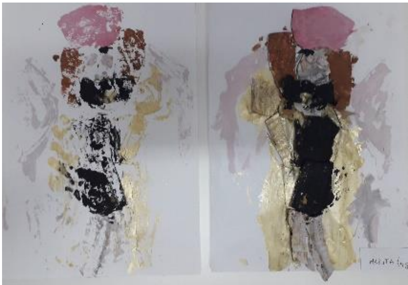
Otisnut rad i obojani rad prije tiskanja (M. A., 4 god.)