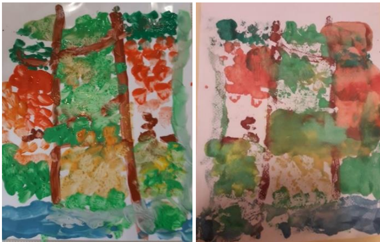
Oslikan rad na foliji i otisnut rad na papiru (F. M., 4,5 god)