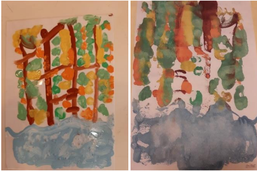
Oslikan rad na foliji i otisnut rad na papiru (S. I., 4. 9 god.)