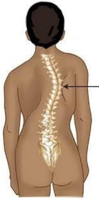
Slika 2. Skolioza 3

bolova u drugim dijelovima tijela kao što su vrat, donji dio leđa, noge i sl. Najbolja prevencija je naravno aktivno bavljenje pravilnom izvedbom kinezioloških aktivnosti. Jedan od oblika deformacije kralježnice koje susrećemo kod djece mlađe škole dobi je skolioza (grč. skolios – iskrivljen) (slika 2.). Ona se uglavnom javlja tijekom nagloga rasta, a rezultira iskrivljenošću cijele ili dijela kralježnice (Mišigoj-Duraković, 2008).