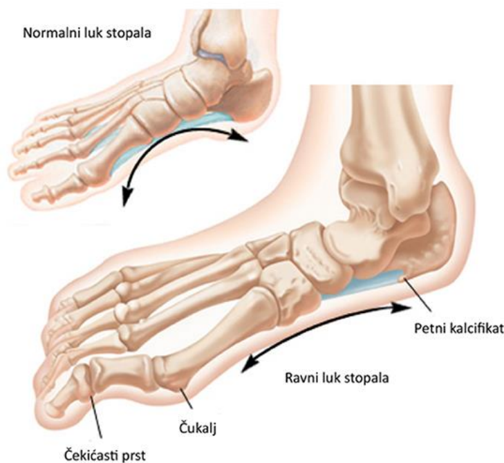
Slika 3. Normalno i ravno stopalo 4

načinom života i velikom ponudom brze hrane (Holford i Colson, 2010). Kao posljedicu izostanka kineziološke aktivnosti možemo navesti i ravna stopala kod djece (slika 3.). Najčešće se javlja kod djece koja žive u gradovima, nasuprot onima koja žive na selu, zbog toga što ona većinom hodaju po tvrđim i ravnijim podlogama. Uslijed ravnih stopala djeca mogu osjećati bolove u koljenima i stopalima te u leđima. Najčešće se otkrije već pri upisu u prvi razred te je stoga potrebno odmah intervenirati (Burić, Lj. i sur., 2016).