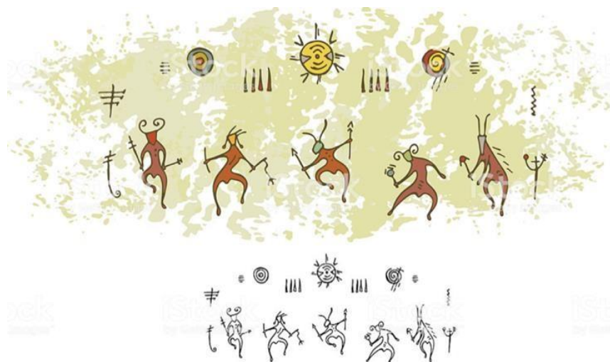
Slika 1. Ilustracija pećinske slike sa motivima plesa suncu