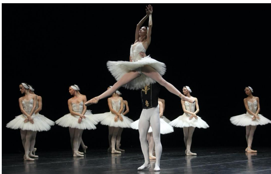
Slika 4. Umjetnički ples

Zadnji su umjetnički plesovi koji su nastali kroz razvoj baleta te imaju značajke osnovne baletske tehnike, od 20. stoljeća su prisutni u obliku slobodnije baletske tehnike te su se postupno oslobodili u vidu stroge forme. Estetski doživljaj te koreografija prepoznatljivi su dijelovi ove vrste plesa.