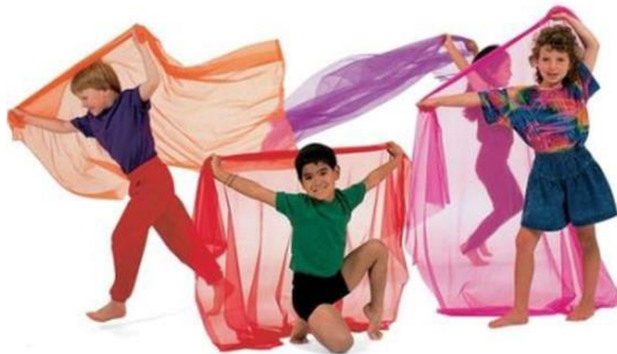
Slika 6. Kreativni ples djece s maramama

uratka. Kostimi, lutke, glazbala i drugi poticaj dopuštaju lakše uživanje, kao i instrumentalna glazba (Braković, 2015).