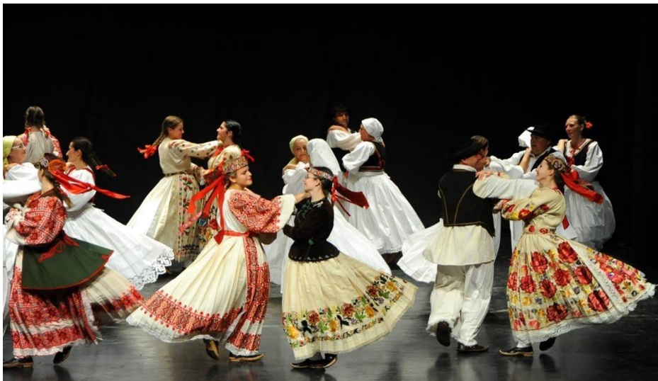
Slika 2. Nastup narodnog plesa

Hrvatska folklorna baština obuhvaća velik broj plesova (jednostavne, složene, solo plesove, masovne), u najrazličitijim prostornim oblicima; od jednostavnih ritmičkih do složenih plesova neparnih ritmovima. Pojedini plesovi javljaju se u brojnim oblicima, a pojedincima je dopušteno više ili manje slobodno improvizirati u okviru određenog ritmičkog, prostornog i stilskog okvira. Stil ima vrlo važnu ulogu, zbog čega se nekad gotovo identični ples prilično mnogo razlikovao svojim stilom od kraja do kraja (Ivančan, 1996 prema Bingula, 2017: 23).