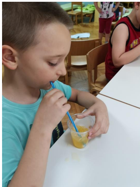
Slika 4 Puhanje slamkom