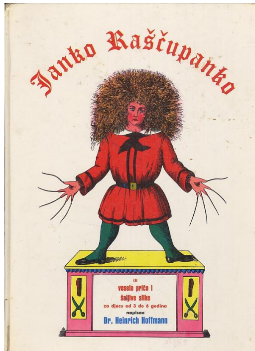
Slika 1. Ilustracija Janka Raščupanka

pohvale, naišla i na mnoge kritike jer su u slikovnici dječja ponašanja ali i kazne za ta ponašanja bile preuveličane pa su mnogi pedagozi isticali da bi Struwwelpeter (Janko Raščupanko) mogao potaknuti djecu na nepodopštine odnosno čitanje o pretjeranom kažnjavanju moglo bi izazvati traume (Majhut i Batinić, 2017).