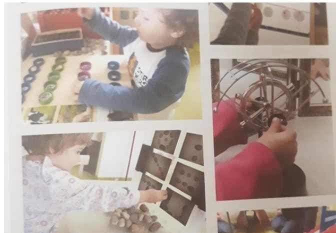
Slika 5. Korištenje pedagoški neoblikovanih materijala za razvoj fine motorike (Slunjski 2016, 14)

Razvijanje fine motorike postiže se nizanjem, uvlačenjem i utiskivanjem (npr. kuglica ili perlica na niti konca, vađenje papira iz boca, ili uvlačenjem meke žiceu navlake ili slamke ) (Došen-Dobud, 2004).