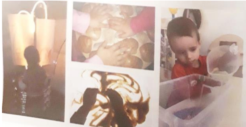
Slika 4. Aktivnosti sa svjetlom i aktivnost prelijevanja vode u jasličkoj skupini (Slunjski, 2016: 13)

razvoja osjeta vida odlične su aktivnosti istraživanja svjetla i sjene uz pomoć raznih svjetiljki, prizma ili svjetlećeg stola. „Oštrina vida u prvom se godini života stalno povećava, dostižući razinu blisku onoj kod odraslih osoba u dobi od 6 mjeseci“ (Berk, 2007:134), stoga je važno poticati razvoj vida u toj dobi.