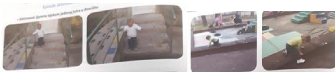
Slika 2. Vanjski prostor (Slunjski, 2008:34, 36)

Kretanje je iznimno prisutno kod djece jasličke dobi. Neovisno o tome uče li tek hodati, puzati ili su već savladali sile gravitacije, kretanje je važno za unapređenje percepcije, intelektualni i cjelokupni psihosomatski razvoj, otkrivanje sebe i okoline te sagledavanje i orijentaciju u prostoru (Došen-Dobud, 2004). „U većini jaslica i predškolskih ustanovama postoje i divno oblikovani parkovi s dječjim toboganima, mogućnostima za penjanje, kolicima i još mnoštvo toga“ (Schäfer, 2015,57). Dječji vanjski prostori mogu biti opremljeni ljuljačkama ili prostorima za igru s pijeskom, toboganima ili drugim materijalima koji potiču djecu na igru i kretanje. Vanjski prostor je potrebno osigurati za boravak djece jasličke dobi, omogućiti im prostor gdje mogu puzati bez opasnosti od sudaranja s djecom koja hodaju i trče. Potrebno je ukloniti opasne materijale i često provjeravati sigurnost i ispravnost sprava u dvorištu. Poželjno je da površina igrališta bude prekrivena materijalom koji će ublažiti posljedice pada (Stokes Szanton, 2005) i spriječiti djecu da stavljaju rasute materijale u usta. Dvorište treba biti ograđeno, a ako sadrži vodenu površinu ona također treba biti ograđena.