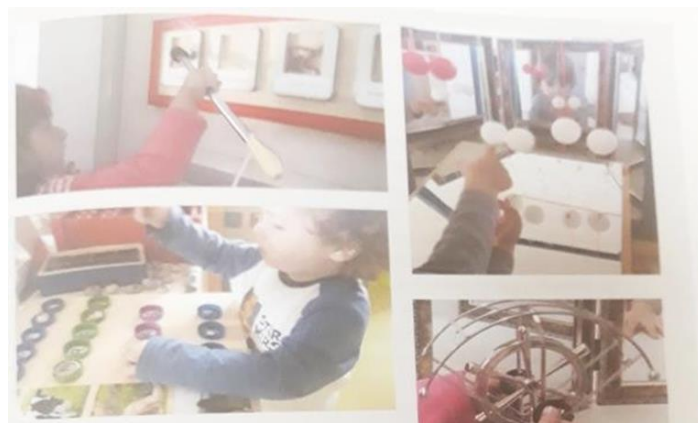
Slika 1. Prikaz materijala koji su ponuđeni djeci jasličke dobi (Jugović, 2016:14)

Odgojno-obrazovni proces s djecom jasličke dobi predstavlja veći izazov nego odgojno- obrazovni proces s djecom vrtičke dobi iz razloga što su njihove razvojne mogućnosti, najčešće, još slabije razvijene te imaju limitirana iskustva u odnosu na kronološku dob. Razlog tome se nalazi u nerazumijevanju dječjih sposobnosti te podcjenjivanju istih (Jugović, 2016, prema Slunjski, 2016). Stoga dolazi do restrikcije prostorno-materijalnog okruženja i poticaja za razvoj djeteta, a time se koči prirodni rast i razvoj samog pojedinca. Možemo zaključiti kako je potrebno promijeniti odgajateljevu viziju sposobnosti djeteta jasličke dobi te ponuditi poticajne materijale (Silić, 2007) i bolju prostorno-materijalnu opremljenost kako bi se postigao cjelokupan djetetov potencijal, što u konačnici zagovara i Nacionalni kurikulum.