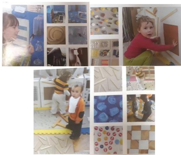
Slika 6. Istraživanje uz pomoć pedagoški neoblikovanih materijala te senzorički podražaji

Neki od primjera sadržani u knjizi Edite Slunjski (2008), Dječji vrtić- Zajednica koja uči: