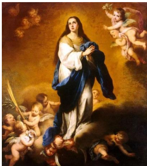
Slika 9. Bezgrješno začeće Blažene Djevice Marije

Djevica Marija zauzima posebno mjesto kako u pobožnostima vjernika, tako i u samoj liturgiji. Budući da je Blažena Djevica Marija Isusova majka, njoj zasigurno u životu svakog vjernika pripada veliko i važno mjesto. Njoj se mnogi utječu, posebice djevojke i žene kojima je ona duhovni i životni uzor. Blagdan Bezgrješnog začeća Blažene Djevice Marije slavi se 8. prosinca. Ovim blagdanom se želi istaknuti bezgrješnost Marijina začeća te veličina i važnost Bogorodice Marije koja je rođena bez grijeha u odgovornosti da rodi Isusa, sina Božjega. „Bog je Mariji, Isusovoj majci, podario milost sačuvanosti od istočnoga grijeha od početka njezina postojanja.” 44 Dakle, važno je shvatiti da se ovim blagdanom veliča Marija začeta bez grijeha, a ne Marija koja je začela bez grijeha. Na taj se način razlikuju blagdan Bezgrješnog začeća Blažene Djevice Marije te Blagovijest. Vjernici se na ovaj dan prisjećaju Marijinih riječi koje je rekla anđelu Gospodnjem kad joj je navijestio da će začeti i roditi Isusa, a to su bile riječi: Evo službenice Gospodnje, neka mi bude po riječi Tvojoj!