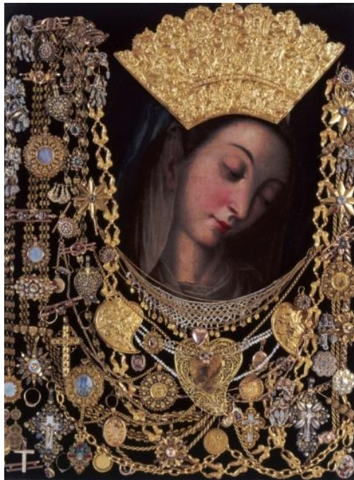
Slika 23. Slika Čudotvorne Gospe Sinjske

Razlog štovanja Gospe Sinjske u Sinjskoj krajini nije potrebno pitati, jer se zna – Gospa je obranila Sinj davne 1715. godine kad su ga Turci napali. To zna svako dijete još od malih nogu i Sinjani štuju i poštivaju Gospin čin i pomoć u nevolji. Mnoštvo je pjesama koje opjevavaju taj čudesan čin podno Sinja, a mnogo je simbolike i u bogoslužjima, građevinama, blagdanima i slično. Primjerice, Sinjani su digli Gospin kip na najvišem brežuljku u gradu. S ovoga brežuljka pucaju i mačkule kada se održava Sinjska alka koja je, također, spomen na turski napad i čudesnu obranu Sinja. Osim toga, posljednjih nekoliko godina u Sinju se održava manifestacija povodom ove čudesne obrane, a zove se Opsada Sinja. Radi se o predstavi u kojoj se upriliče događanja iz borbi protiv Turaka, a sve se održi na sinjskoj Pijaci kako bi što više naroda moglo vidjeti ove prizore. Na taj način Sinjani čuvaju tradiciju i oživljavaju uspomene na čudesne dane obrane Sinja.