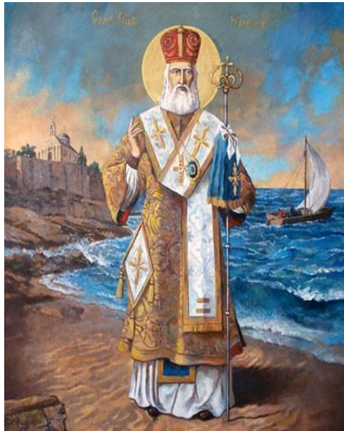
Slika 8. Sveti Nikola

preminuo nasljednik njegova strica, Nikola je izabran za biskupa u Miri. O životu svetog Nikole postoji mnoštvo, ali je sačuvano nekoliko predaja i legendi. Tako, primjerice, jedna od legendi govori kako je Nikola pribavio miraz za tri kćeri jednog bogataša koji je ostao bez novca, a svetac je to učinio tako što je tri noći na bogatašev prozor ubacivao vreću sa zlatnicima. Otkriven je nakon treće vreće, ali je zamolio plemića da to ostane tajna kako se ne bi saznalo da je to on učinio. Iz ove legende potječe tradicija tajnog darivanja poslušne i dobre djece. No, darivaju se i loša djeca tako da dobiju šibu u čizmicu. 42