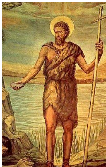
Slika 20. Sveti Ivan Krstitelj

„U hrvatskoj tradicijskoj baštini, kao i u tradicijskoj baštini drugih naroda u Europi i svijetu, uz blagdan sv. Ivana Krstitelja vezuju se razni običaji, ophodi, divinacije, vjerovanja, hodočašća, procesije, svete mise, pučka veselja, sajmovi, ivanjske pjesme, molitve.” 95 Danas su u Sinjskoj i Imotskoj krajini sačuvani običaji preskakanja vatre te razne molitve, procesije, svete mise i hodočašća.