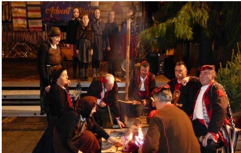
Slika 12. Badnjak

Nakon običaja unošenja i spaljivanja badnjaka, slijedila je misa polnoćka. Misa polnoćka bila je najsvečaniji dio Badnjaka, večer u kojoj su vjernici diljem crkava dočekivali Isusovo rođenje i slavili euharistiju. Pjevale su se brojne božićne pjesme koje su pjevale o veselju, nadi, miru i spasenju. Tako su neke od najpoznatijih Radujte se, narodi, Svim na zemlji, Kyrie eleison, Djetesce nam se rodilo, Veselje ti navješćujem i slične.