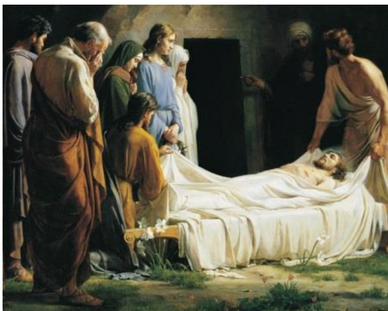
Slika 15. Isusa stavljaju u grob