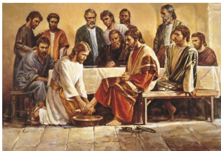
Slika 13. Isus učenicima pere noge

Na misi Velikog četvrtka pjevaju se prigodne pjesme koje govore o Isusovoj mucii, trpljenju, Judinoj izdaji i slično. Veliki četvrtak dan je ustanovljenja svete mise, a kroz posvećeno tijelo, odnosno hostije i krv, odnosno vino, vjernici osjećaje Isusovu prisutnost.