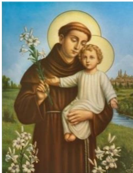
Slika 19. Sveti Antun Padovanski

odmah su pronijela padovanska djeca uzvicima: Umro je svetac!, a prema predaji, na dan njegove smrti crkvena zvona u Lisabonu sama su od sebe zazvonila.” 91 Danas se na blagdan svetog Ante održavaju blagoslovi djece, a posebice je lijep blagoslov djece u Sinju gdje se okupi mnoštvo djece s ljiljanima na popodnevnoj svetoj misi i na taj se način obilježi dan ovog višestrukog zaštitnika i zaštitnika djece. Prije su na ovaj dan bili organizirani brojni derneći i slavlja kako svjedoči i jedna od kazivačica. Na slikama se sveti Ante prikazuje s ljiljanom i djetetom u rukama. 92 Što se ljiljana tiče, on je vezan i za još neke svece poput svetog Josipa, svete Klare, svetog Dominika. 93