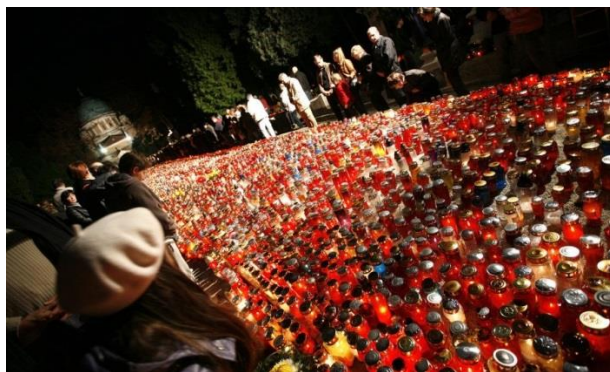
Slika 24. Dušni dan

Prije je na Dušni dan počimala misa zornica, u čet'ri sata ujutro. I sve do osan sati bi se govor'le tihe mise i odrišenja za mrtve. Onda bi se išlo na groblje davat odrišenje. Na Svi svete ti je znalo bit 'vol'ko slane prije. A sad ideš u kratkon rukavu za Svi svete. 101