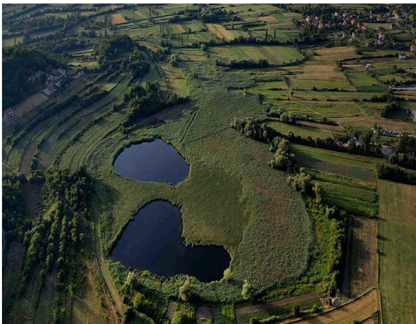
Slika 4. Miloševo i Stipančevo jezero

Selo je okruženo planinama Kamešnicom, Plišivicom i Vrdovom. Prošaralo ga je nekoliko manjih brežuljaka kao što su Krinj, Kekezov kuk, Perkovića brig i Šarića glavica od kojih je većina dobila naziv po prezimenu stanovnika – Kekezi, Perkovići i Šarići. Plodno polje napaja rijeka Cetina sa svojim pritocima Vojskovom i Jejovcem. Vojskova ima zanimljivo ime koje je „dobila po vojsci koja je nekad taborovala na njenom izvoru.” 19 Tu je i Miloševo jezero koje ima svoj specifičan izgled. Naime, nalikuje srcu usred zelenih livada u okolici, čineći biser podno brda Krinj. Upravo je Miloševo jezero važan lokalitet za nastavak ovog rada o čemu će više biti pisano u nastavku. U Hrvacama se nalaze 52 izvora pitke vode, ali i dva manja jezera (već spomenuto Miloševo i Stipančevo jezero), što svjedoči bogatu floru i faunu ovog kraja.