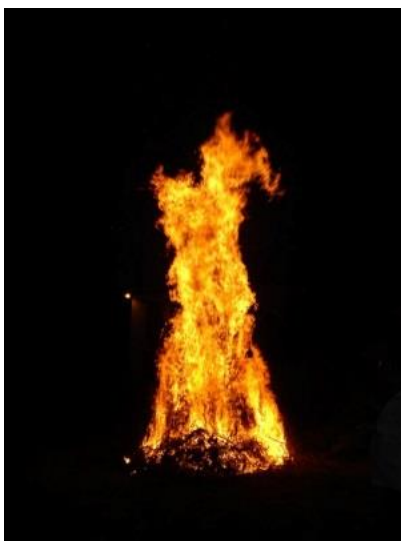
Slika 21. Svitnjak

Večer uoči svetoga Ivana pale se svitnjaci pa bi se oni priskakali. Obično za te svitnjake, on pada točno kad se prve trave počmu kositi i onda se čist'la pojta, sjenici bi se čist'li. Stara slama i sijeno bi obično za to poslužili. Sveti Ivan označava kosidbu. Uvik je bilo zanimljivo to priskakanje vatre. Uvik se pričalo 'ko je kako priskočio, 'ko je najbolje priskaka i tako. Smatralo se da je dobro priskakat vatru jer te onda cilu godinu ne bi kosti bol'le, ka' jer si uvatijo toplinu tog svitnjaka. Bilo i' je šta bi završili u vatri pa bi bili opečeni i svakakvi, a bilo je svega. 97