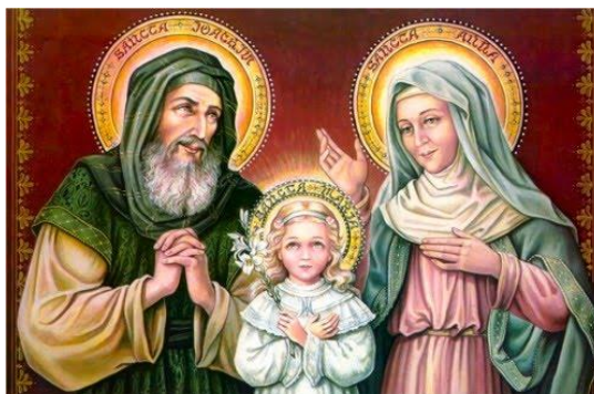
Slika 22. Sveti Joakim i Ana