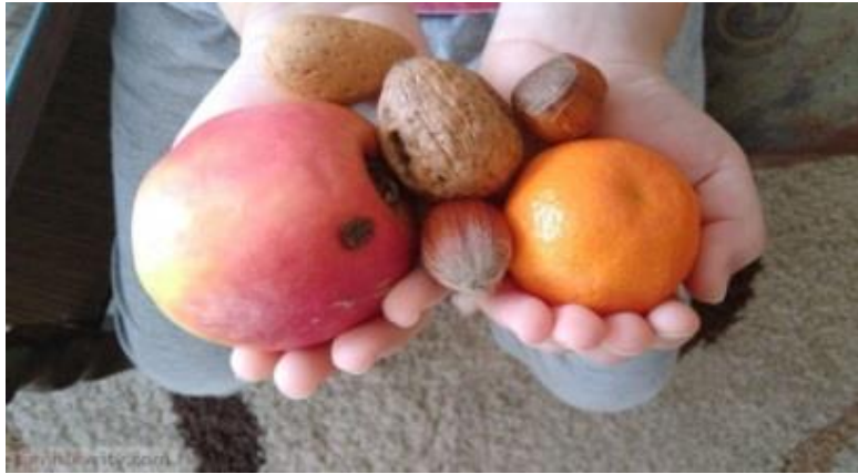
Slika 10. Darivanje za Materice