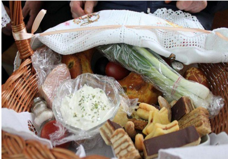
Slika 16. Blagoslov hrane