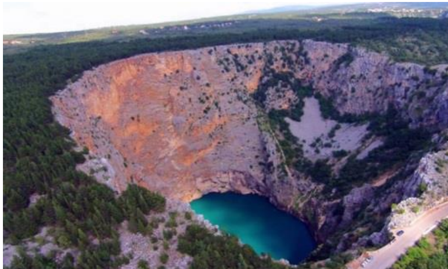
Slika 6. Crveno jezero

Crveno je jezero dobilo ime prema stijenama crvene boje, a smješteno je oko 1,5 kilometara zapadno od gradske jezgre. „Legenda o nastanku Crvenog jezera koja se poznaje u narodu povezana je uvelike s prigodnim tekstovima iz Biblije. Temelj svih legendi o Gavanovim dvorima čini propast bogataševih Gavanovih dvora gdje je nastalo Crveno jezero. Gavan je, kako kaže legenda, imao svega osim duše, bio je zao čovjek.