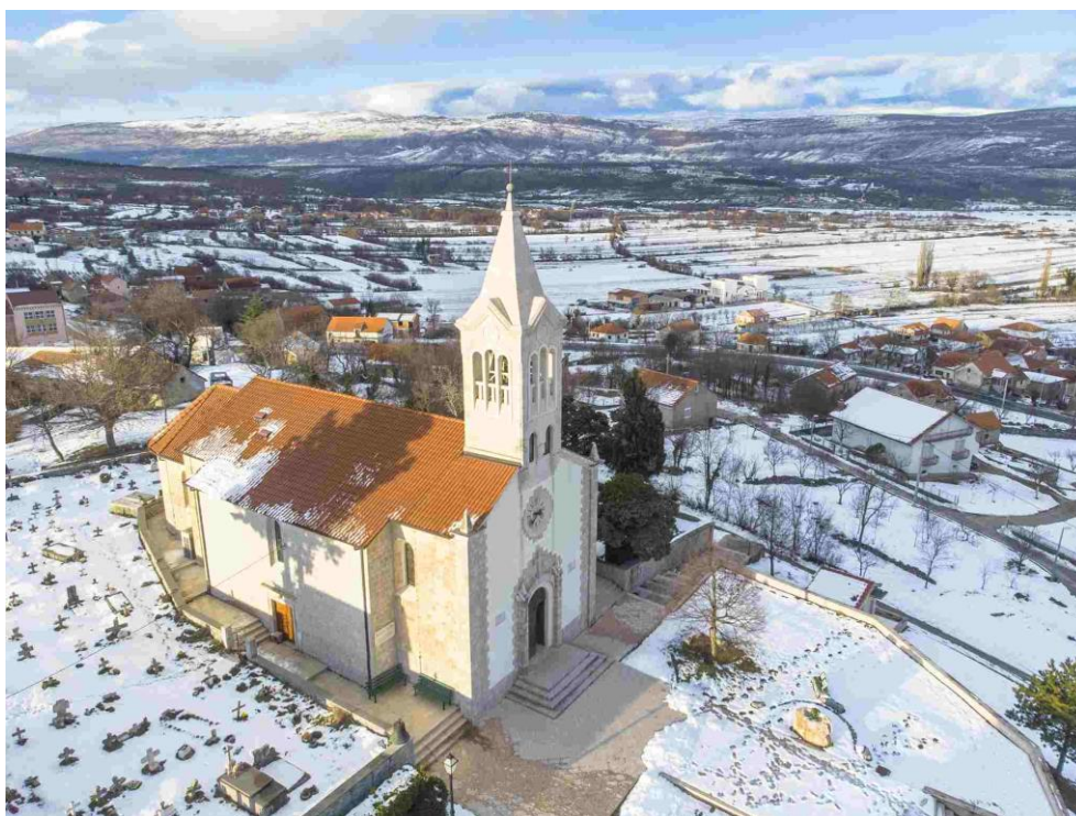
Slika 3. Crkva Svih svetih u Hrvacama

Hrvace su malo naselje u Cetinskoj krajini, a za sve one koji ne znaju gdje se nalazi, smjestit ćemo ga unutar naše lijepe krajine. Hrvace su naselje koje se nalazi ispod brežuljaka koji okružuju Hrvatačko polje koje se nalazi uz cestu od Sinja prema Kninu. Ovo naselje nalazi se u sjeverozapadnom dijelu Splitsko-dalmatinske županije, a samim time spada u jedno od mjesta Sinjske i Cetinske krajine. Crkva u Hrvacama posvećena je Svima Svetima. Hrvatačka crkva posvećena je Svim svetima, a podignuta je davne 1871. godine na čijem je mjestu prije bila crkva iz 1686. godine. Zaštitnica crkve i Hrvaca jest Gospa Žalosna. Blagdan Gospe Žalosne Hrvatačani slave 15. rujna. Gospa Žalosna u župi je zvana i Gospom od sedam žalosti. Uoči blagdana Gospe Žalosne u Hrvacama se svake godine održava trodnevna popraćena duhovnim i svjetovnim sadržajima i programima.