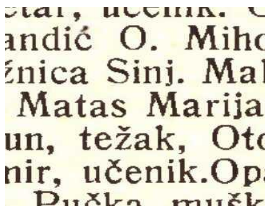
Slika 5. Ljetopis društva Svetog Jeronima, godina 1906.

O prezimenu Matas nema mnogo literature niti spoznaja i ne zna se na koji način je prezime nastalo niti gdje se spominje osim u navedenom izvoru.