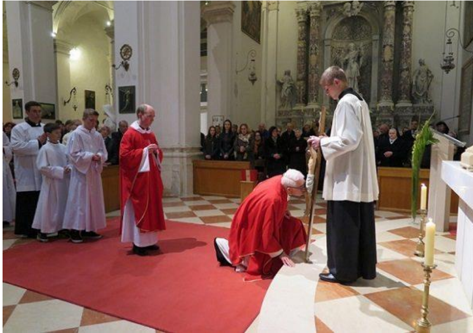
Slika 14. Ljubljenje križa na Veliki petak

za crkvu ili za posebne nakane ako postoje u župnoj zajednici. Za vrijeme ljubljenja križa pjeva se pjesma Puče moj .