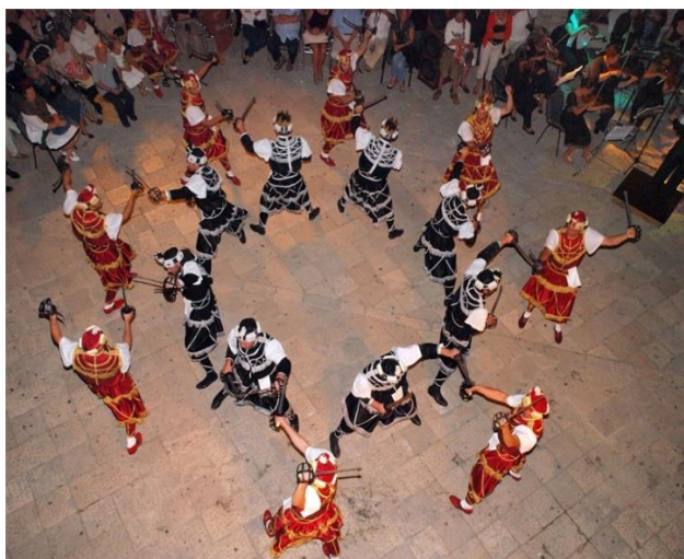
Slika 1. Prikaz korčulanske Moreške

Poslovice možemo čuti u svakodnevним razgovorima, posebice s bakama i djedovima koji djecu zabavljaju najčešće šaljivim i zabavnim zagonetkama i poslovicama koje djeca pamte i kasnije prepričavaju jedni drugima kao zgodu. Upravo to je jedan od načina oživljavanja tradicije i usmene književnosti čemu možemo svi pridonijeti gotovo svakodnevno. Postoji i mnoštvo obrednih dramskih tekstova koji su napisani uglavnom u obliku stihova, a ponekad mogu biti i rezultat utjecaja pisane književnosti, a primjer ovakvih obrednih tekstova su korčulanska Moreška ili paška Robinja .