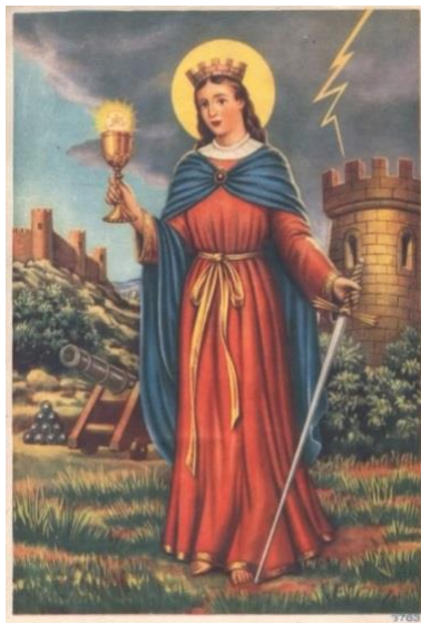
Slika 7. Sveta Barbara