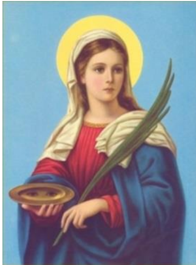
Slika 11. Sveta Lucija

je sama sebi iskopala. Na kraju je taj mladić postao kršćanin jer je bio oduševljen Lucijinim primjerom življenja vjere i kršćanstva. 49 Helena Dragić opisuje kako je Lucija čudesno vidjela i nakon što je ostala bez očiju i vida. 50