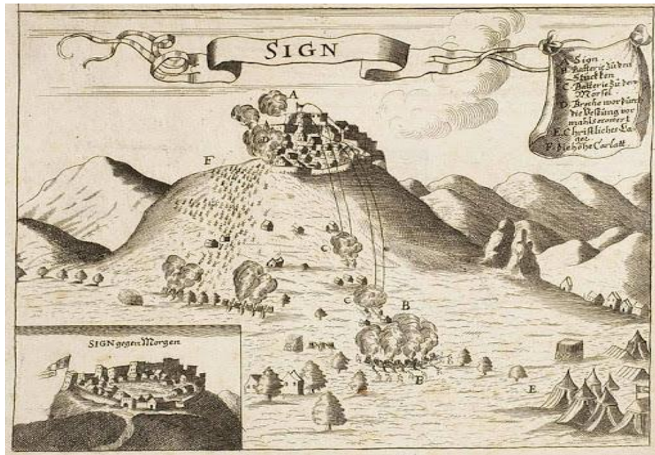
Slika 1 Uspješno osvajanje Sinja 1868. godine

i uskoro se na toj istoj glavnoj kuli zavijorila zastava sv. Marka. Ovim uspjehom je Mletačka Republika dobila vrlo važnu utvrdu koja je zbog položaja predstavljala predstražu Klisu, a nadgledala je bogato polje koje je u ovom trenutku bilo zapostavljeno, a sam kraj je bio napušten i nenaseljen. 19 Budući da se očekivao turski protuudar zidine su se krenule obnavljati, a posada se spremala za obranu novoosvojene utvrde.