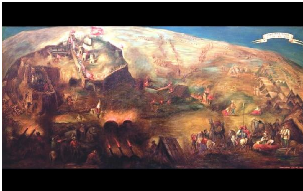
Slika 4 Prikaz opsade sinjske utvrde

održava u čast pobjede nad Osmanlijama. Tradicija je to koja traje već 305. godina i kao takva predstavlja jednu od najvrjednijih kulturnih manifestacija hrvatskog naroda.