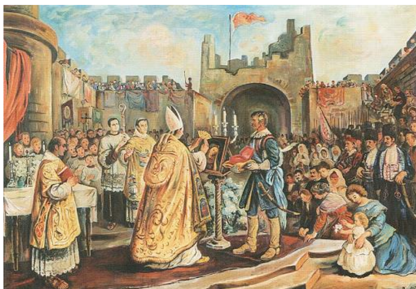
Slika 5 Krunjenje slike Čudotvorne Gospe Sinjske 1715. godine