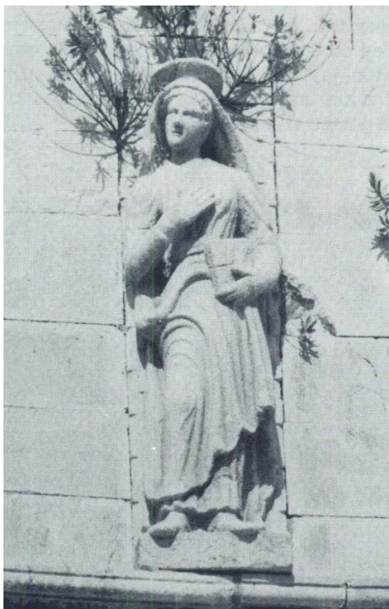
Slika 11. Prikaz Djevice Marije na zbornoj crkvi Sv. Marije u Pagu (Preuzeto: Hilje, E. (1989). Marko Andrijić u Pagu. Prilozi povijesti umjetnosti u Dalmaciji, 28 (1))

Međutim, skulptura Gabrijela, Jurja i Mihovila svojom nedovršenošću otežavaju usporedbu. Hilje smatra da su i ti likovi u potpunosti djelo Andrijića, ali zbog nedostatka vremena i materijala se uočavaju nesavršenosti i nedovršenosti tih djela. Rozete i reljef Krista također podsjećaju na one na Korčulanskoj katedrali pa Hilje zaključuje da je cjelokupni dio pročelja crkve sv. Marije plod suradnje Andrijića i Allegrettija. Hilje potvrđuje pretpostavke Fiskovića o njegovom autorstvu kapitela na stupovima što odvajaju srednji od bočnih brodova. S obzirom da je Andrijić bio i graditelj, Hilje smatra da istom prilikom izvedena artikulacija unutrašnjosti građevine, podignuti zidovi srednjeg broda, te postavljeno krovništvo. To saznanje omogućuje nam određivanje faza gradnje crkve. U kroz prve dvije faze braća Dimitrov podižu svetište, sagrađeni su bočno zidovi, možda i pročelje do visine bočnih zidova. U trećoj fazi angažiran je Juraj Dalmatinac za dovršenje zida nad trijumfalnim lukom i pročelja, a u ovoj fazi mogla bi pripadati i izrada portala od kojeg je učinjeno vrlo malo. U četvrtoj fazi, prije 1487. godine, Marko Andrijić zajedno sa pomoćnicima podiže zidove