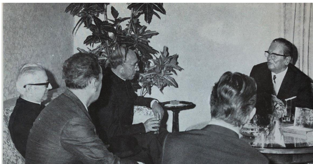
Posjet Agostina Casarolija Josipu Brozu Titu na Brijunima 26. 8. 1970. godine (CVRLJE, V. (1980). Vatikan u suvremenom svijetu , Zagreb: Školska knjiga.)