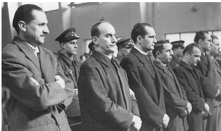
Slika br. 1. Suđenje Alojziju Stepincu

( https://www.cro-portal.com/hrvatska/povijesni-dan-hrvatski-sud-odlucuje-o-reviziji-komunistickog-sudenja-alojziju-stepincu ; 3. 9. 2020.)