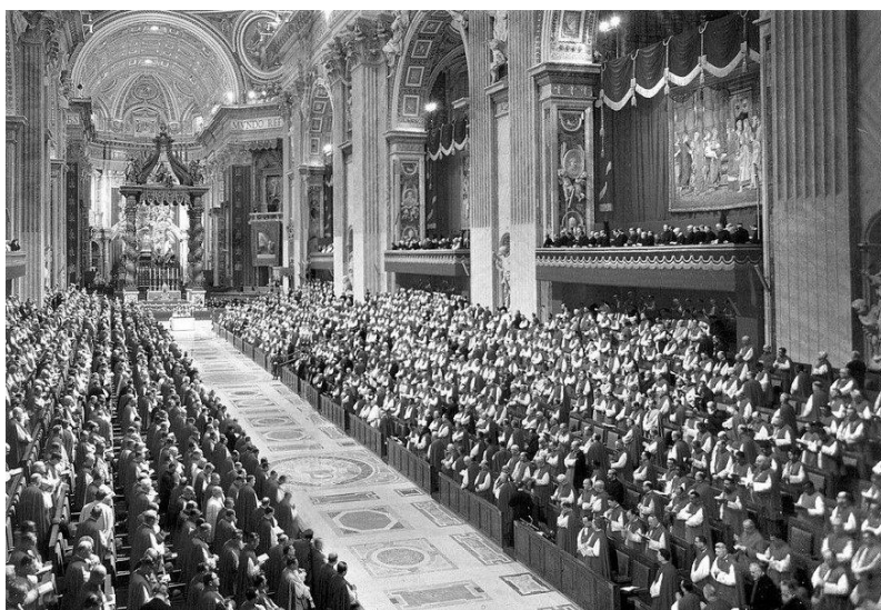
Slika br. 4. Drugi vatikanski koncil 1962. godine

( https://www.enciklopedija.hr/natuknica.aspx?ID=47088 ; 3. 9. 2020.)