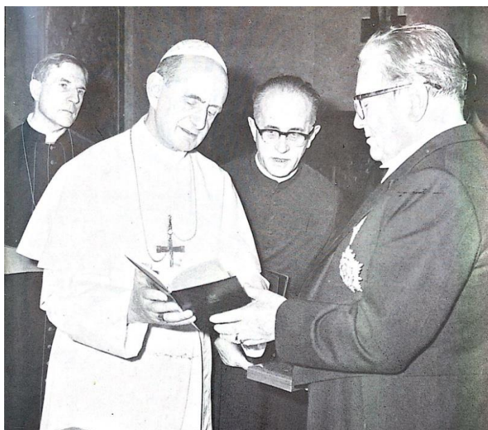
Slika br. 6. Posjet Josipa Broza Tita papi Pavlu VI. 29. 3. 1971. godine) (CVRLJE, V. (1980). Vatikan u suvremenom svijetu , Zagreb: Školska knjiga.)