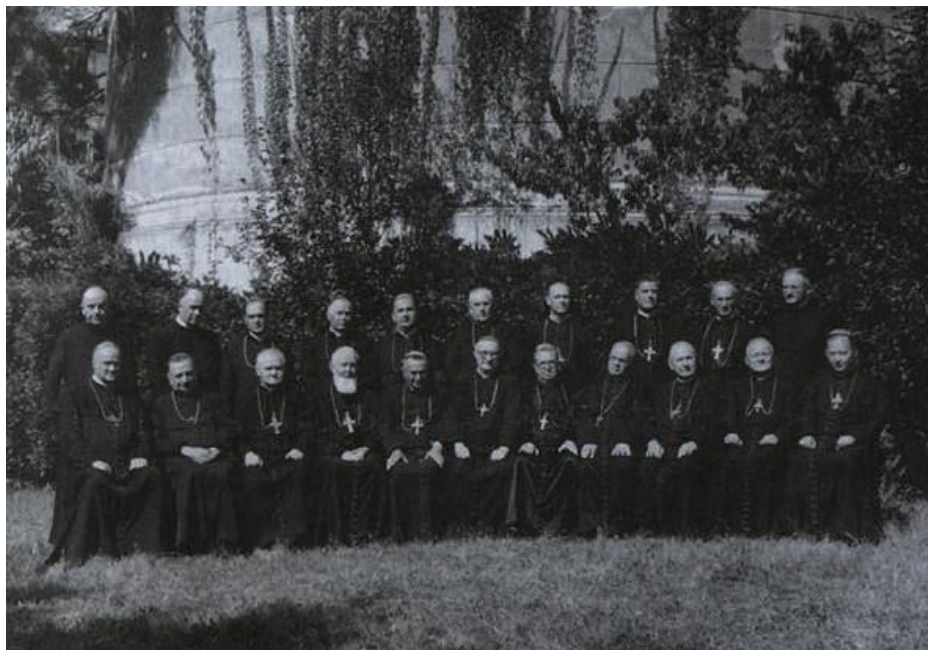
Sudionici Biskupske konferencije Jugoslavije 22. rujna 1961. godine, kojom je predsjedao Franjo Šeper.

(CVRLJE, V. (1980). Vatikan u suvremenom svijetu , Zagreb: Školska knjiga.)