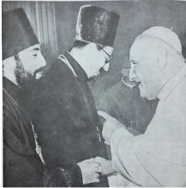
Promatrači Ruske pravoslavne Crkve, Vitalij Borovoj i Vladimir Kotljarov, u razgovoru s papom Ivanom XXIII.

(CVRLJE, V. (1980). Vatikan u suvremenom svijetu , Zagreb: Školska knjiga.)