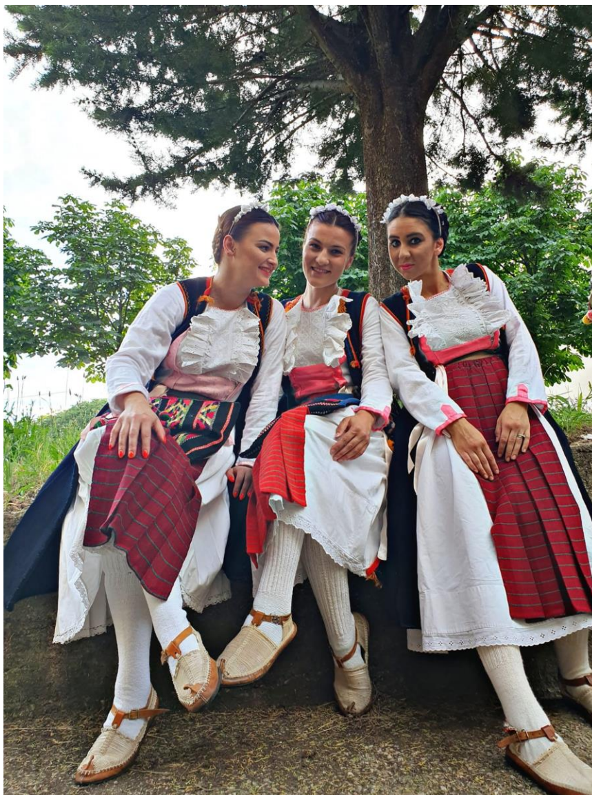
Slika 4. Djevojke u narodnim nošnjama

obruč) sa dvije srebrne spijade (srebrne loptice na dužim iglama) preko svega šudar (rubac vezan pod bradom).