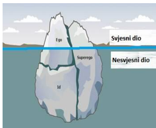
Slika 1. Struktura čovjekove ličnosti prema Freudu

Promišljanja Sigmunda Freuda, bečkog psihijatra, koji se smatra „ocem psihoanalize“ potaknula su istraživanja ličnosti, te je sam formulirao sustavnu teoriju u ovom dijelu psihologije (Petz, 2010). Freud je svoju teoriju ličnosti odlučio prikazati na način da ličnost slikovito prikaže kao santu leda. Za santu leda se odlučio upravo iz razloga što je zaključio da je ljudska osobnost poput ledenjaka. Samo vrh ledenjaka izdiže se iznad površine i to je ono što je čovjeku dostupno, dok je njegov velik dio ispod površine. Freudova santa leda izgleda slično santama u oceanima, odnosno vrlo mali dio sante se nalazi iznad vode, a 8 ili pak 9 desetina sante se nalazi pod vodom. Onaj dio sante koji se nalazi iznad vode prikazuje zapravo doživljaje pojedinca kojih je i sam svjestan. Negdje u razini vode ili pak malo ispod vode nalaze se doživljaji kojih je pojedinac svjestan samo donekle i uz pomoć nekih metoda dok ostali dio sante koji se nalazi ispod vode prikazuje nesvjesne doživljaje pojedinca. Upravo taj dio sante koji se nalazi ispod vode zapravo se odnosi na najdublje misli, strahove koje pojedinac osjeća a ne želi ih pokazati i žudnje koje su skrivene duboko u njemu.