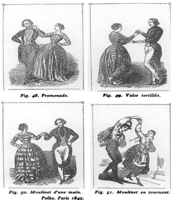
Slika 3.: Polka, Pariz 1848.

Sve elitne plesne priredbe u 19. stoljeću započinjale su „polonezom“, plesom poljskog kraljevskog dvora u tročetvrtinskom taktu. Poloneza je ples u tročetvrtinskom taktu koji se dugo zadržao u „svijetu“ plesa i kulture. Poslije 1825. godine počeo se razvijati ples „galop“ u dvočetvrtinskom taktu koji je preteča češkoj polki (Ivančan, 1985). Sredinom 19. stoljeća, u vrijeme kada su se počeli izdavati prvi plesni priručnici, polka je bila poznata i popularna plesna vrsta u Europi i u to vrijeme plesno ime polka imalo je međunarodno značenje. Iako su se povjesničari plesa jako trudili objasniti da naziv polka, koji jednostavno znači "poljski", mora imati drugačije značenje, polka je ples koji svoje korijene vuče iz Češke (Bakka, 2001). Polka, koja je stvorila pomamu u Parizu početkom 1840-ih, uopće nije bila jednostavna, a Bakka (2001) ju je u svom radu nazvao "dvodobnom polkom kružne forme". Bio je to ples u paru s mnogim figurama od kojih je "okretanje u trajanju od dvije dobe" bio samo jedan od elemenata. To se jasno može vidjeti iz opisa i crteža iz toga razdoblja.