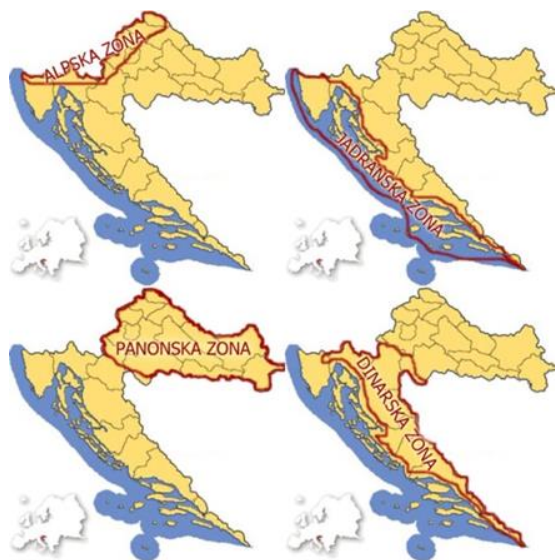
Slika 1. Plesne zone

Narodni plesovi prikazuju sliku javnog i obiteljskog života nekog kraja, a kolo kao osnovna forma narodnog plesa predstavlja simbol zajedničkog života nekog naroda. Svojom stvaralačkom intuicijom narod je pružio ogromno bogatstvo izražajnih formi, počevši od najgrubljih pa do profinjenih istančanih plesnih oblika (Srhoj i Miletić, 2000). U Hrvatskoj se narodni plesovi plešu po plesnim zonama; panonskoj, alpskoj, dinarskoj i jadranskoj. Hrvati se u raznim krajevima i prilikama koriste različitim nazivima za ples i njegovo izvođenje. Tako se npr. kolo može igrati, plesati, kolati i voditi, ples ili tanac se pleše, tanca, a polka se može npr. i polkati (Ivančan prema Bingula, 2017). Jednostavniji narodni plesovi iz zavičajnoga okružja pogodne su plesne strukture za djecu predškolske i mlađe školske dobi. Narodni plesovi zavičaja mogu se provesti kao jedna točka na nekoj priredbi s djecom koja imaju sklonost i želju za plesnim usavršavanjem (Šumanović i sur., 2005).