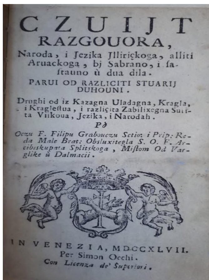
Slika 2. Naslovna stranica Cvita razgovora

Spomen na Grabovca obično nas asocira na Cvit razgovora , no Grabovac se javnosti predstavio i prije toga, svojim letkom Ljubazno ponukovanje , koji je otisnut 1729. Sadržaj letka odnosio se na hrvatske vojnike i časnike koji su služili Veneciji te su se, došavši u Italiju, lišili svojega izgleda, narodnih vojnih odora i običaja. Tim činom, smatrao je Grabovac, povrijedili su svoju zemlju Dalmaciju. Grabovac je svoj letak napisao kao opomenu tim vojnicima i časnicima, a ubrzo nakon njegova oštrog govora protiv takva ponašanja oglasio se dužd s naredbom da hrvatski časnici moraju nositi svoju nacionalnu odjeću. Svoj letak zajedno s duždovom naredbom Grabovac nakon dva desetljeća uvrštava u svoju knjigu Cvit razgovora naroda i jezika iliričkoga aliti aruckoga (Petrač, 1998). To je djelo Grabovac dovršio 1746., a tiskano je 1747. u Mletcima.