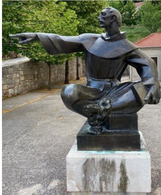
Slika 1. Kip fra Filipa Grabovca u Vrlici