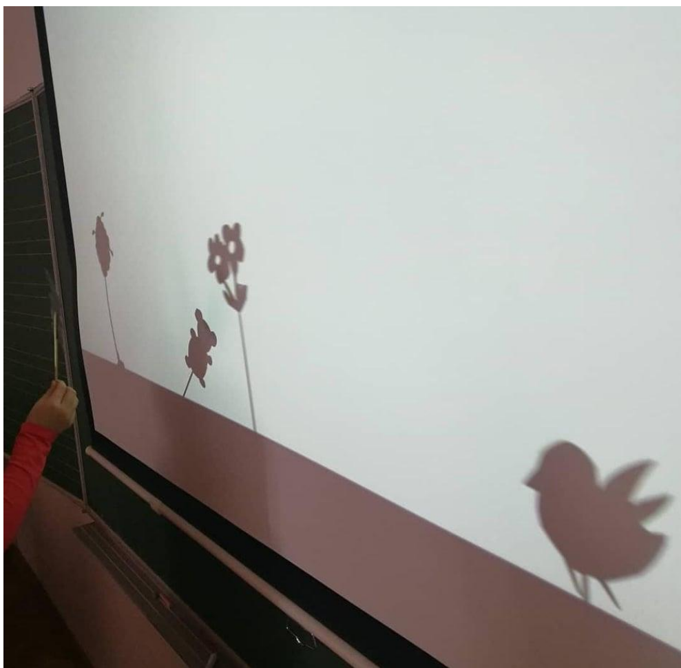
Slika 11 Kazalište sjena, PŠ Krušvar