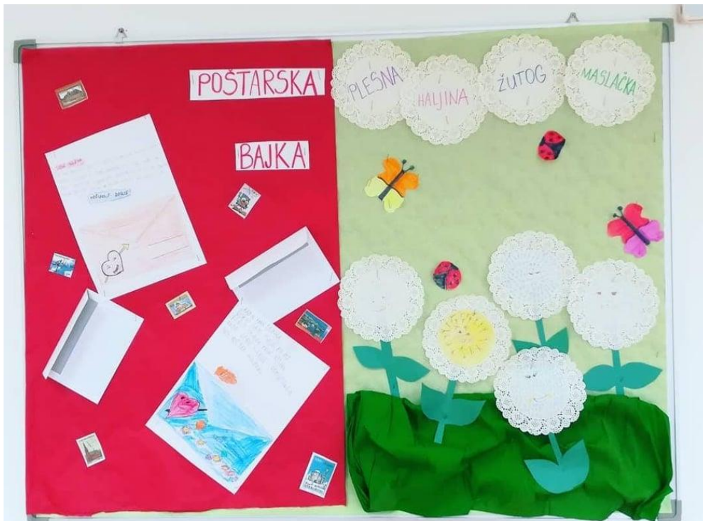
Slika 9 Karel Čapek: Poštarska bajka , PŠ Krušvar