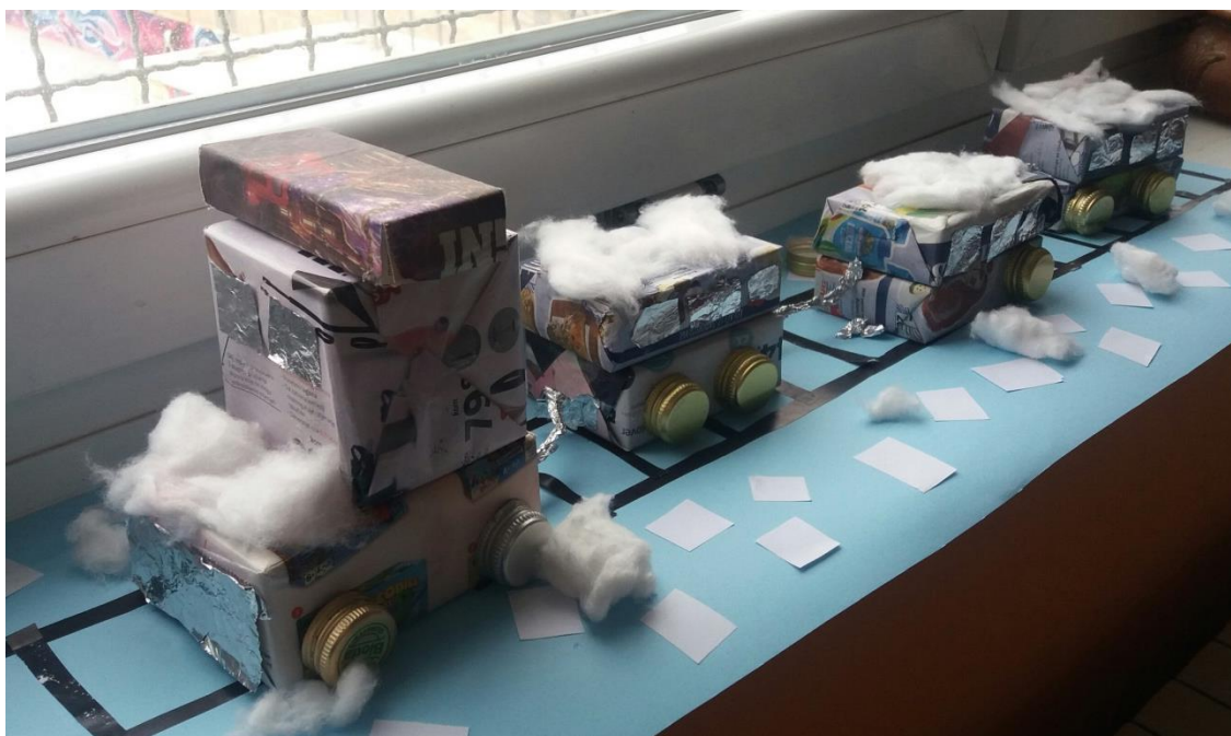
Slika 5 Mato Lovrak: Vlak u snijegu , OŠ Spinut, Split