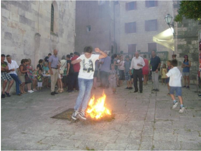
Slika 5: Preskakanje baldakina 12