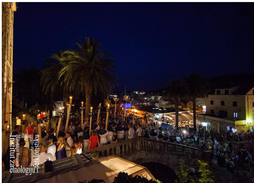
Slika 6: Sv. Todor 13