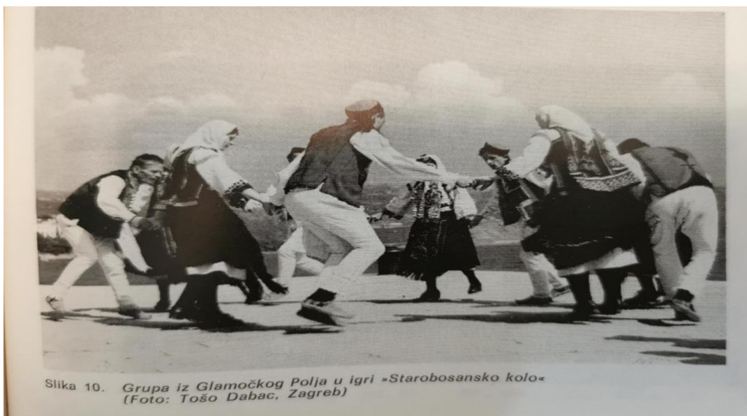
Slika 10. Grupa iz Glamočkog Polja u igri »Starobosansko kolo«