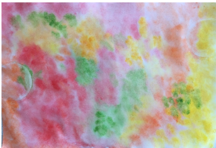
Slika 6. Djevojčica N. B. (4,5 g.) „Leptirova krila“

Nova skladba koju su djeca slušala bila je skladba sporoga tempa u dur tonalitetu – „Träumerei“. I na tu skladbu djeca su reagirala figurativnim i apstraktnim likovnim izričajem.